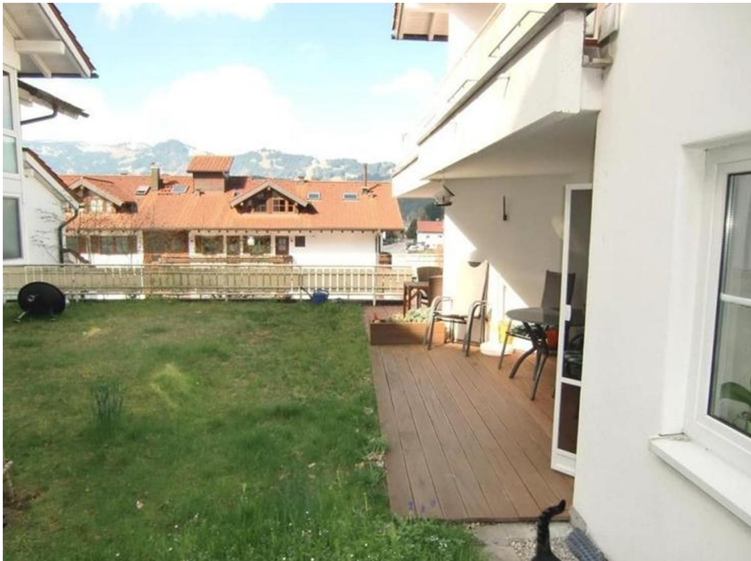
Terrasse mit Bergblick