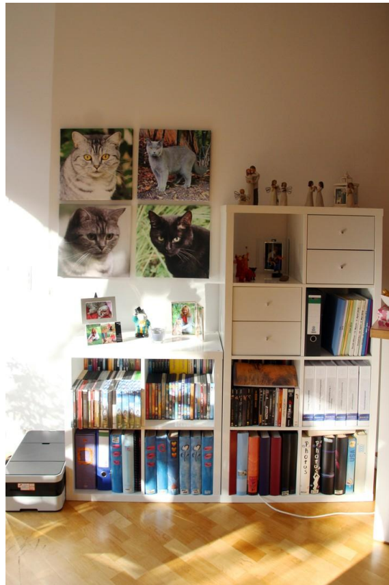
Regal im Essbereich