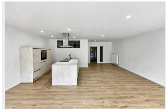
Blick in den Wohn- und Essbereich