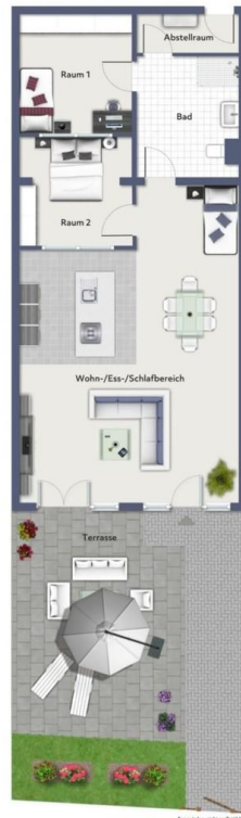
Grundriss der Wohnung