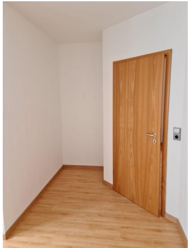
Kinderzimmer Bild 1