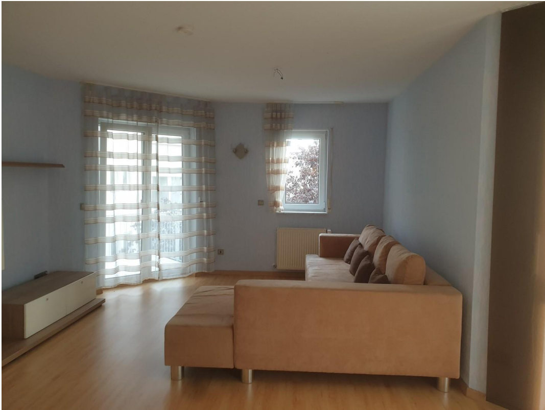
Wohnzimmer von Küche