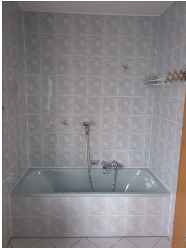
Badewanne im Bad