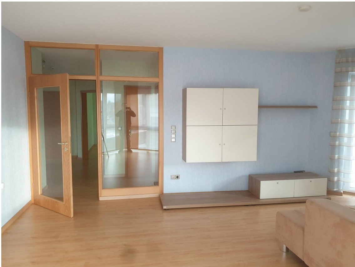
Wohnzimmer von Erker