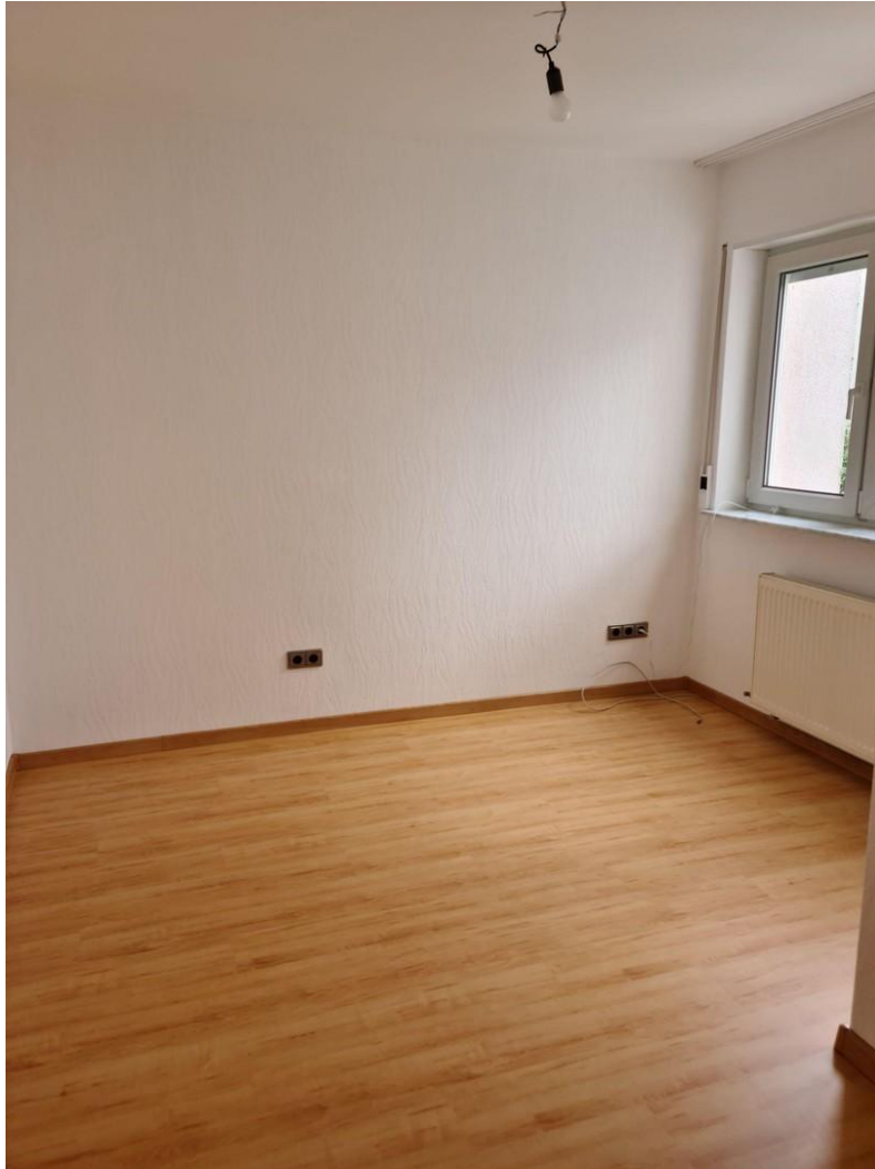
Kinderzimmer Bild 2