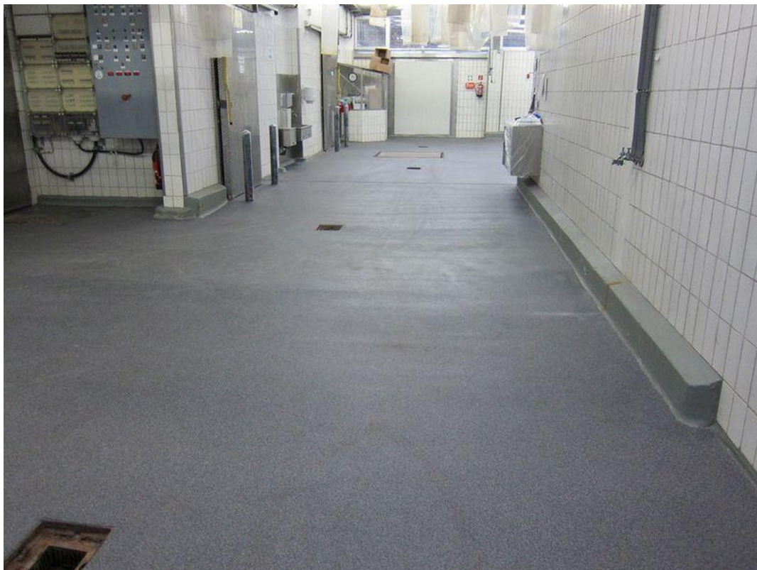
Blick von der Verladung