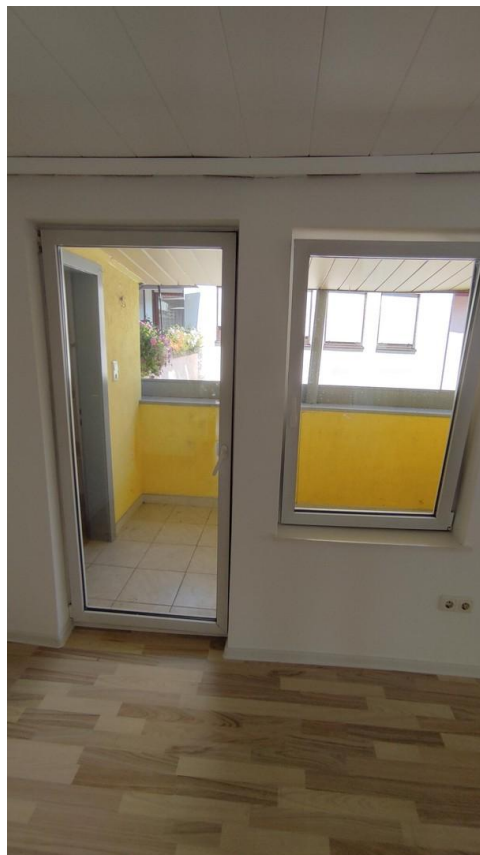
Zugang Balkon von Wohnzimmer