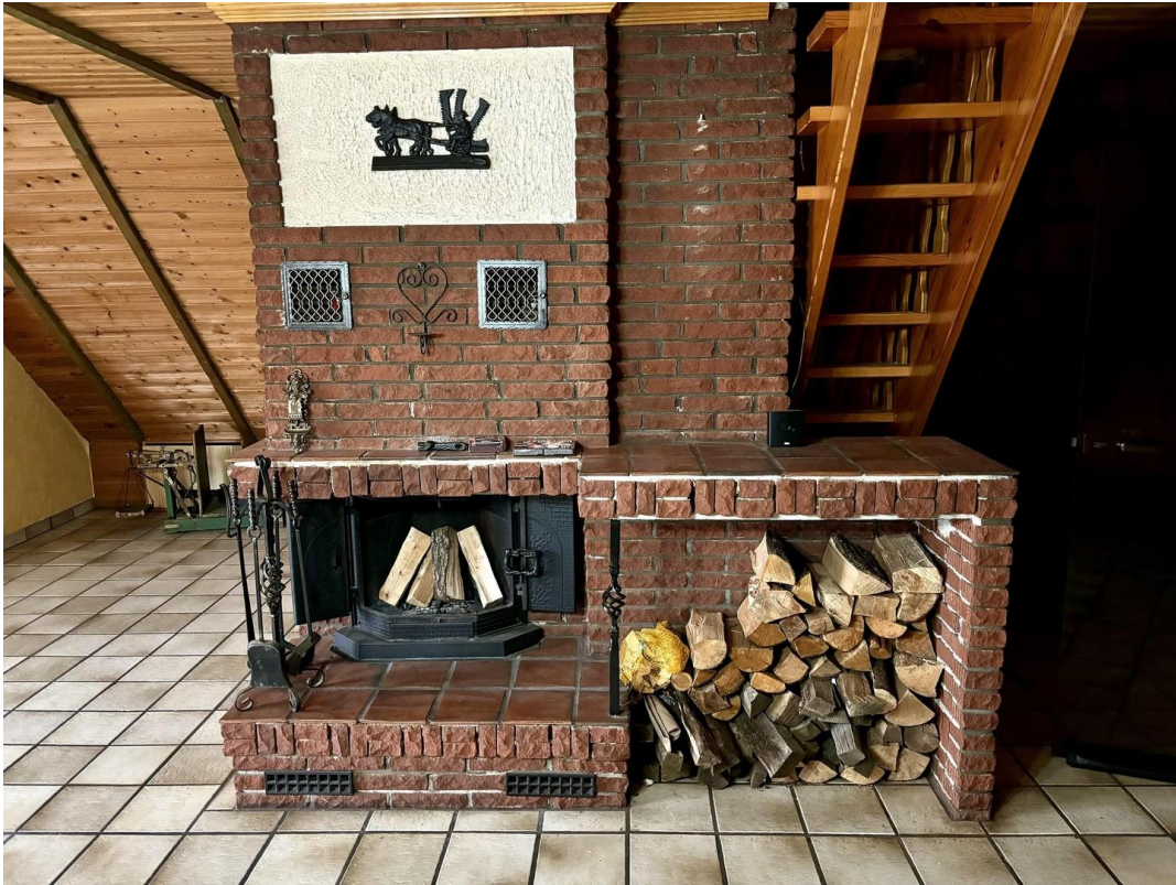
Offener Kamin Stube