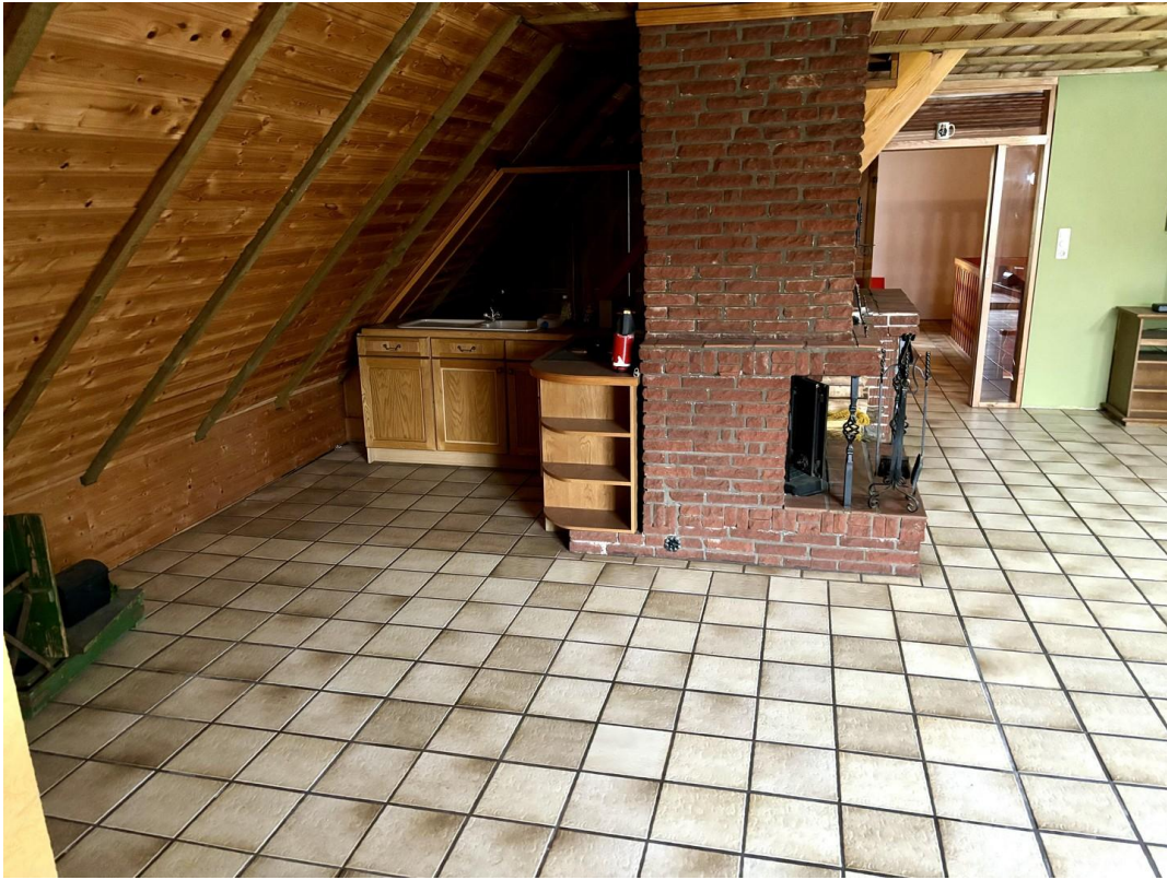
Küche hinter Kamin