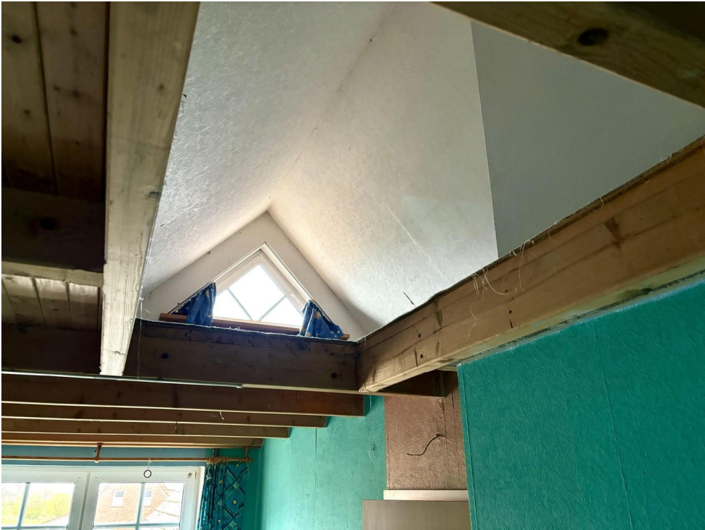
Jugendzimmer über Garage