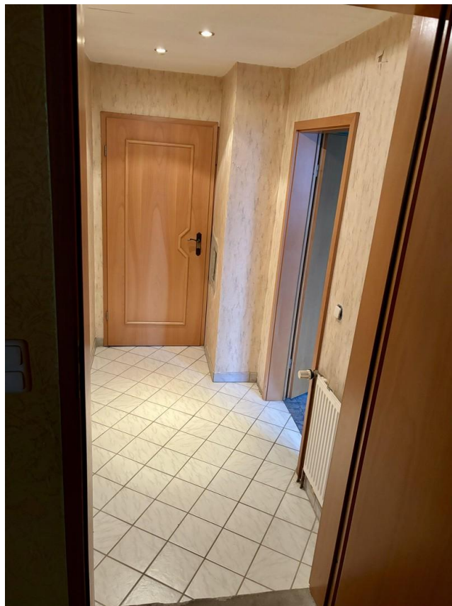
Flur über Garage