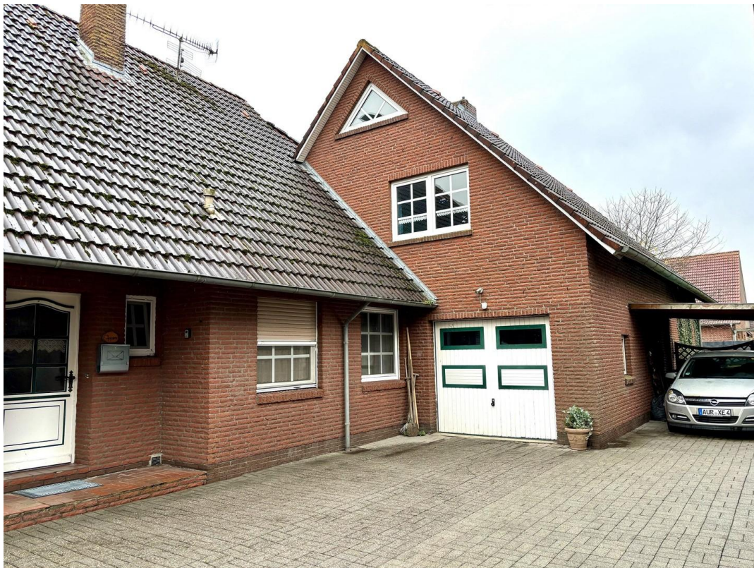
Anbau mit Sep. Wohnung