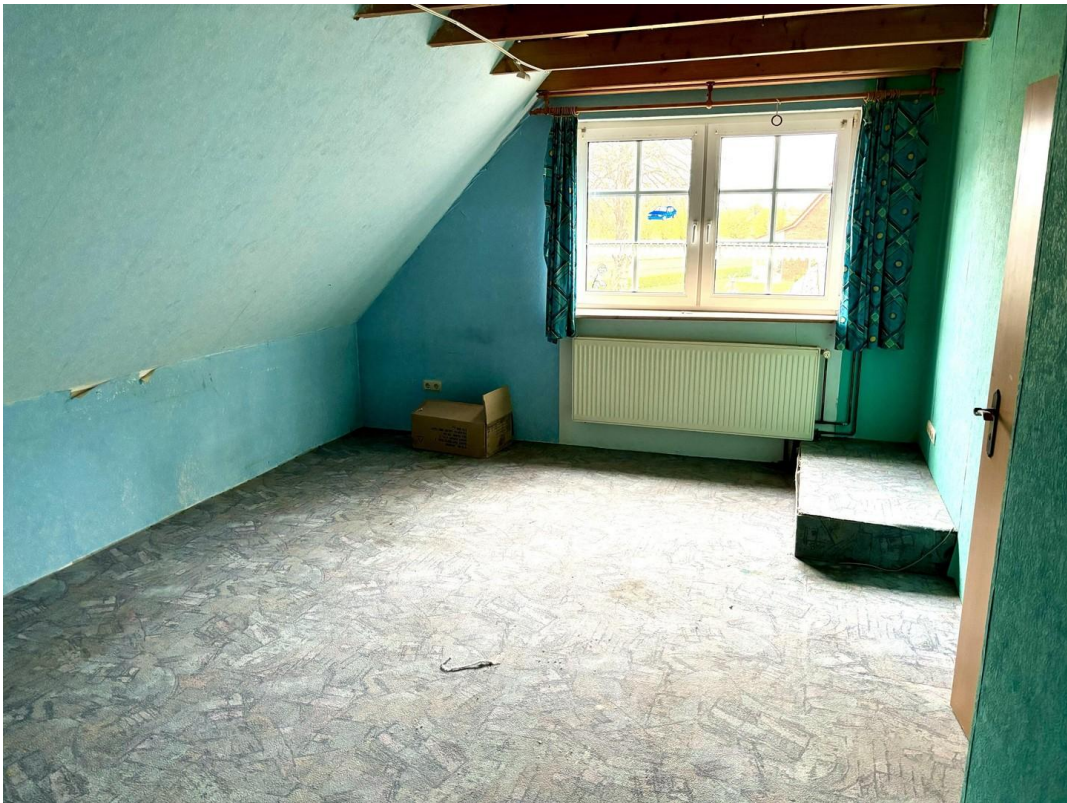
Jugendzimmer über Garage