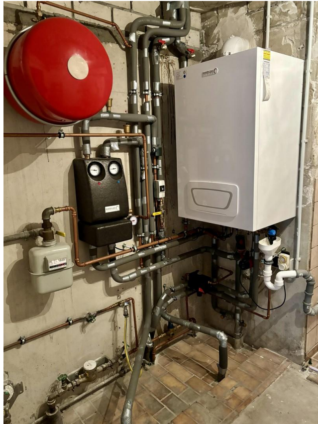
Heizung Bj 2019