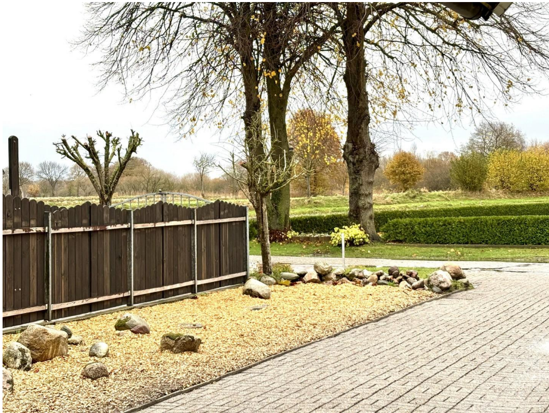
Sicht aus der Haustür