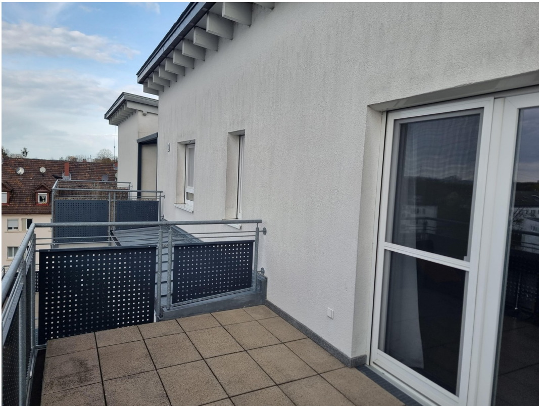
Außenansicht von Kinder/Schlaf