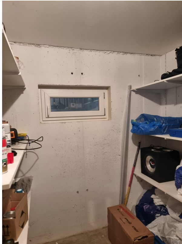
Keller mit Fenster