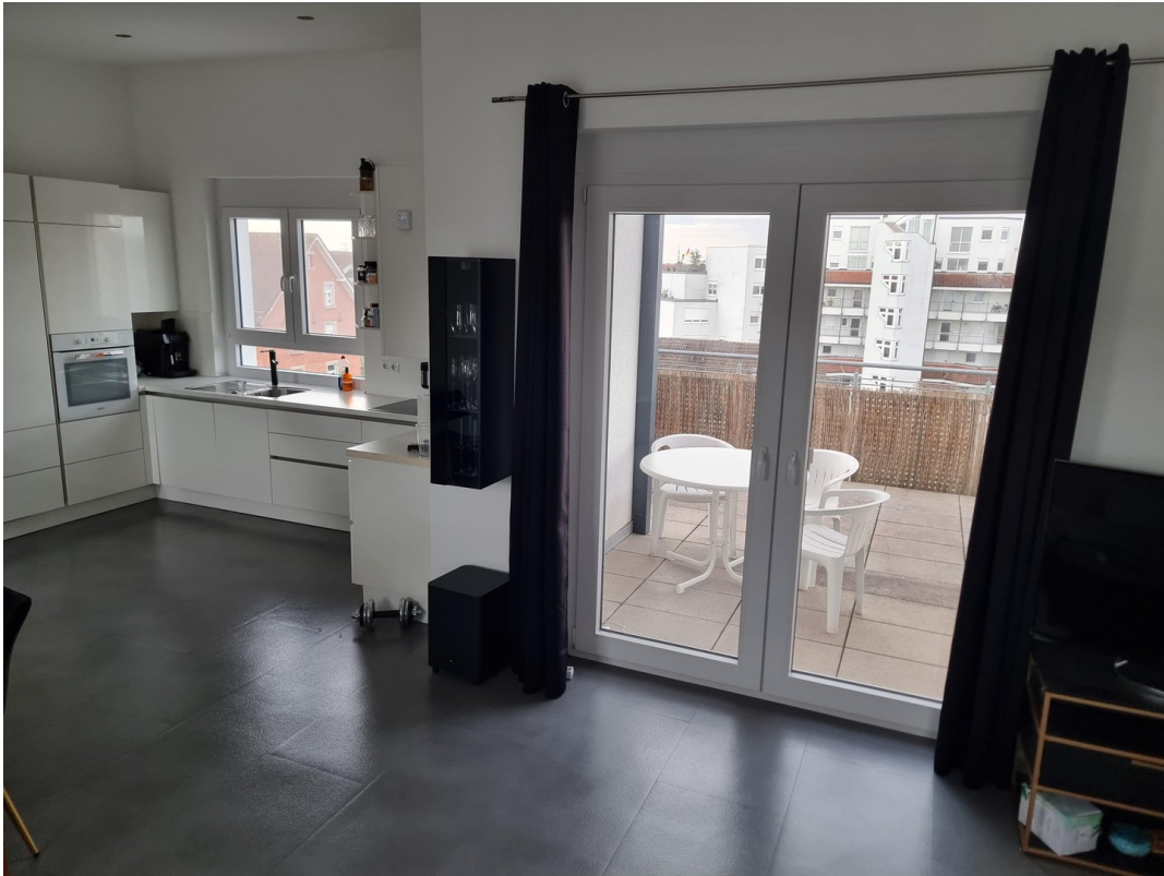
Wohnzimmer und Küche