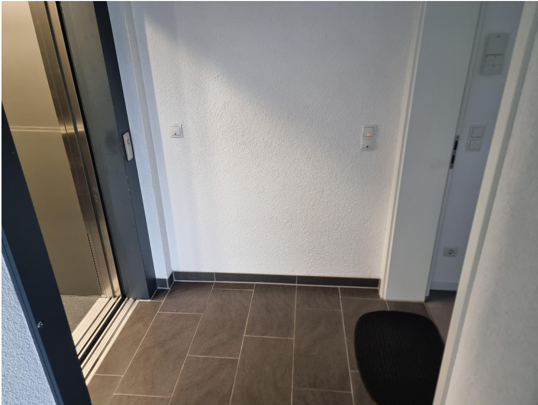
Aufzug und Haustür