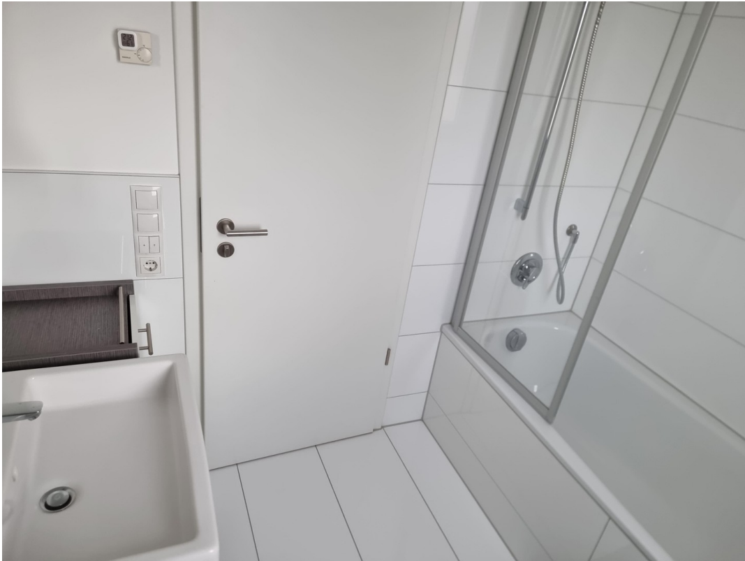
Gäste Badezimmer mit Badewanne