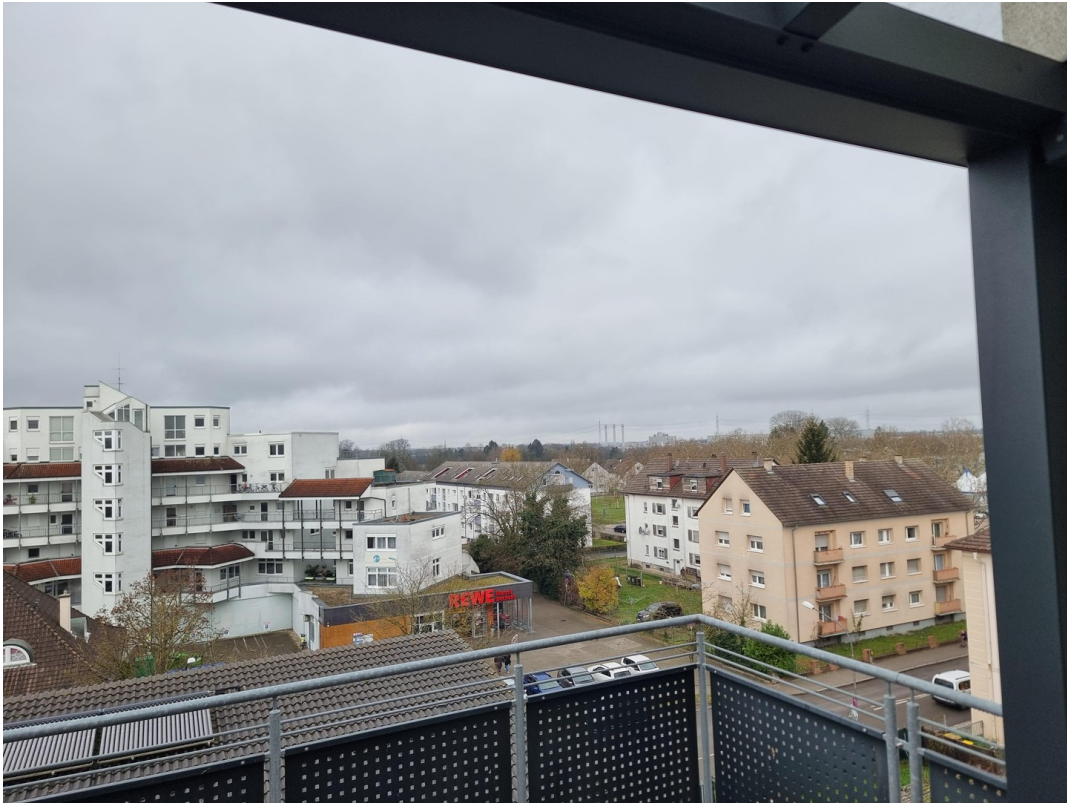
Balkon von Wohnzimmer