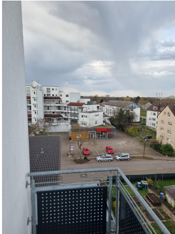
Balkon Ausblick zum Rewe