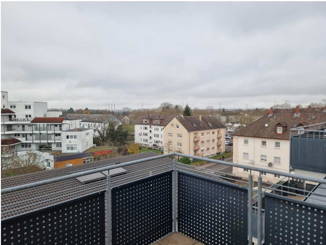
Balkon von Schlaf/Kinderzimmer