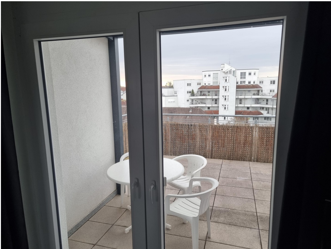
Balkon von Wohnzimmer