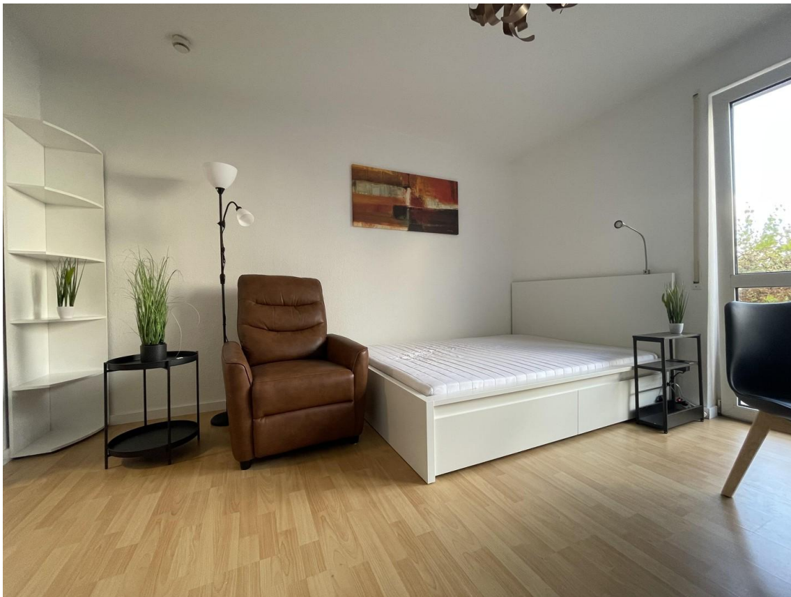
Bett / TV-Sessel