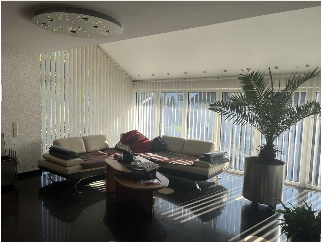
Wohnzimmer - Wintergarten