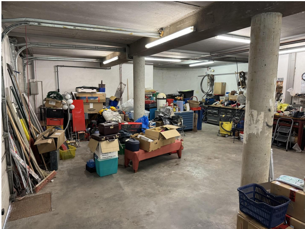
Garage 105 qm