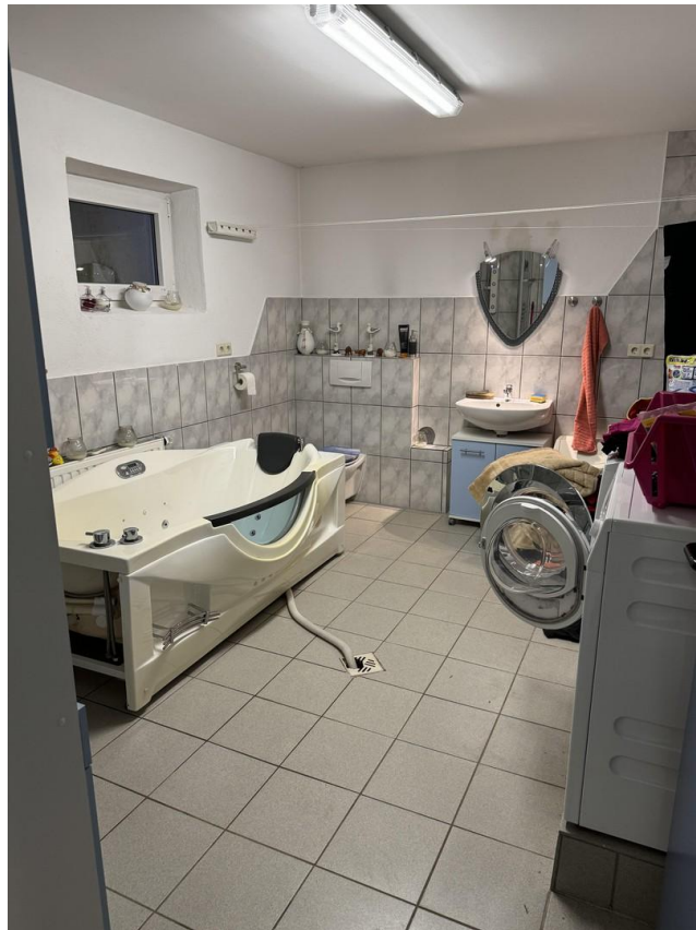
Waschküche im EG