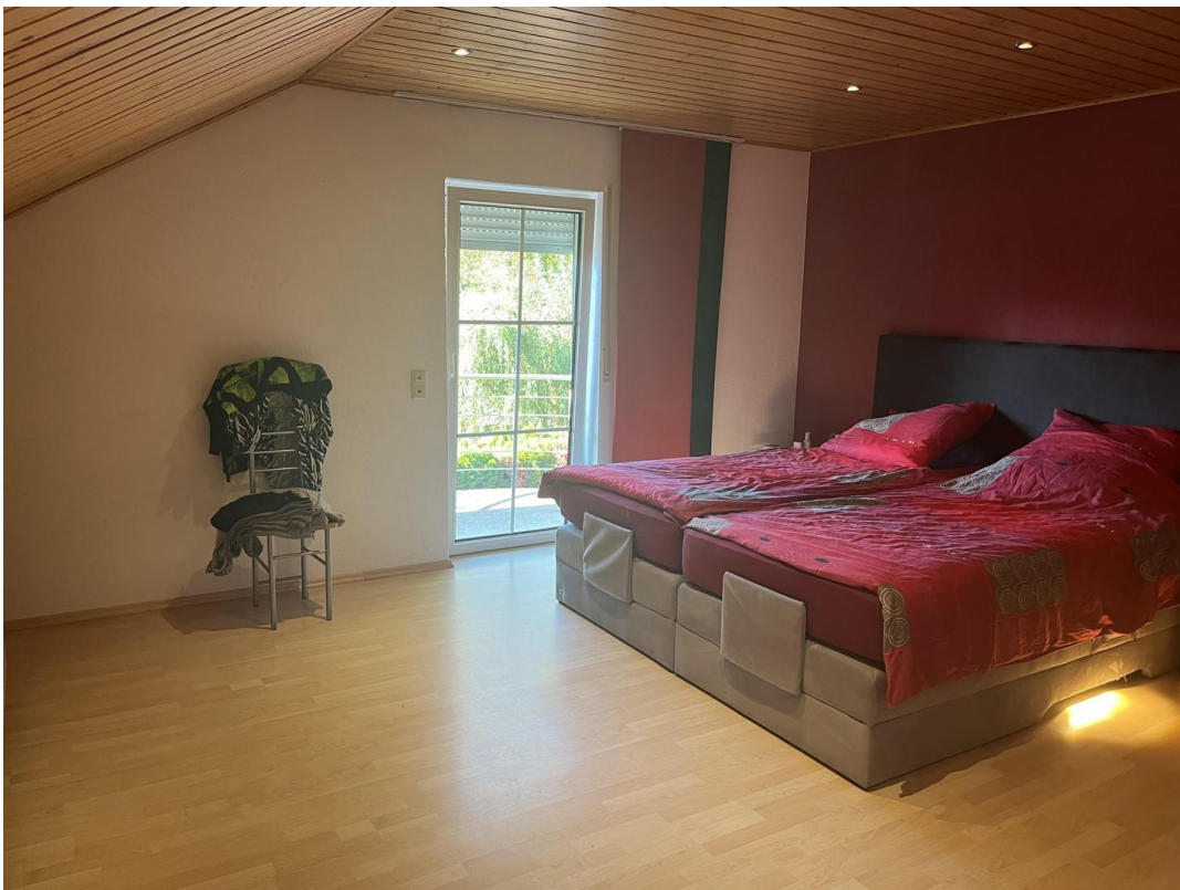
Schlafzimmer mit Balkon