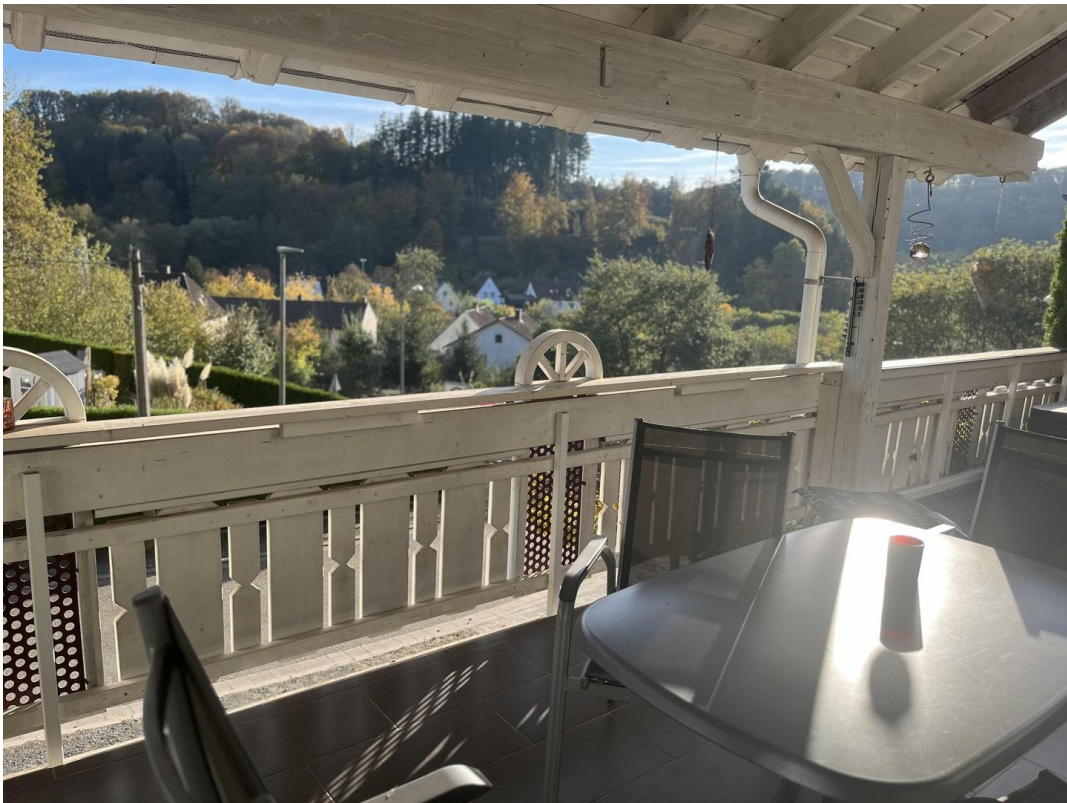
Terrasse mit Weitblick