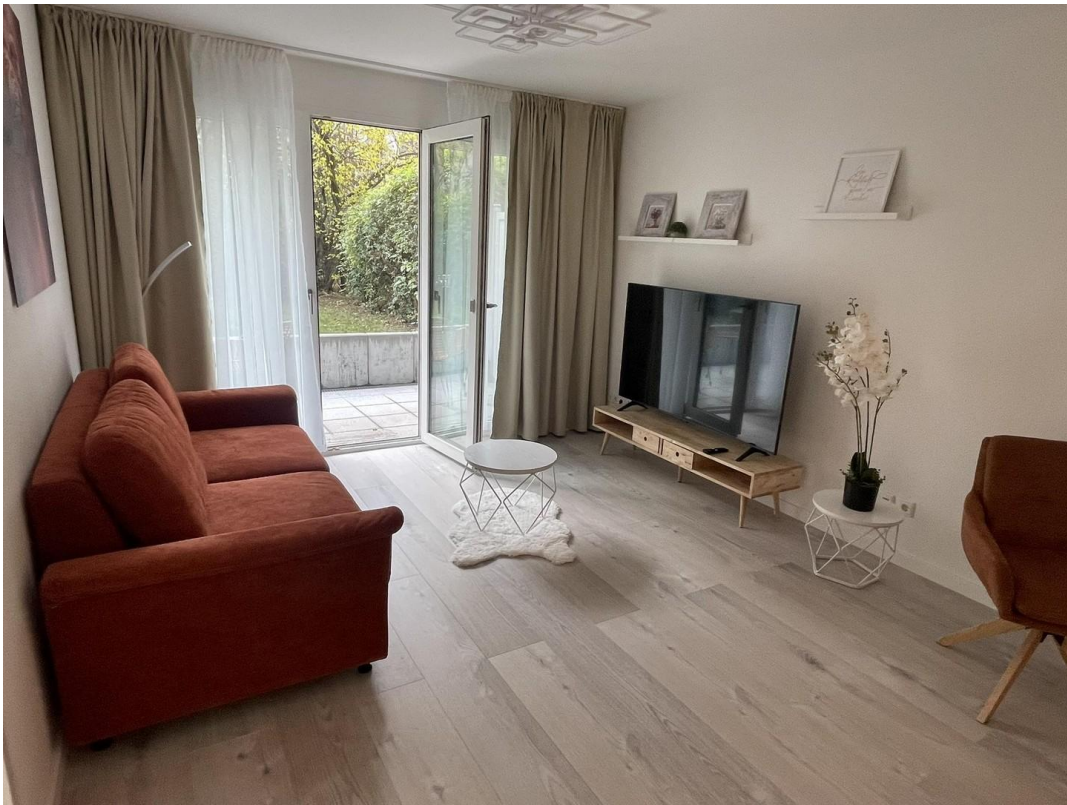
Wohnzimmer / Küche