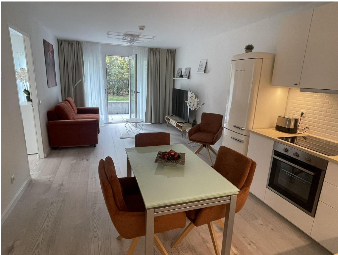
Wohnzimmer / Küche