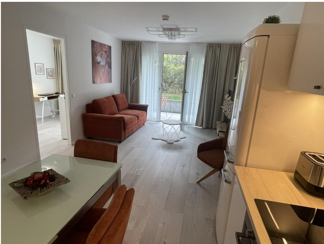
Wohnzimmer / Küche