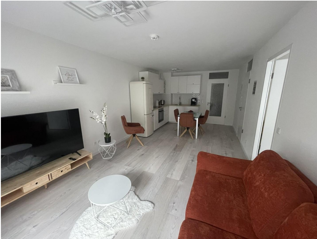
Wohnzimmer / Küche