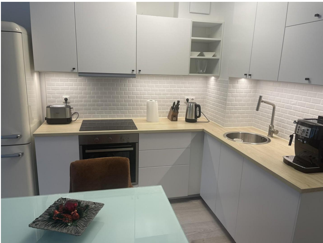
Wohnzimmer / Küche