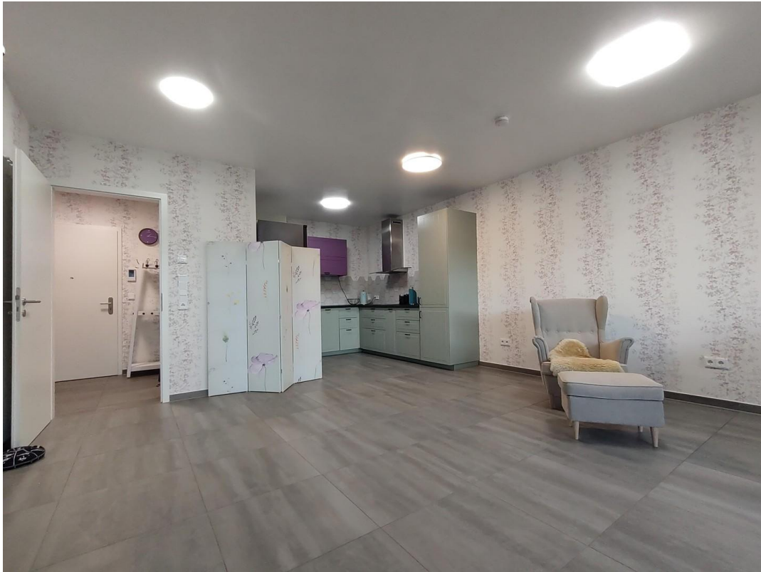
Wohnzimmer mit Küchenbereich