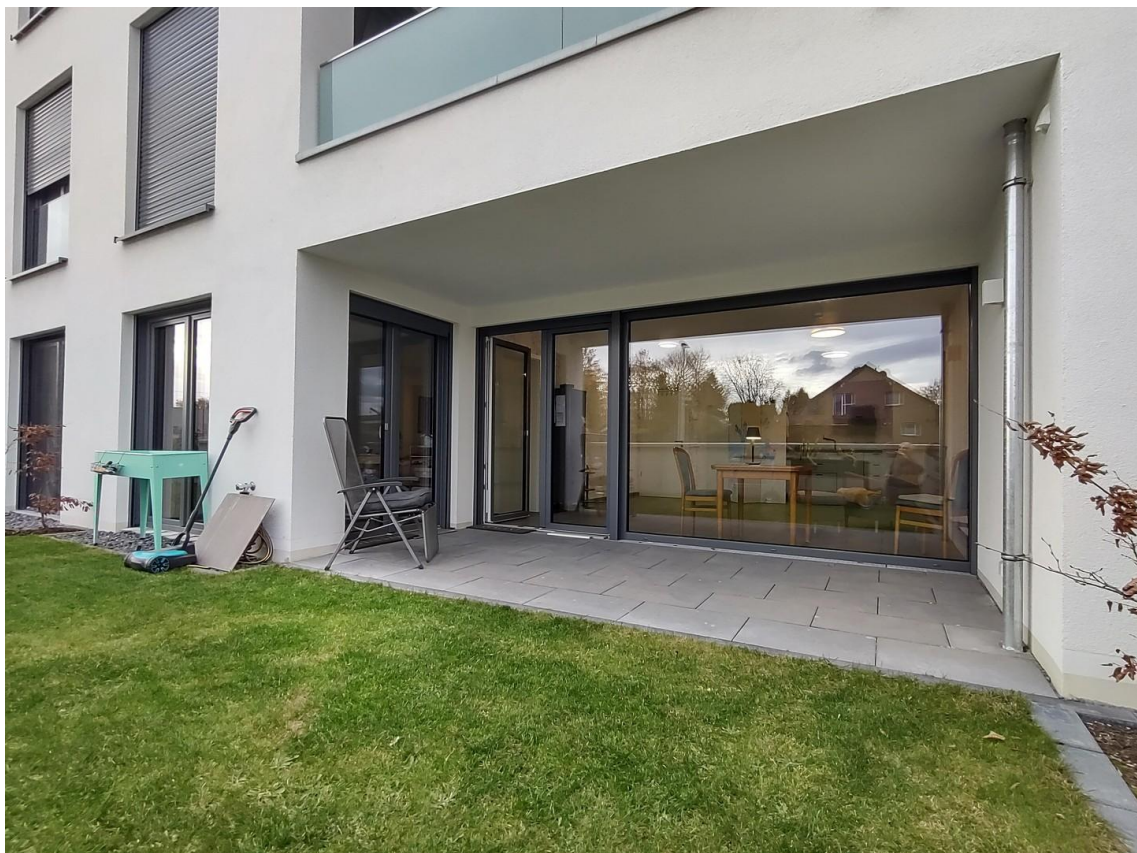
Loggia mit Gartenanteil