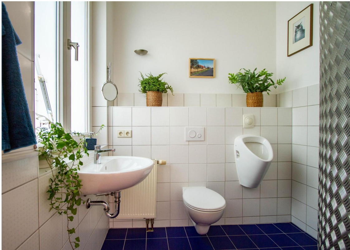
Gäste - WC (EG)