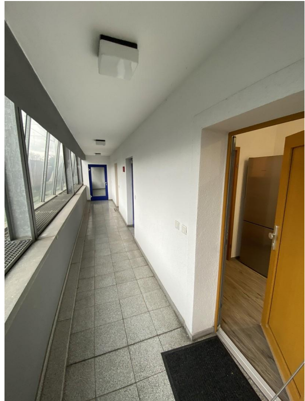
Laubengang - Eingang Wohnung