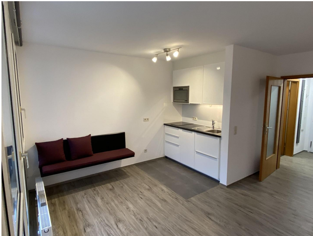
Küche mit Sitzbank