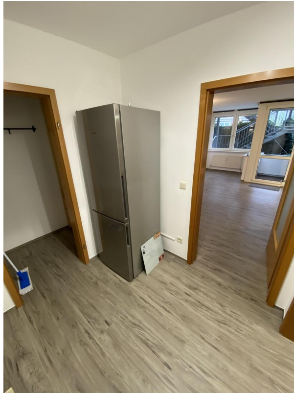
Flur mit Kühlschrank