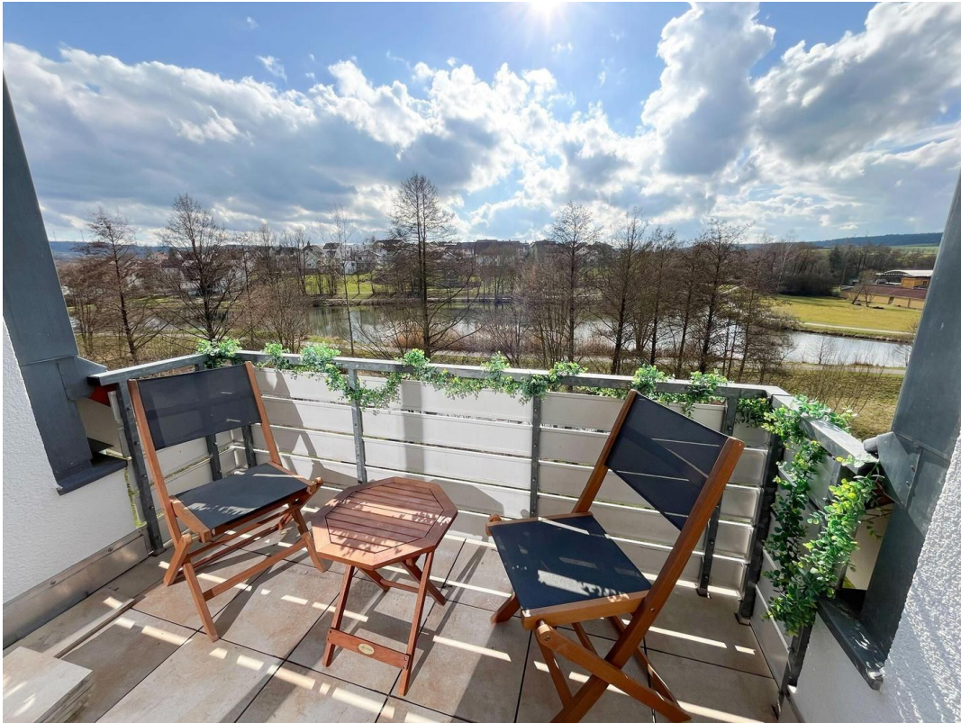
Balkon mit Seeblick