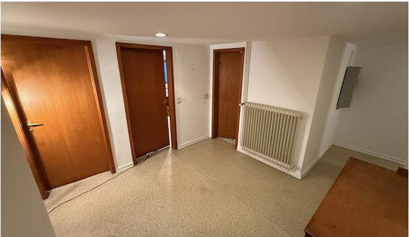
offener Flurbereich Souterrain