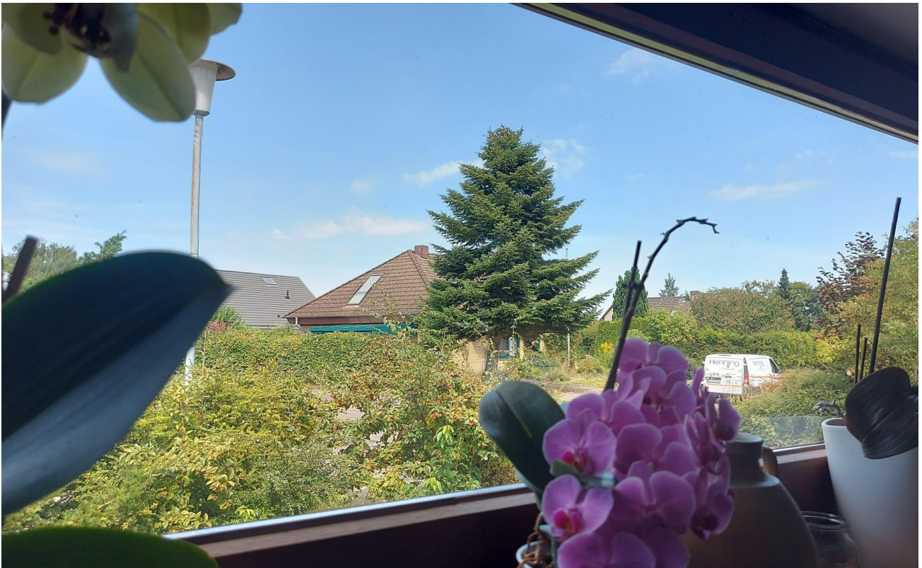
Blick zur Straßenseite