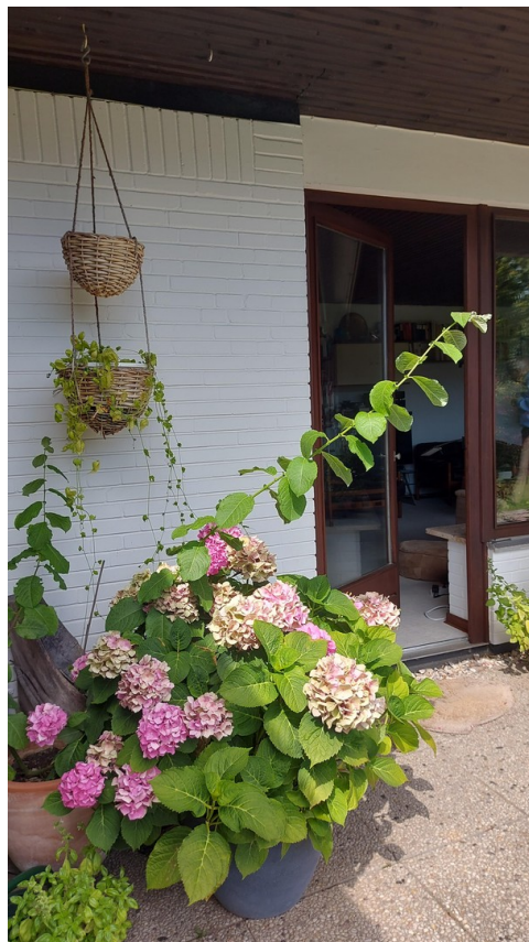
Terrassentür zum Wohnzimmer