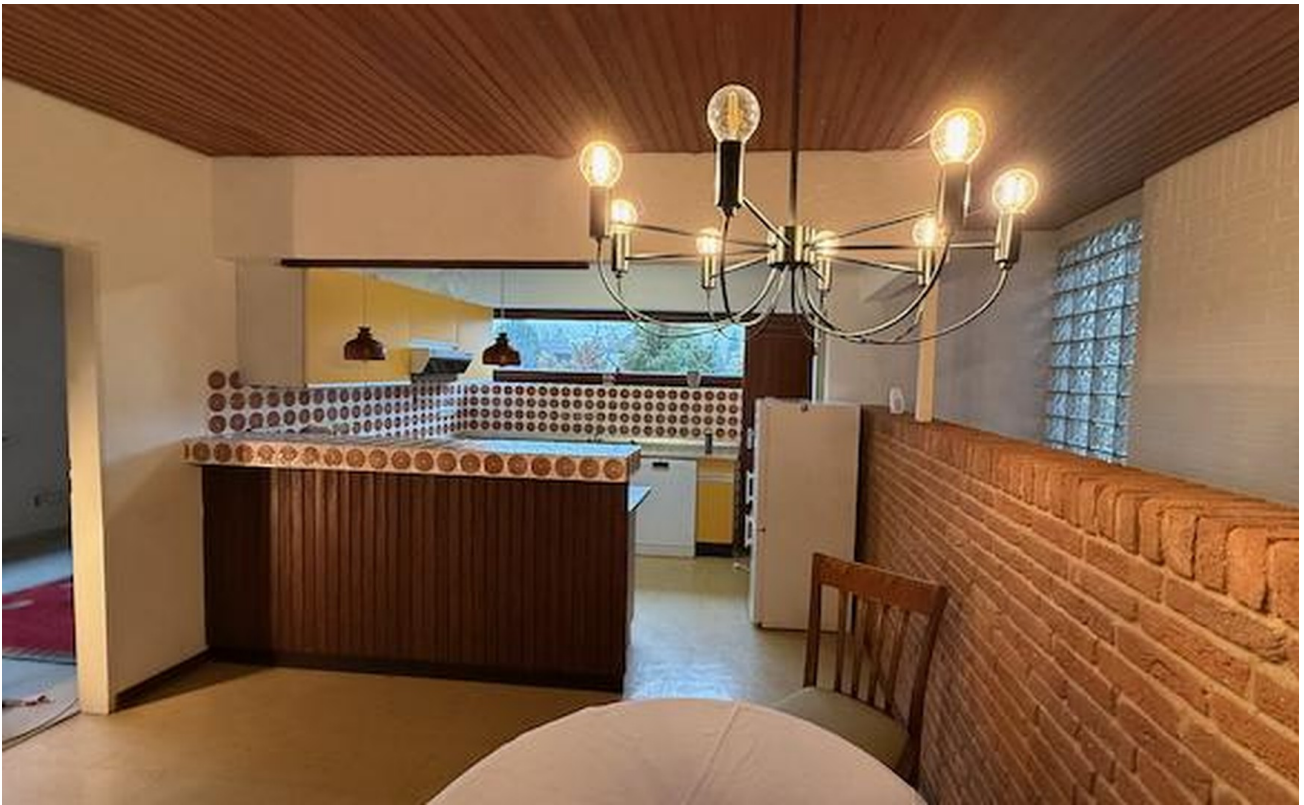
Wohnküche mit Gartenblick