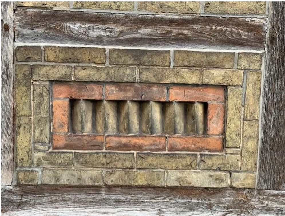
Detail zur Fassade