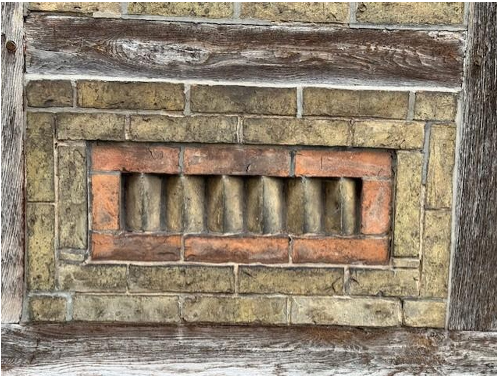
Detail zur Fassade