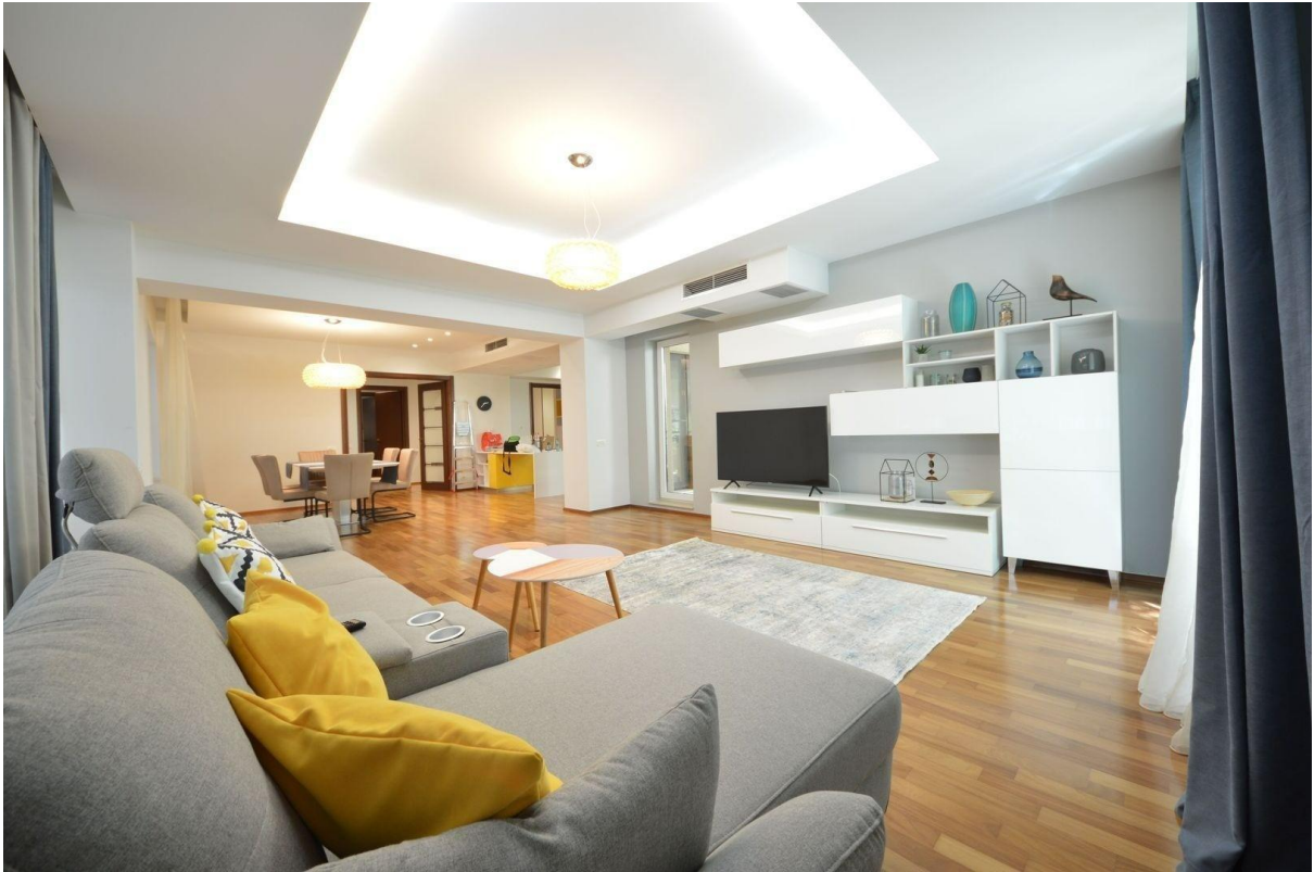
Sofa und TV