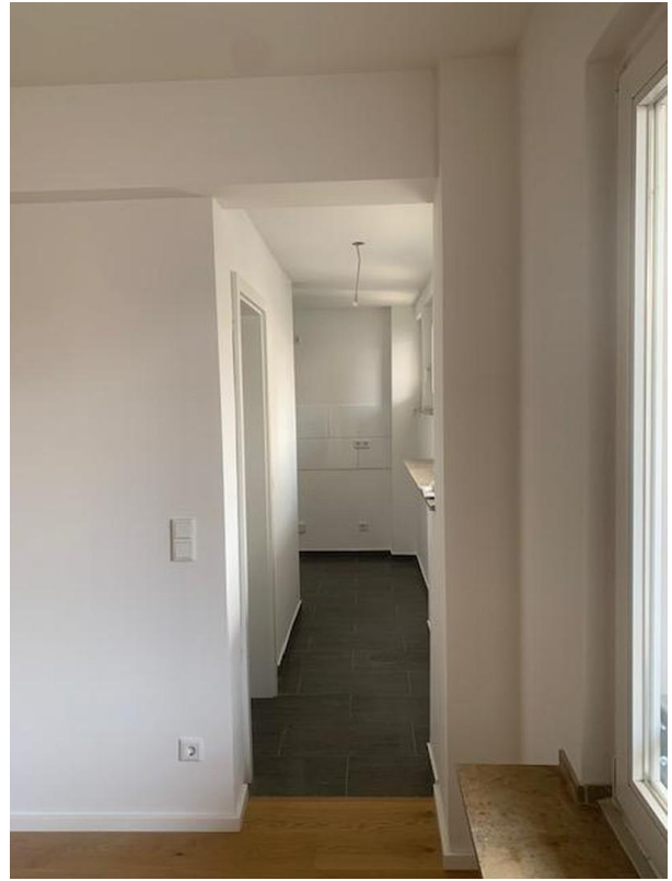
Flur zur Küche