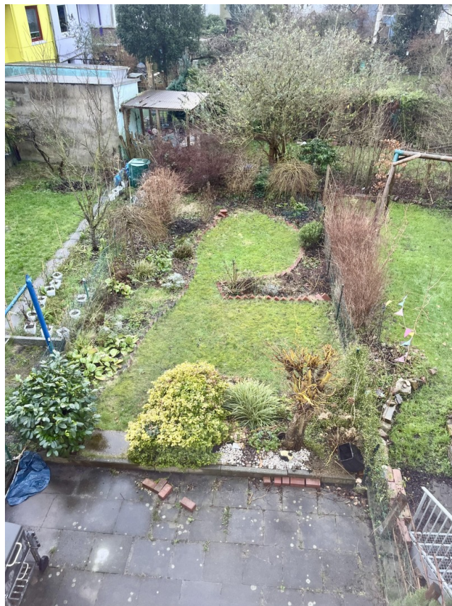
Garten des Hauses