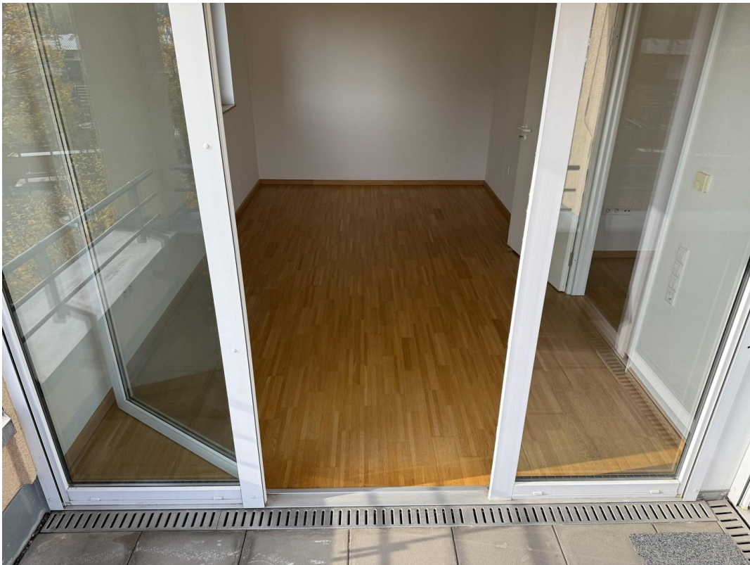
Schlafzimmer 1 (2)