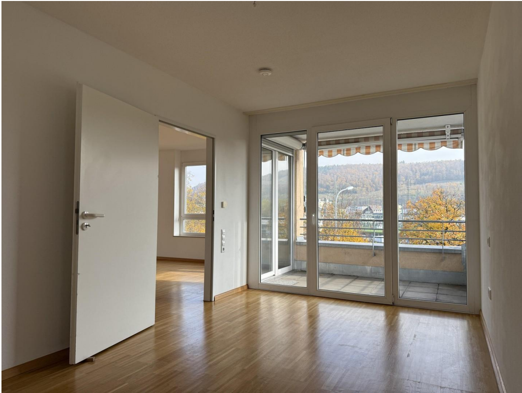
Schlafzimmer 1 (1)