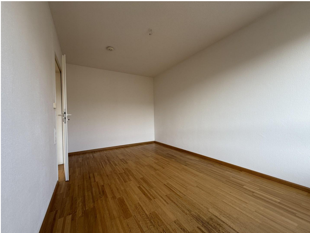
Schlafzimmer 2 (2)