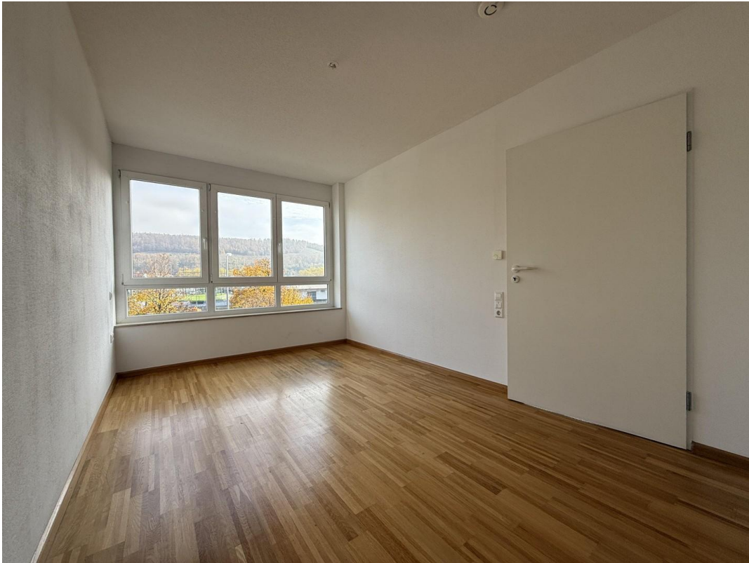
Schlafzimmer 2 (1)