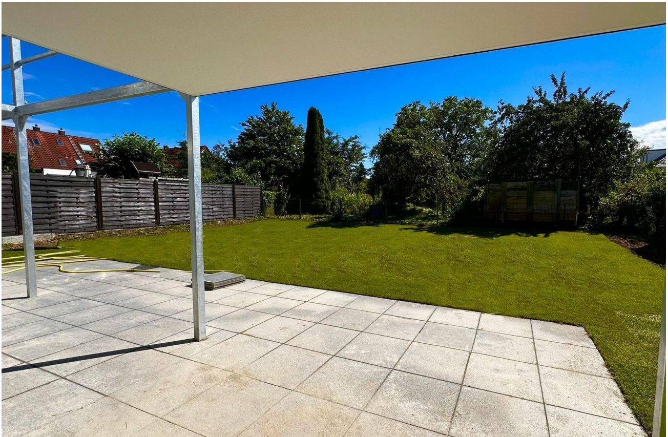
Blick in den Privatgarten