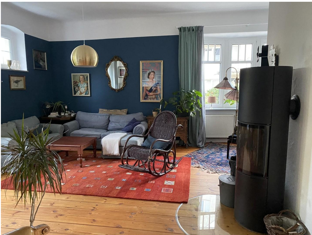
Wohnzimmer mit Ofen_EG