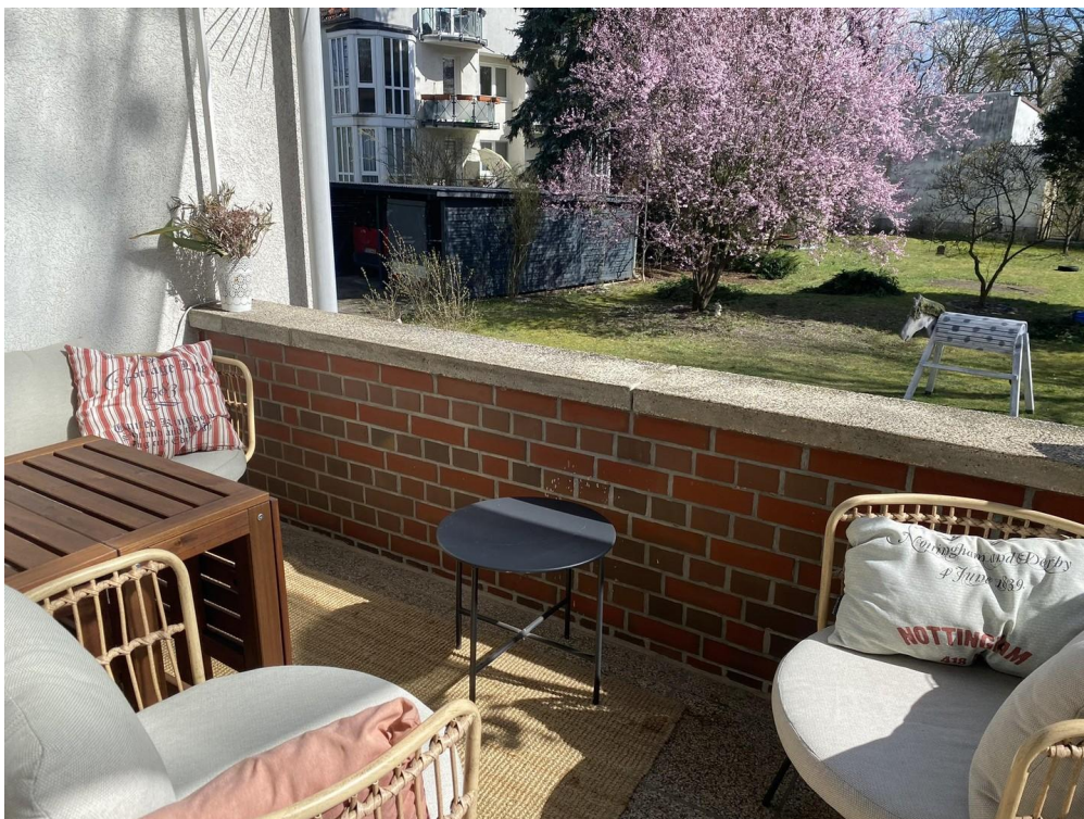
Terrasse und Garten