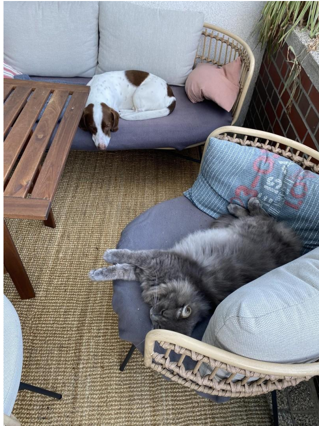
Terrasse zum Entspannen