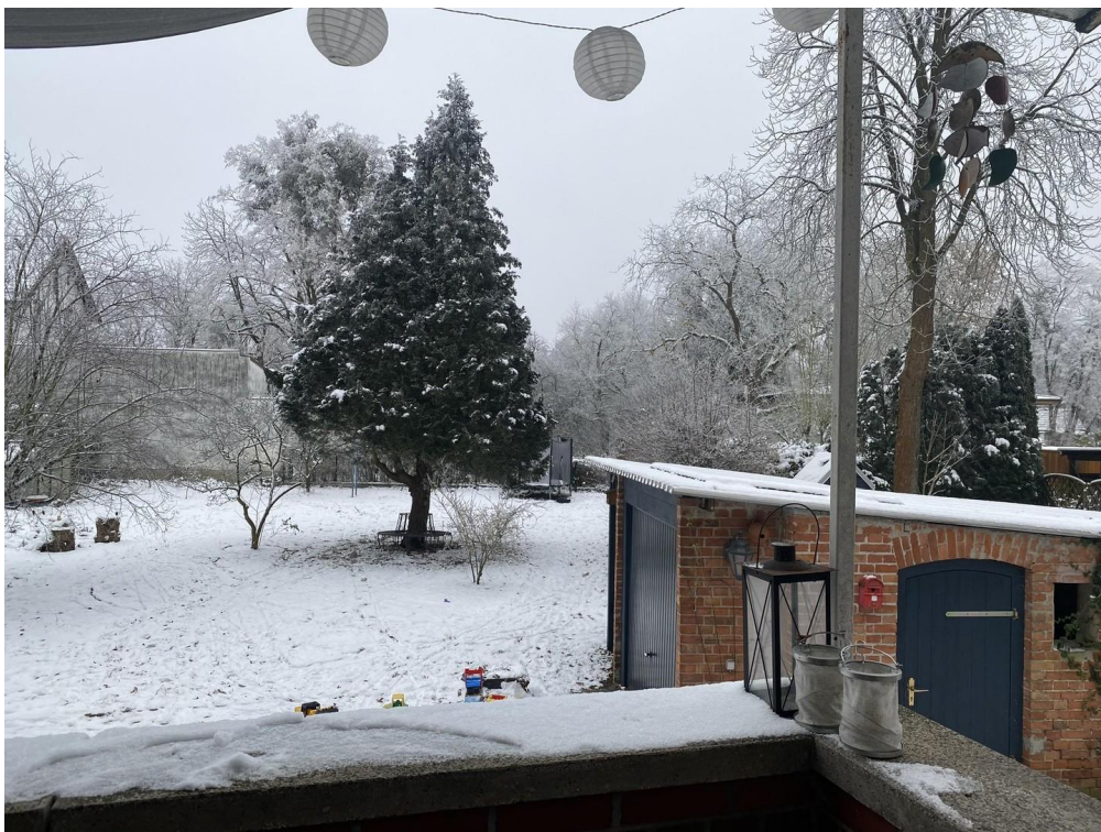
Terrassenblick im Winter