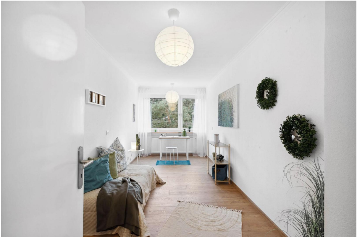
Kinderzimmer / Büro