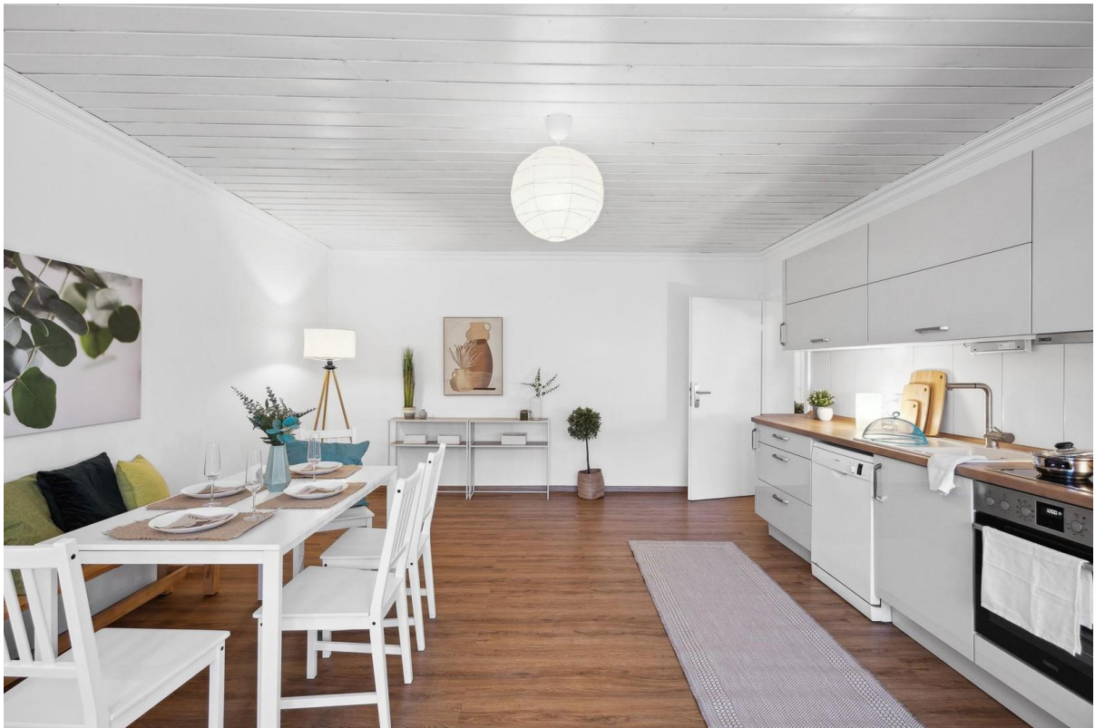
Küche, Wohn-, Essbereich