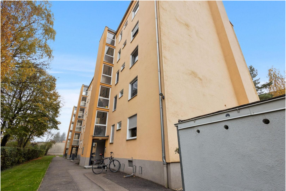
sehr gepflegte Wohnanlage