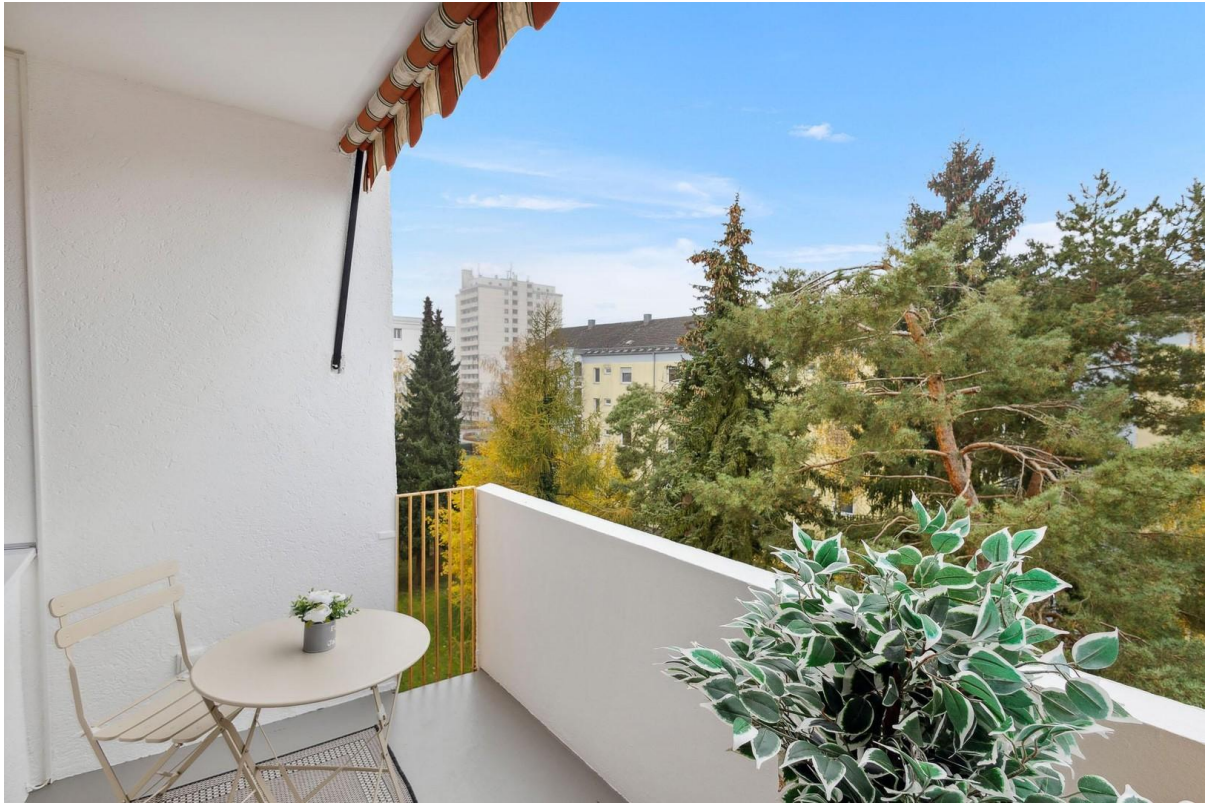
Sued - Balkon