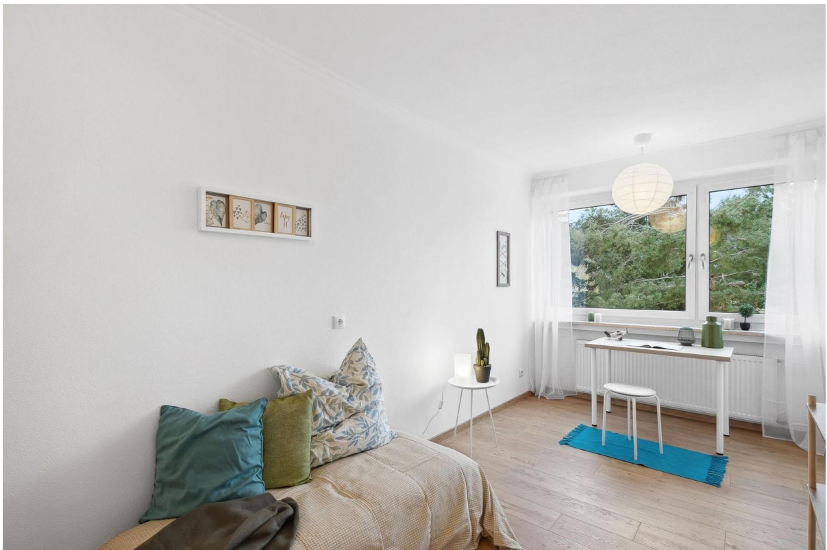
Kinderzimmer / Büro