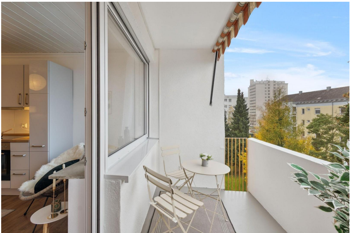
Sued - Balkon