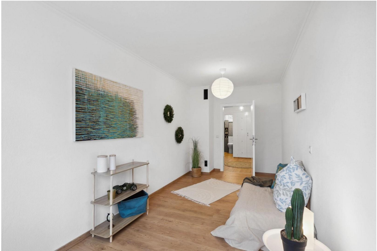
Kinderzimmer / Büro