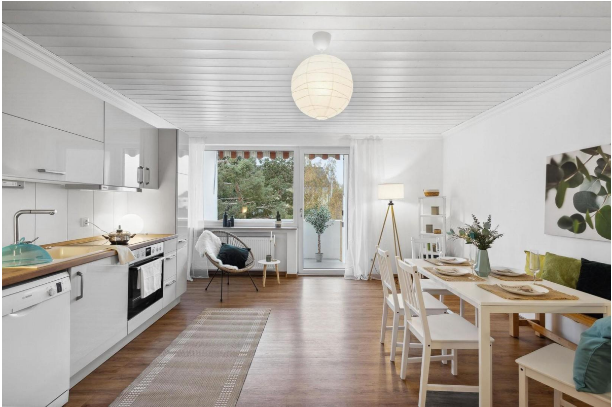
Küche, Wohn-, Essbereich