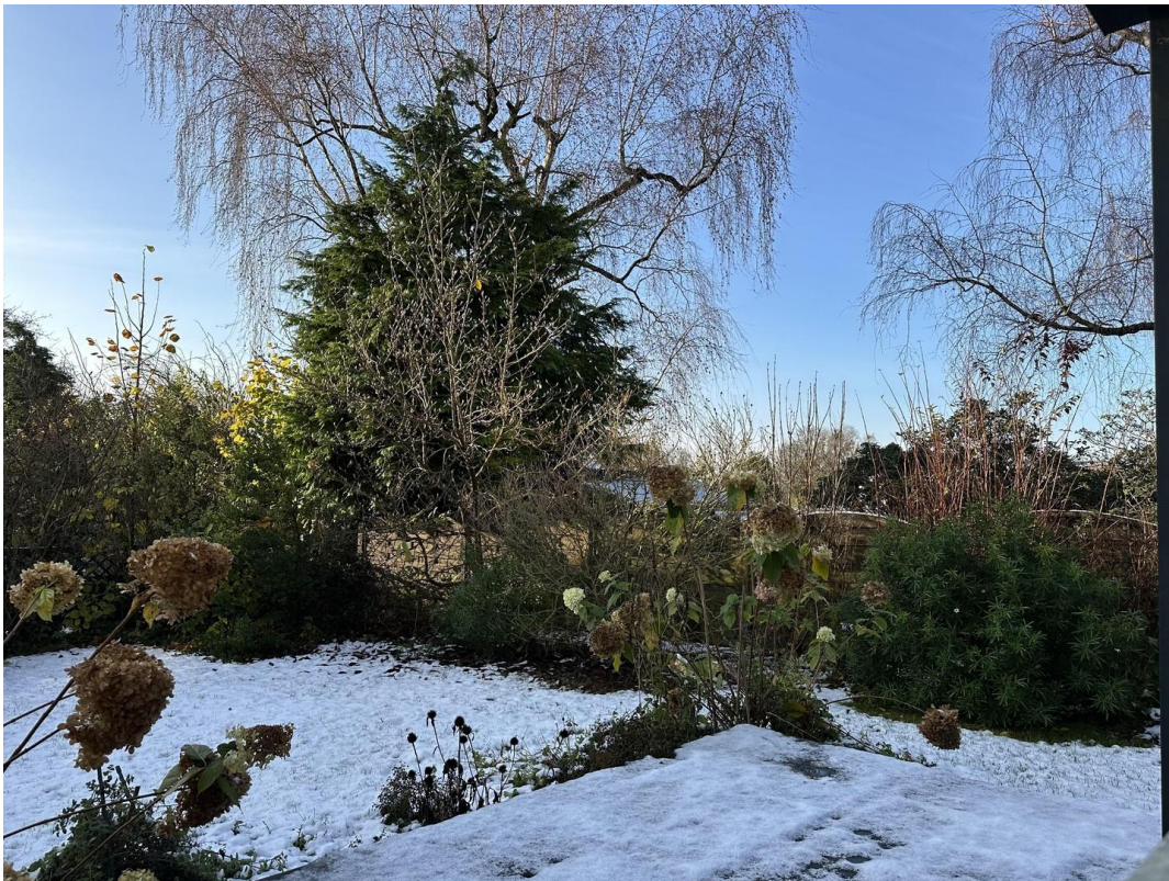
Blick in den Garten