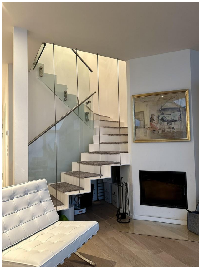
Treppe und Kamin