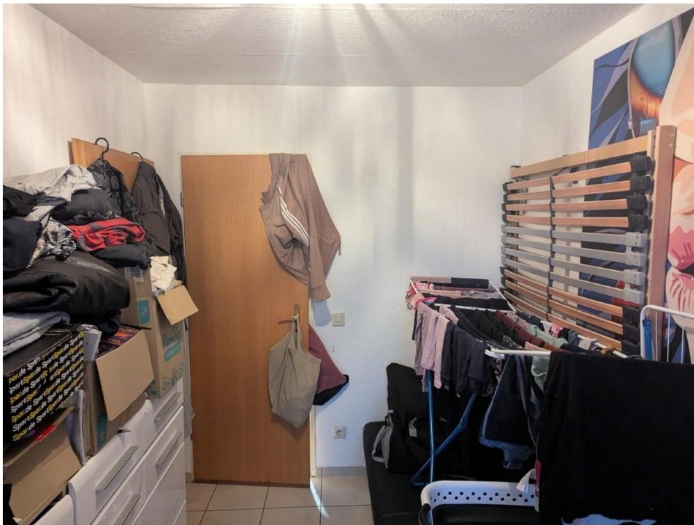
Durchgang zum Balkon