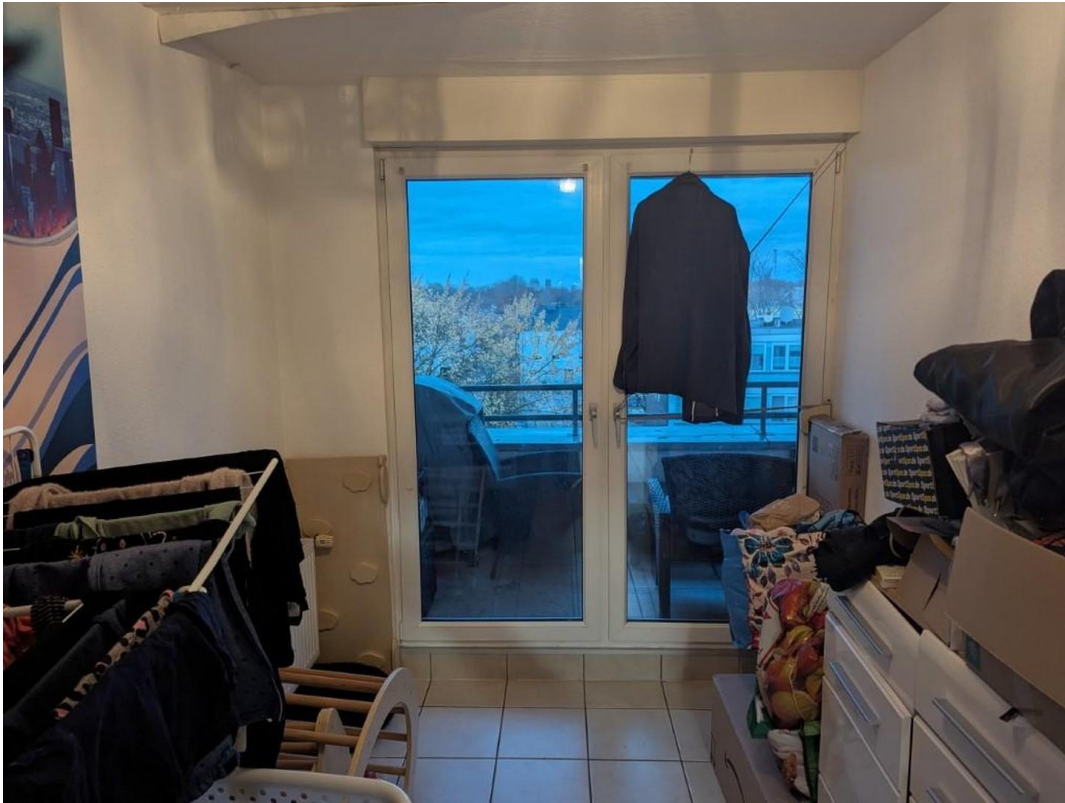
Durchgang zum Balkon