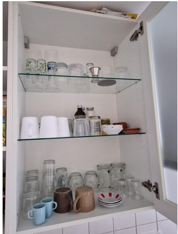
Küche / Details