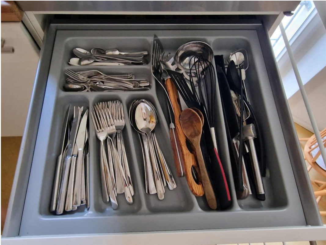
Küche / Details