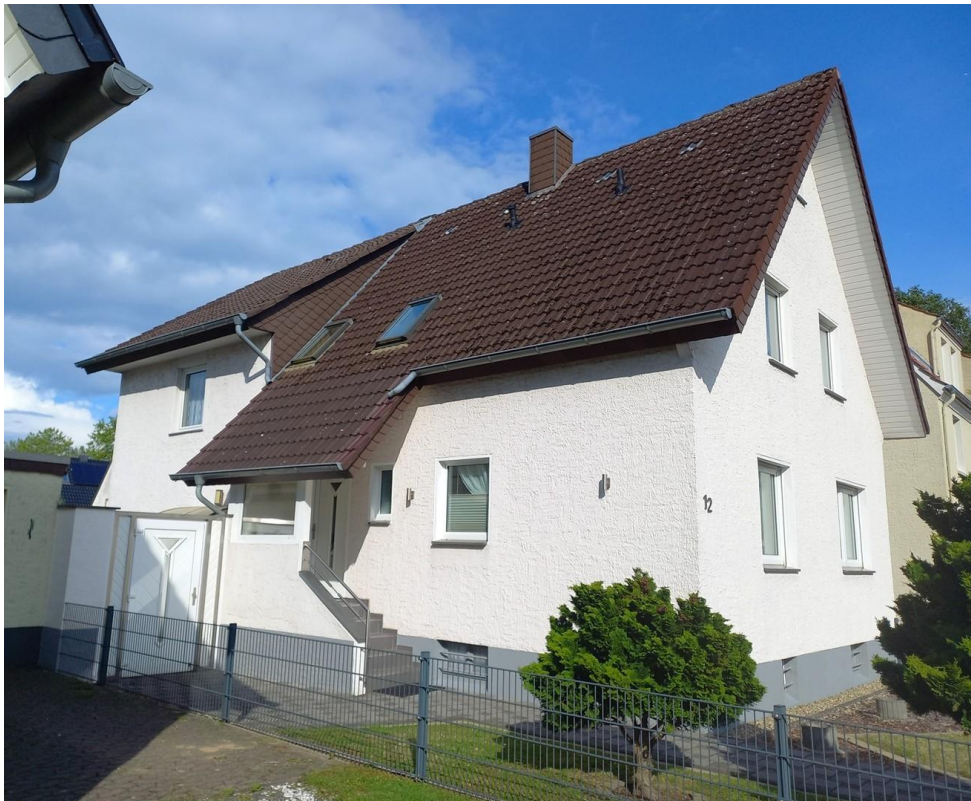
Hausansicht von links