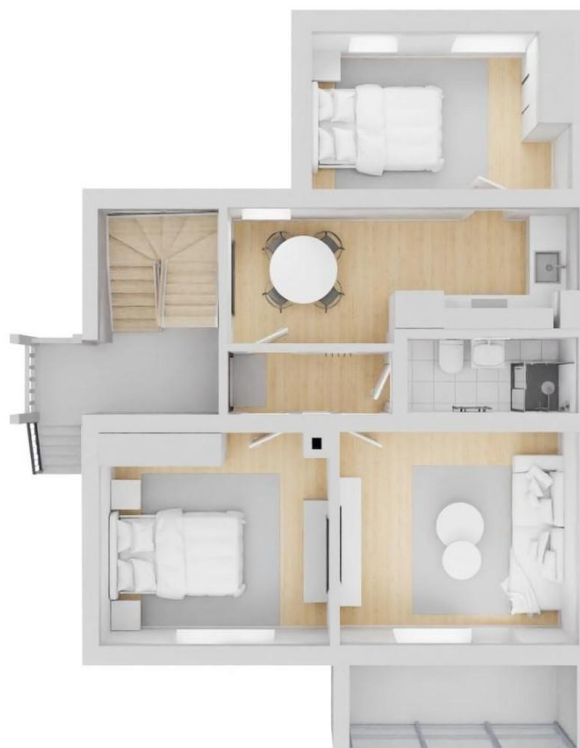
Erdgeschoss und Obergeschoss