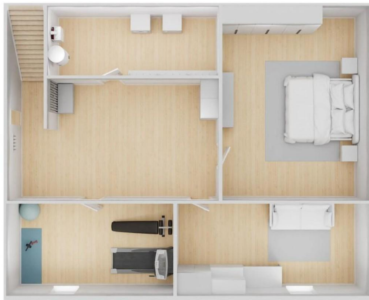
Untergeschoss / Keller