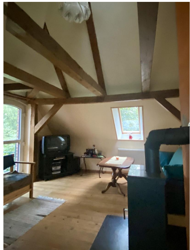
Dachgeschoss mit Kamin