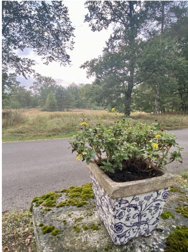
Gegenüber dem Haus