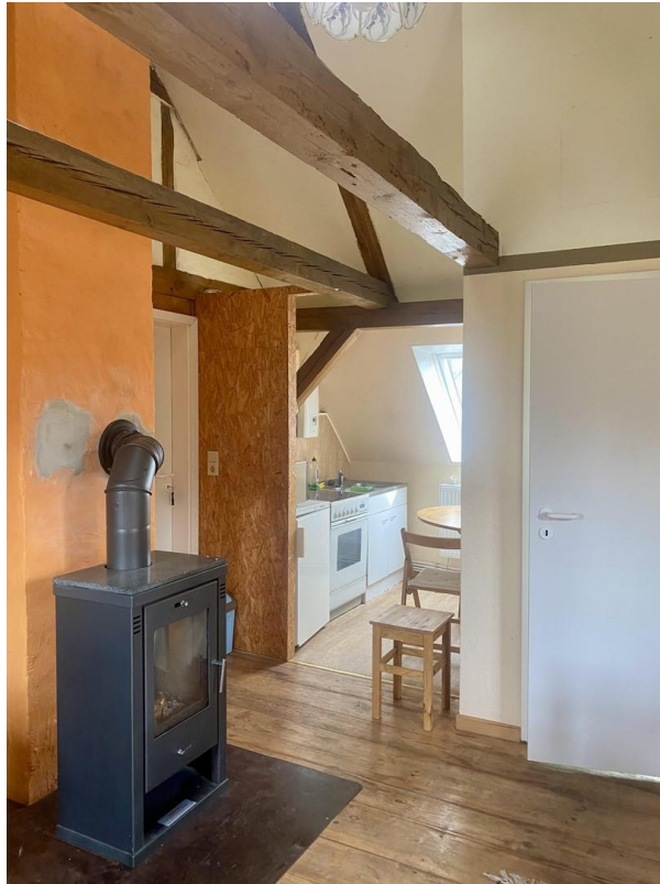
Dachgeschoss mit Kamin