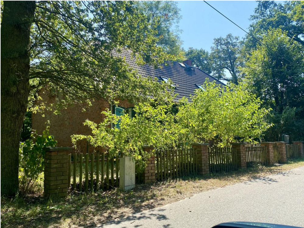
Ansicht von vorn