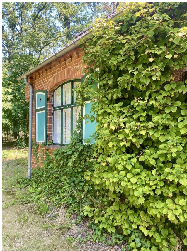
Ansicht von vorn