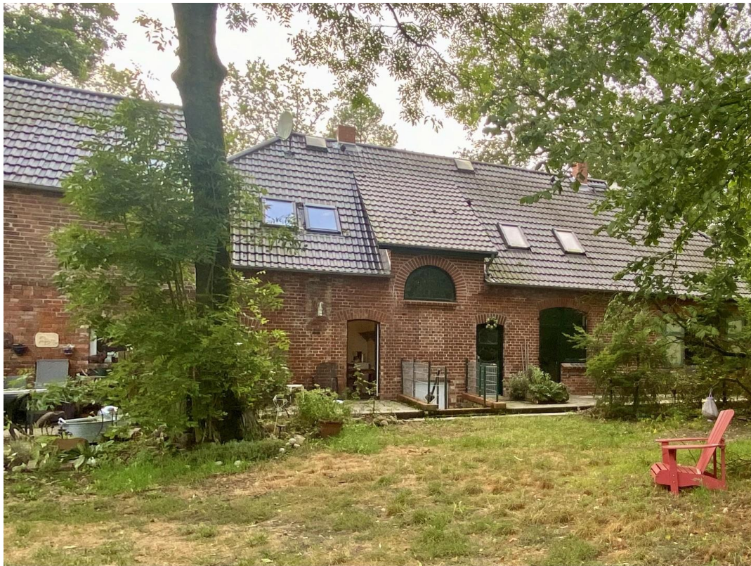
Ansicht vom Garten gesehen