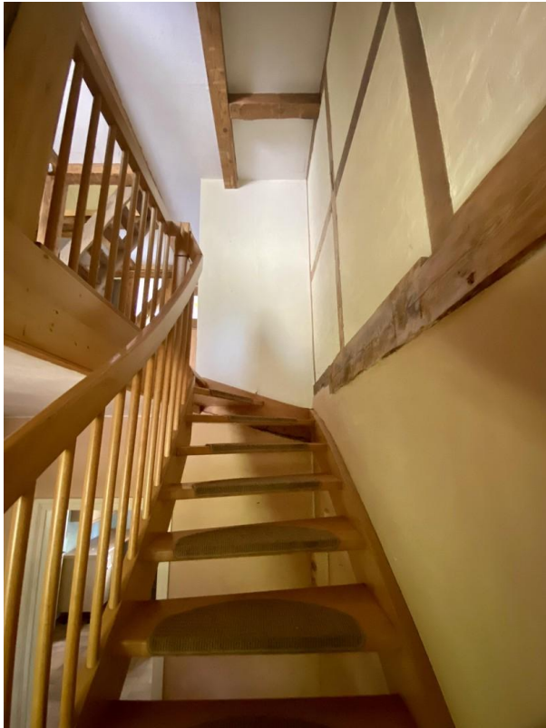
Treppe zur 2. Etage