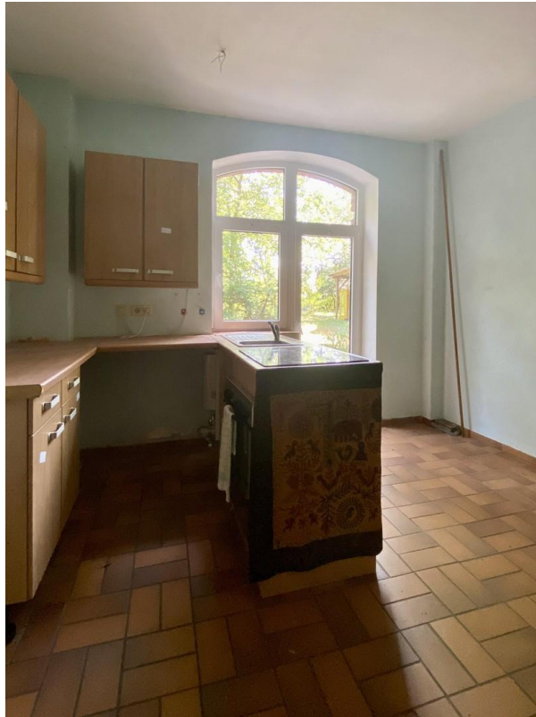
Große Küche mit Terrasse