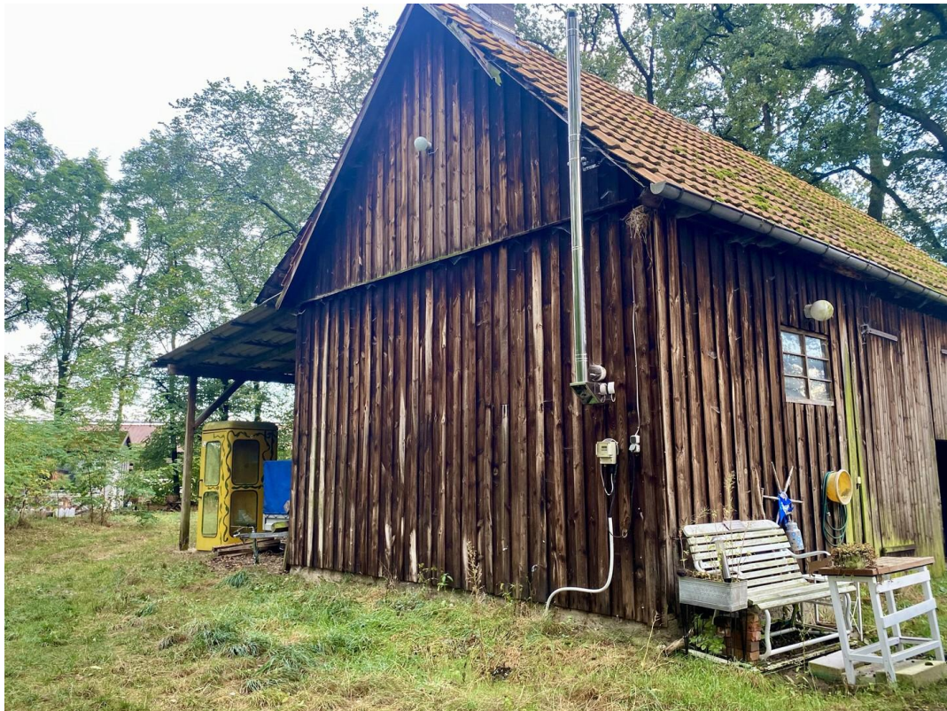
Scheune mit Carport, Heizung