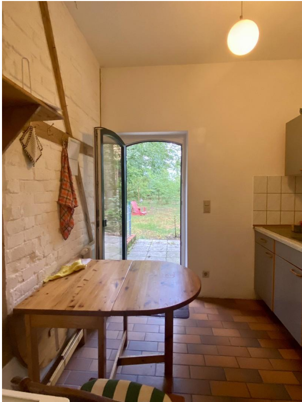
Kleine Küche mit Terrasse