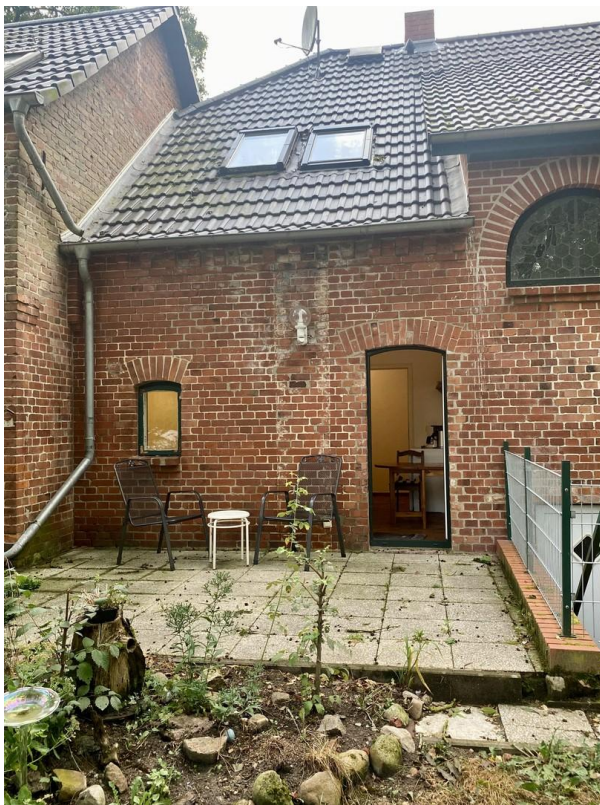
Terrasse vom Garten gesehen