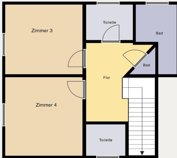
Ferienwohnung 3, 2 Zimmer, zum Garten