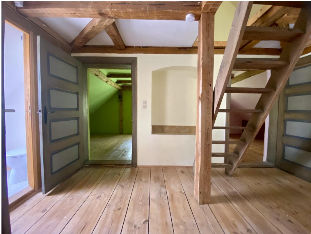
Flur, Wohnung mit 4 Zimmern