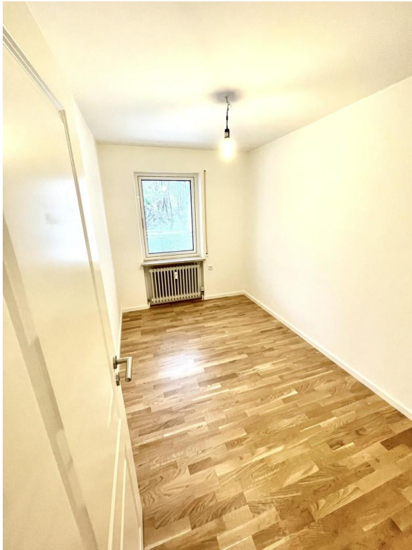
Zimmer 2 Musterwohnung