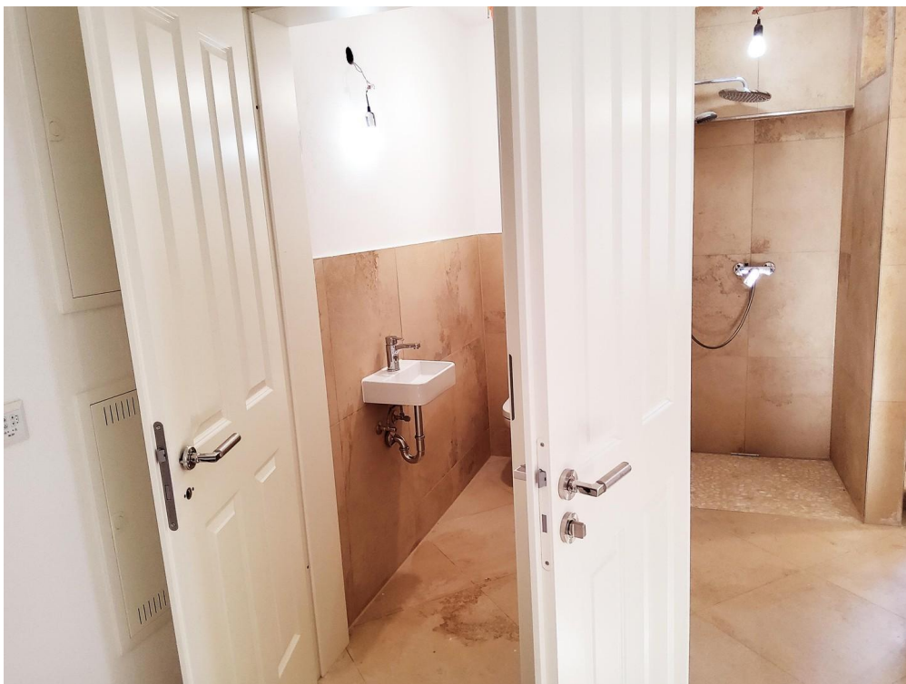
Bad und Gäste WC separat