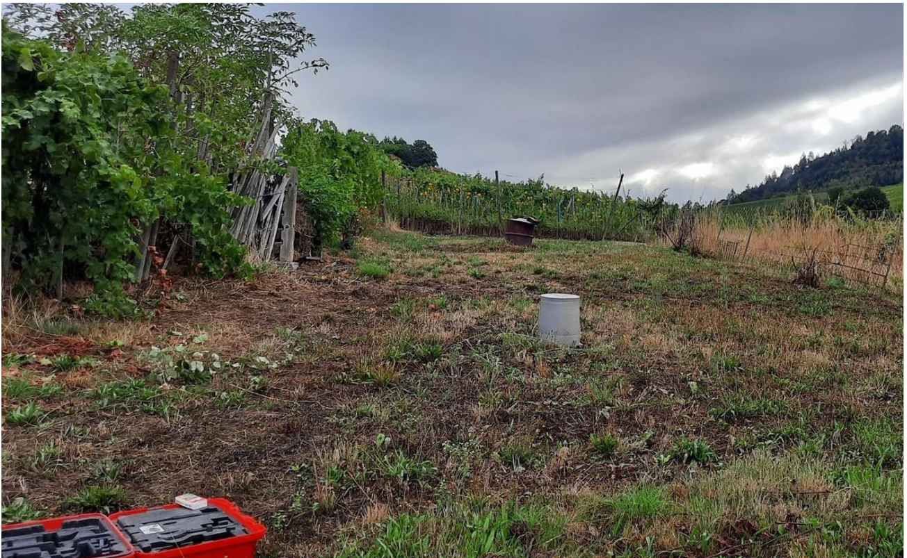
Blick auf Reben und Y-Burg