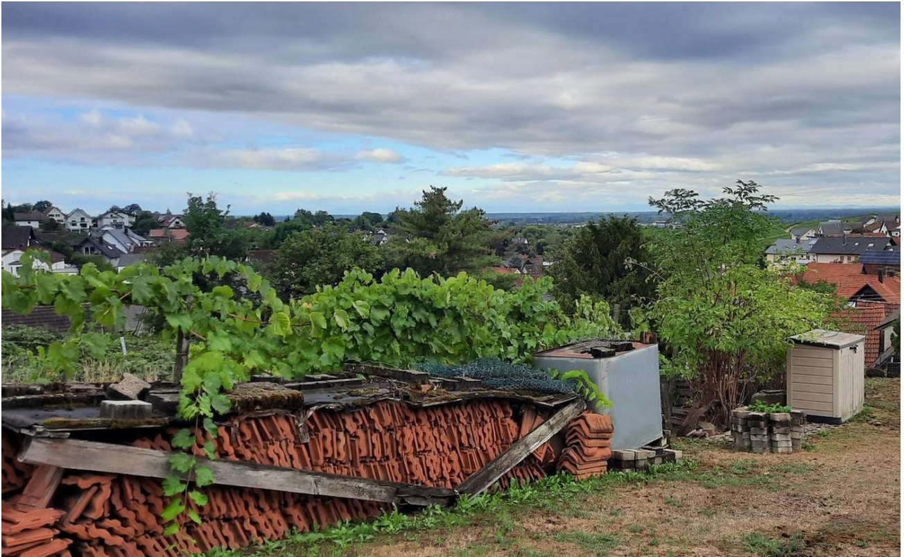
Auf dem Grundstück