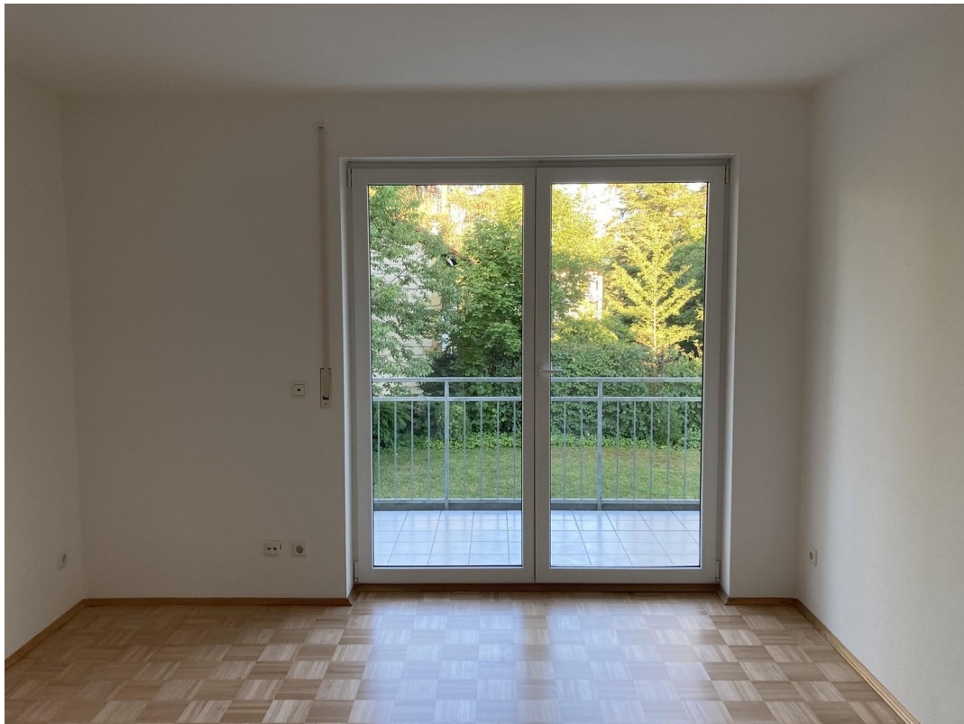
Schlafzimmer mit Balkon