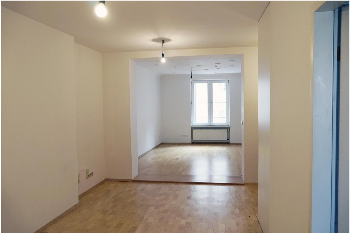
Küche + Wohnzimmer