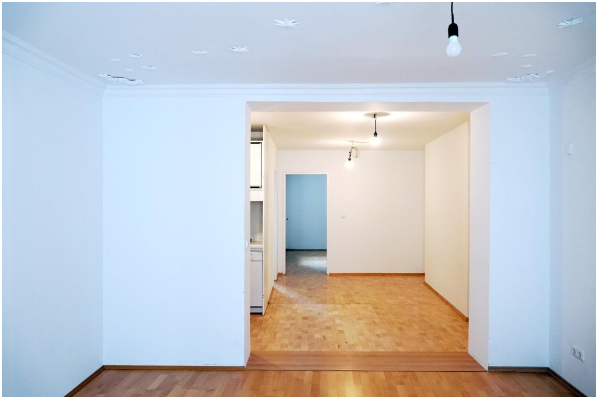
Wohnzimmer + Küche