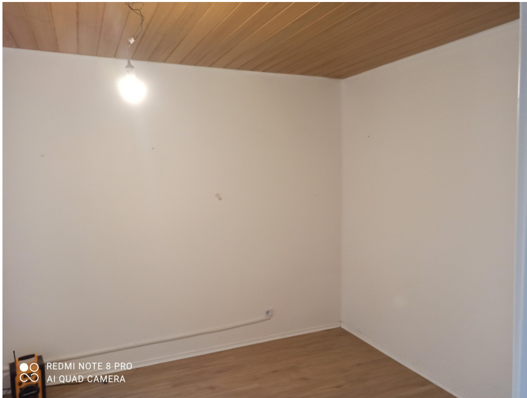
Zimmer OG Wohnung 2