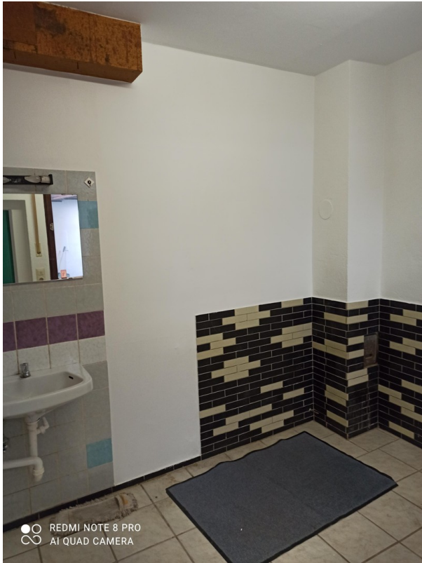
waschküche zugang vom Hof