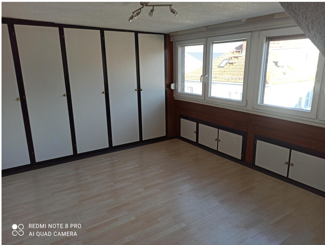
DG Zimmer zur strasse