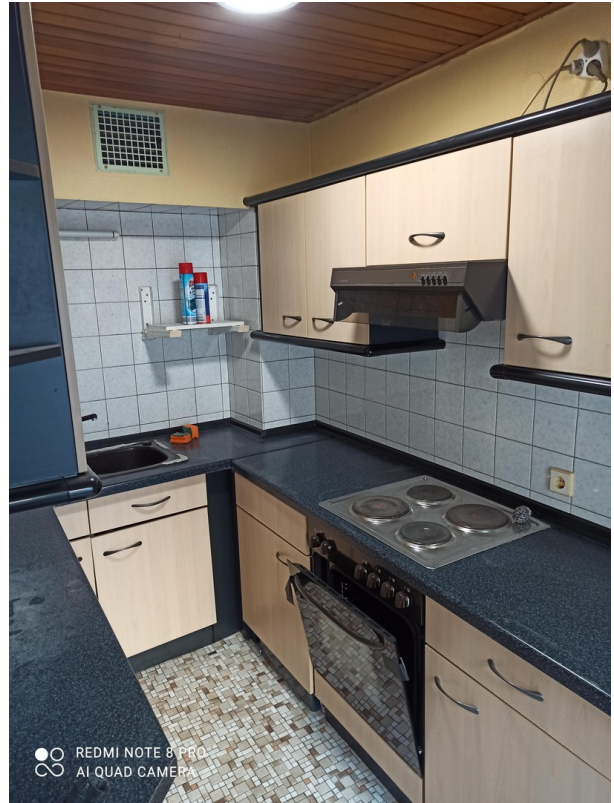
Küche OG wohnung II