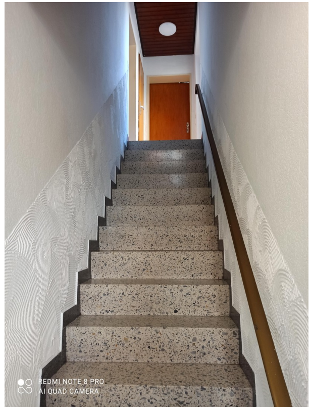
Aufgang zu OG von Strasse