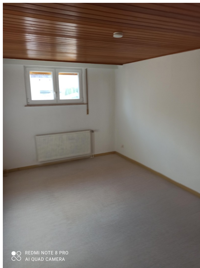
Zimmer EG - Wohnung