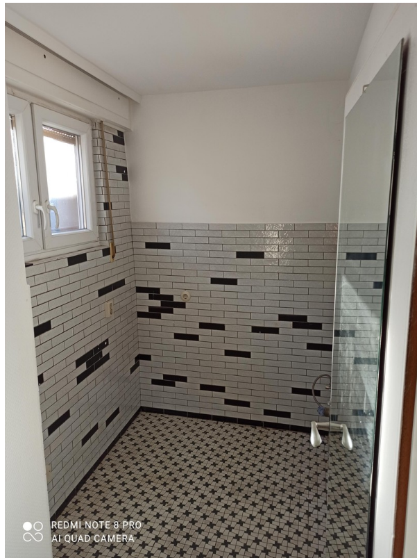
Küche OG-Wohnung 1