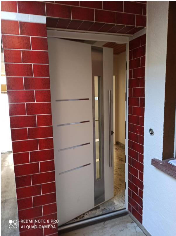
Eingang EG - wohnung vom Hof