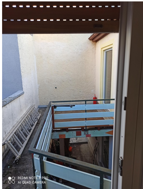
galerie zugang von OG