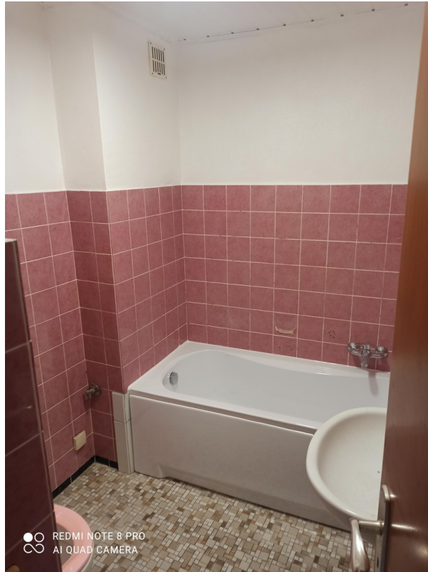
bad 2. OG wohnung