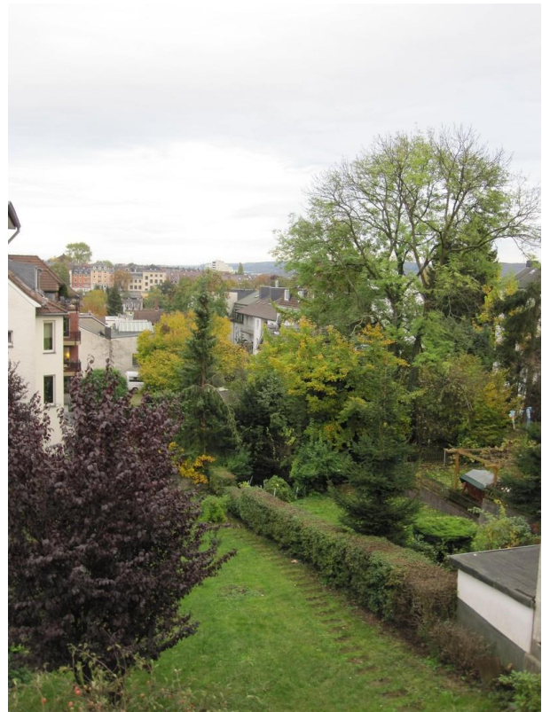
Blick in Garten