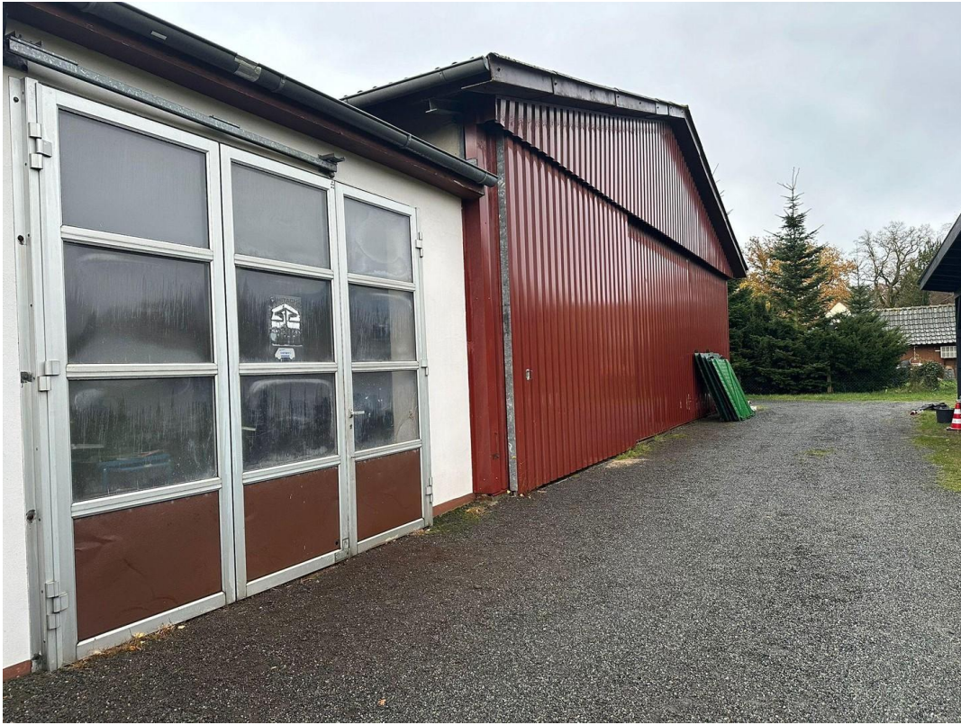
Halle und Werkstatt