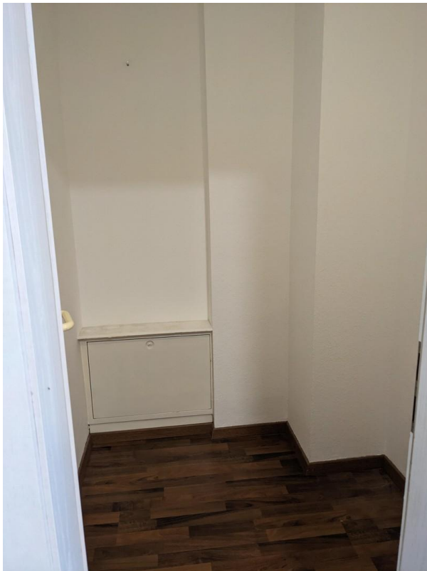
Abstellkammer in der Wohnung