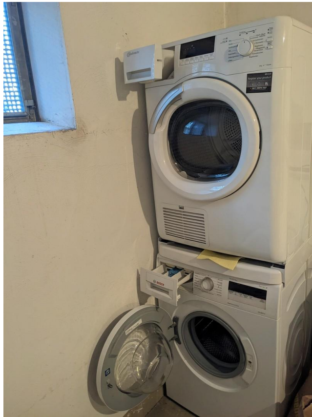
Waschmaschine und Trockner