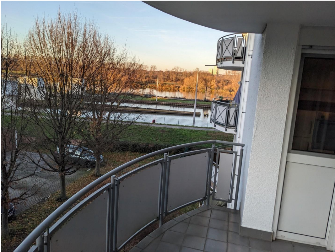
Balkon mit Main Blick