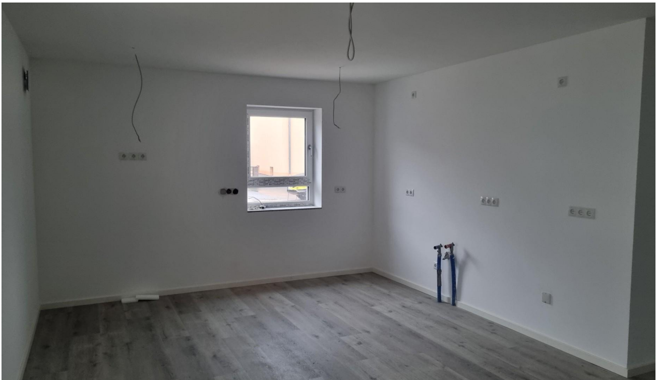
Küche / Essbereich