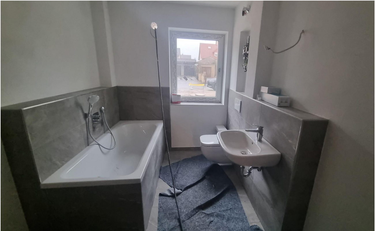
Badzimmer / Badewanne