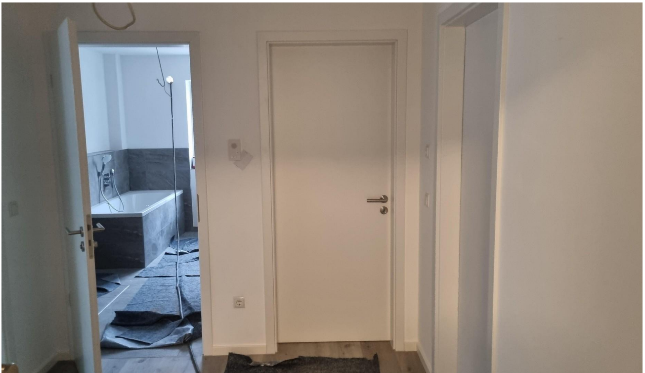
Flur - Richtung Badezimmer