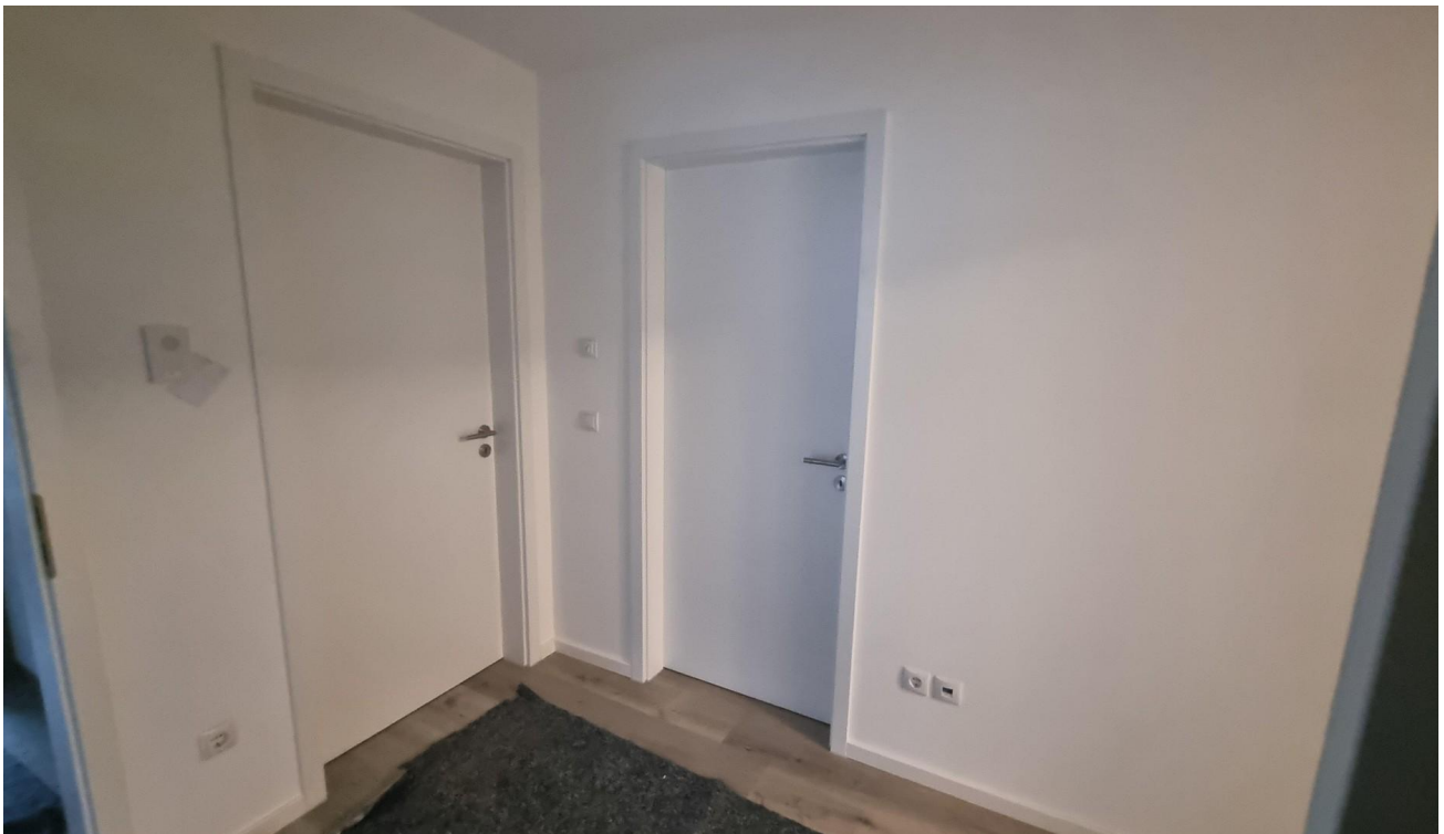
Flur - Türen Schlafzimmer