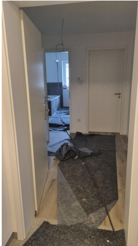
Eingangstür Wohnung / Flur