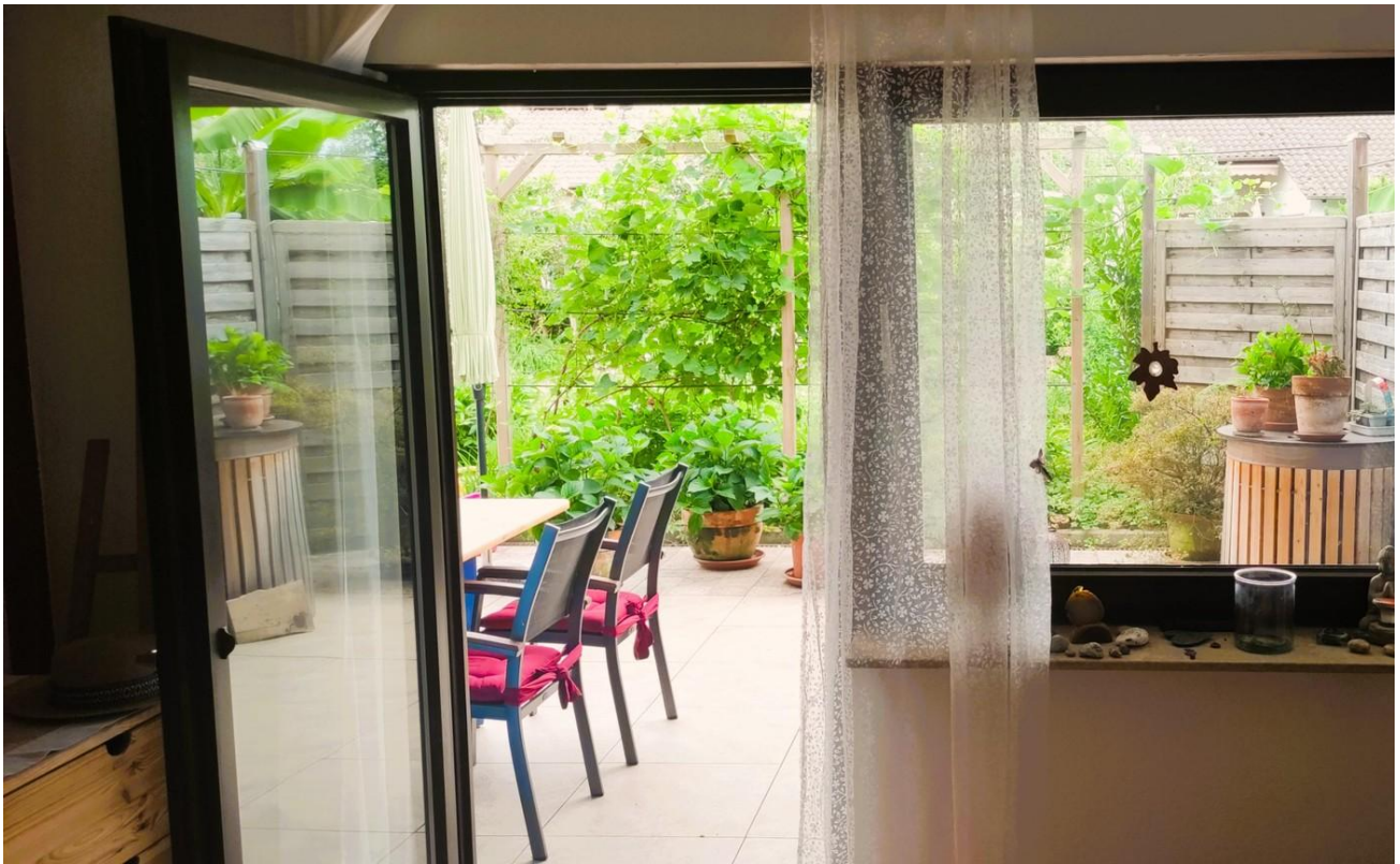
Schlafzimmer mit Terrassentür