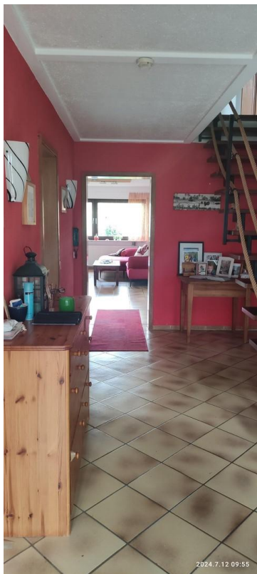
Flur und Treppenaufgang OG