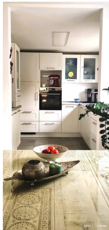
Küche und Installationen neu