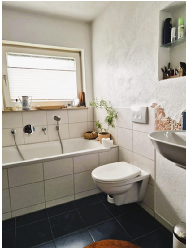
Bad im mediterranen Stil