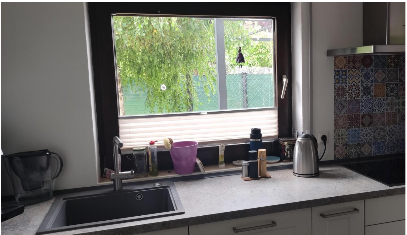
Küchenzeile mit Außenblick