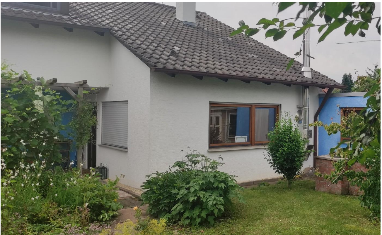
Gartensicht von hinten