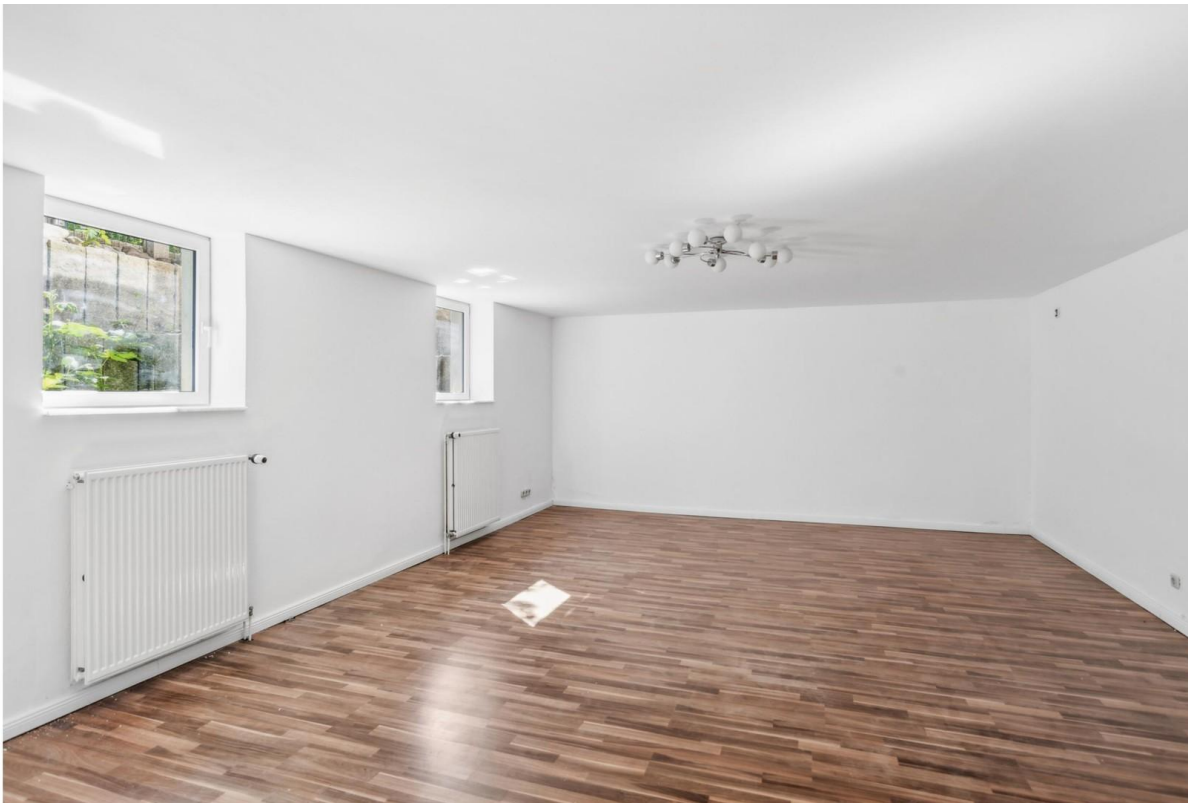
Großes Zimmer Keller