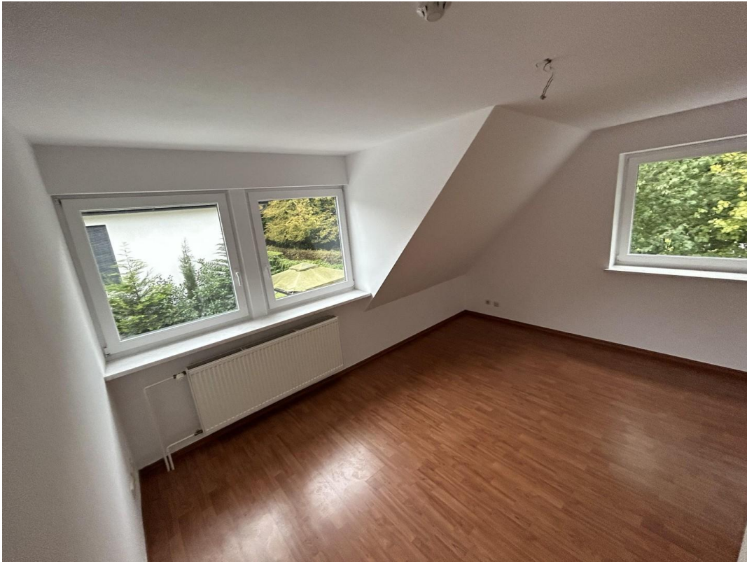
Zimmer 3 Dachgeschoss