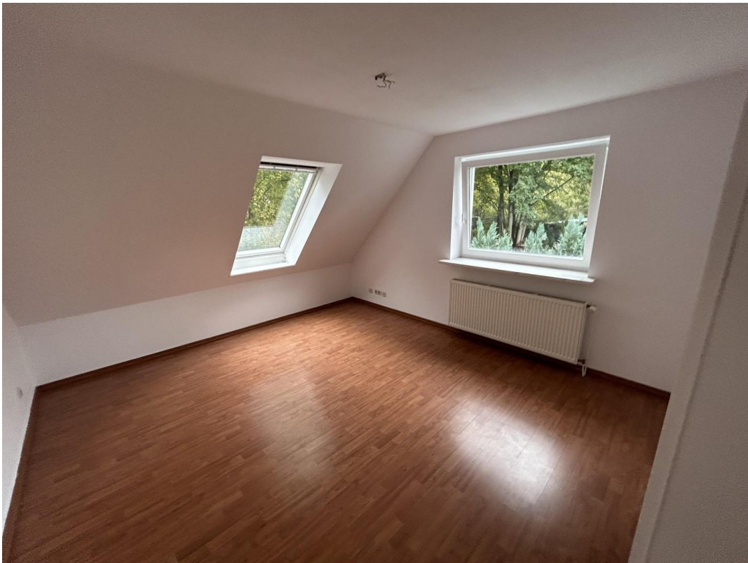
Zimmer 2 Dachgeschoss