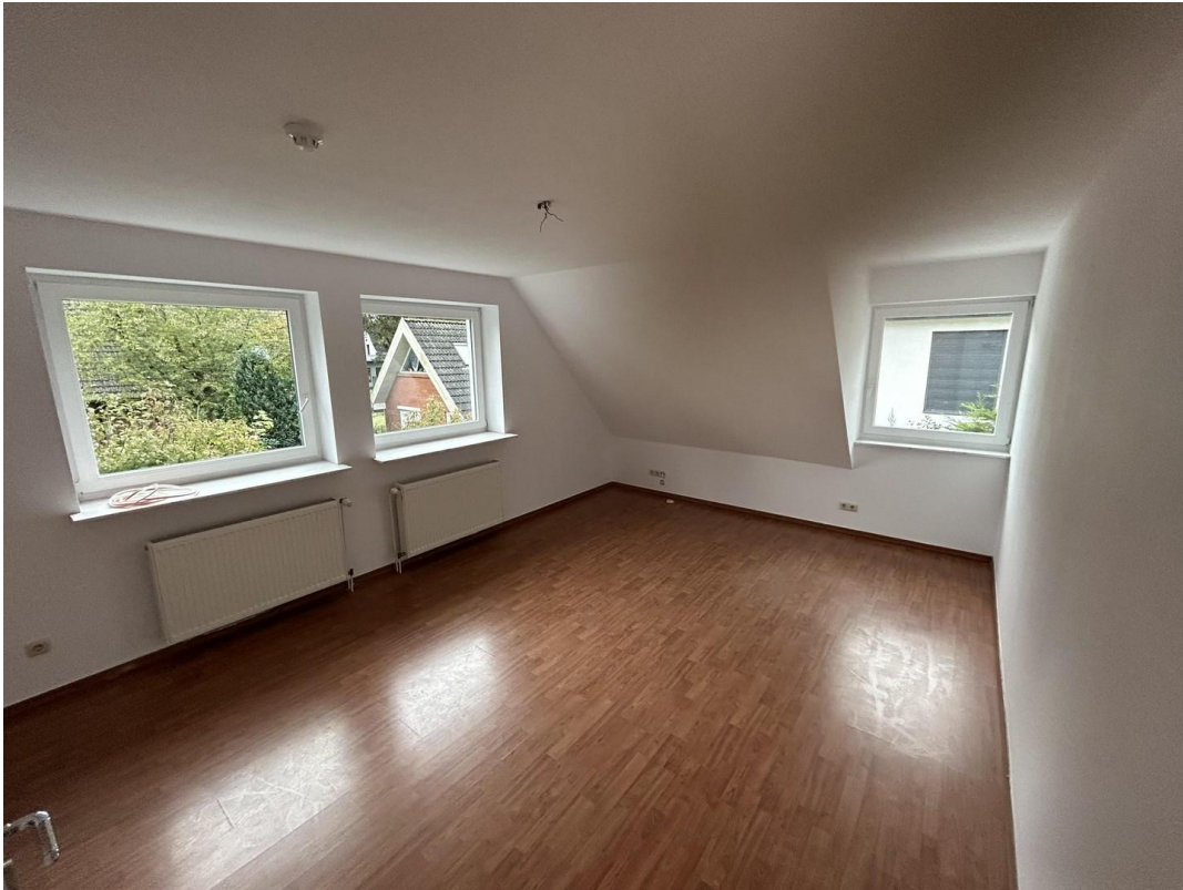
Zimmer 1 Dachgeschoss