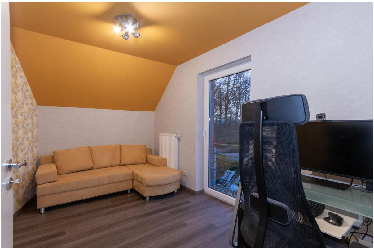
Büro 2 OG