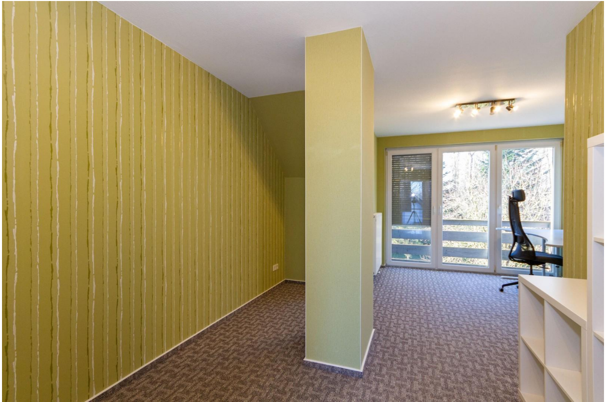
Büro 1 OG