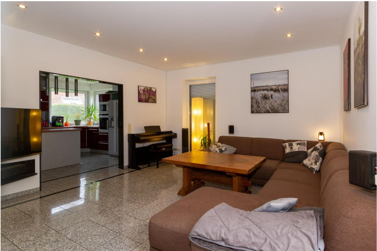
Wohnzimmer, Blick zur Küche