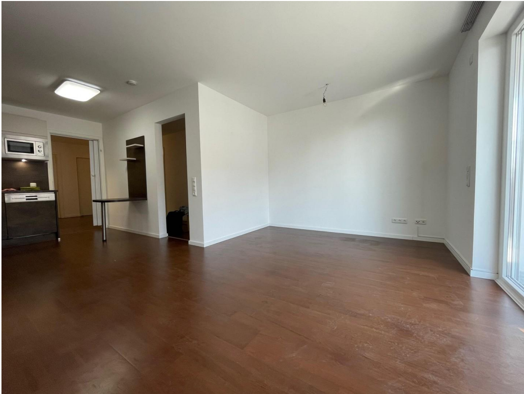
Wohn- und Essbereich