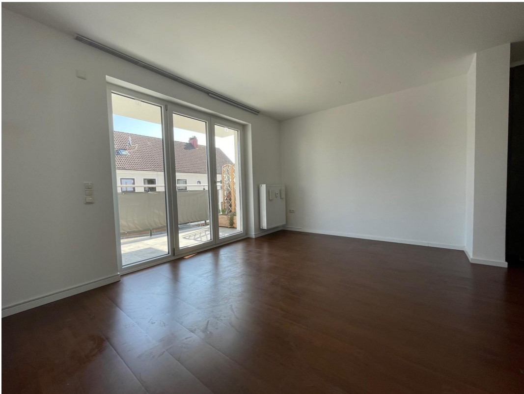
Wohn- und Essbereich