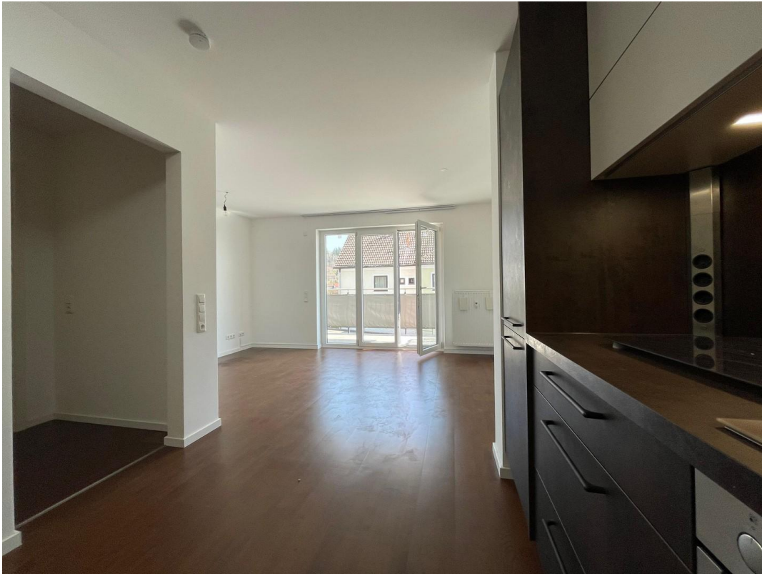
Wohn- und Essbereich