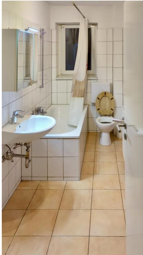
Badezimmer mit Fenster