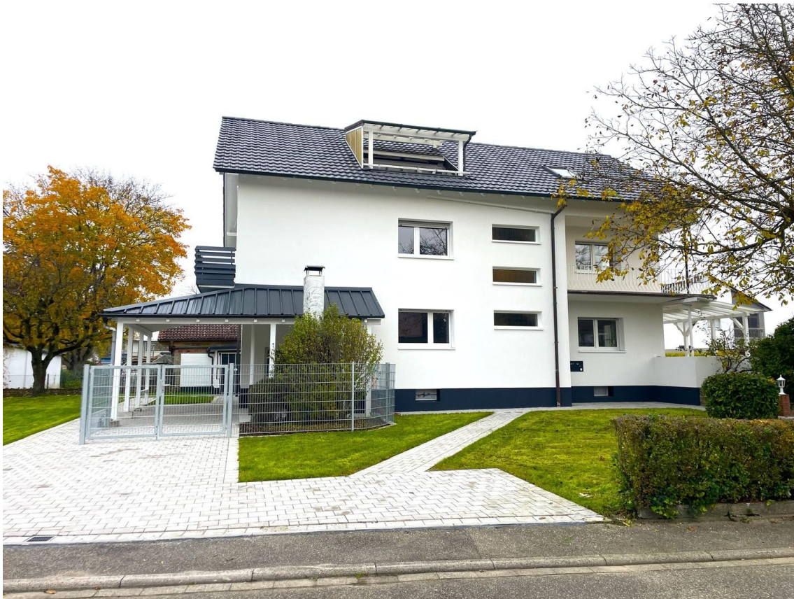
Ansicht Süd mit Gem.-Garten