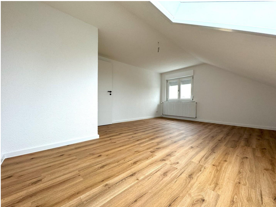
Schlafzimmer 2 DG