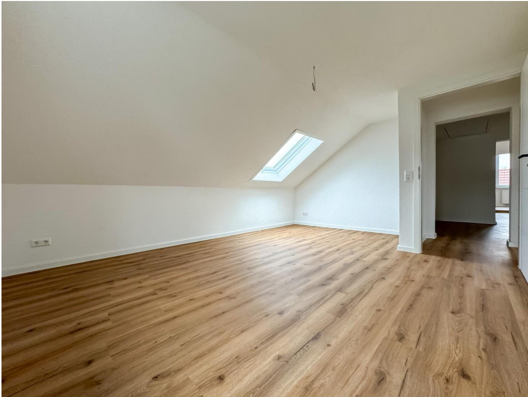
Schlafzimmer 2 DG