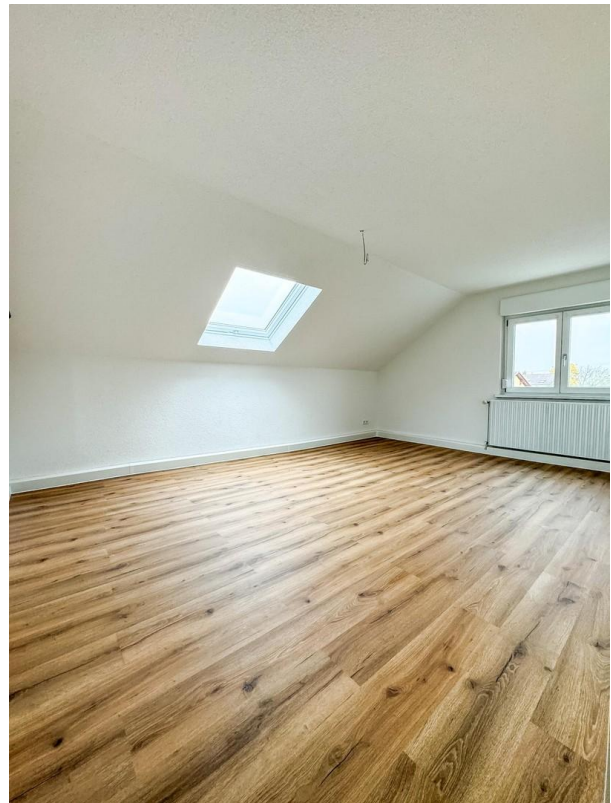
Schlafzimmer 1 DG