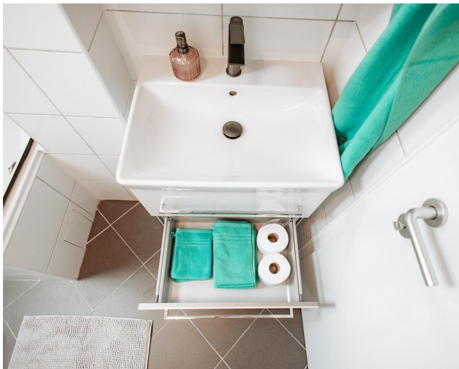
39 - practical and base cabine