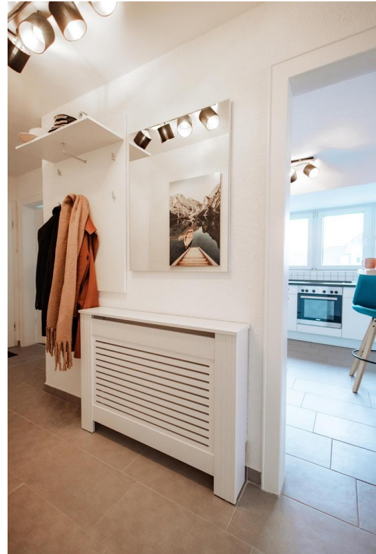
44 - view hallway kitchen