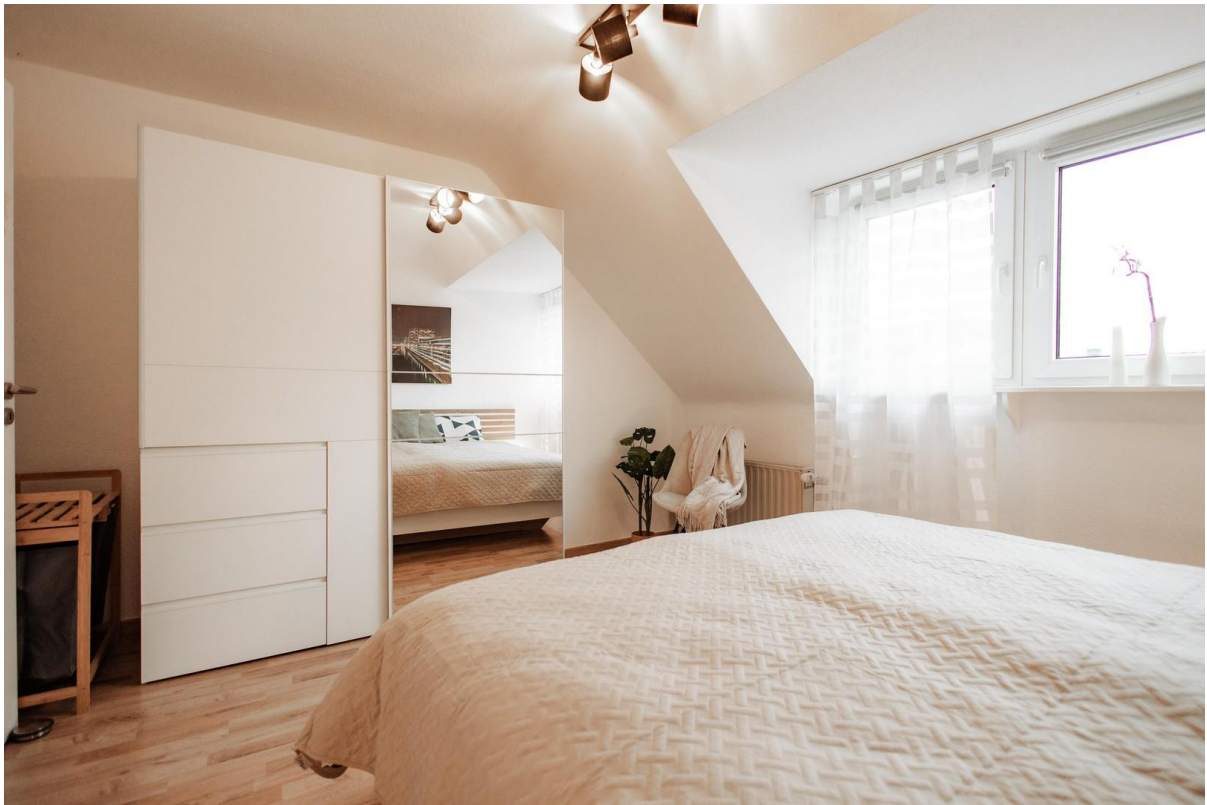
34 - large sliding door wardrobe