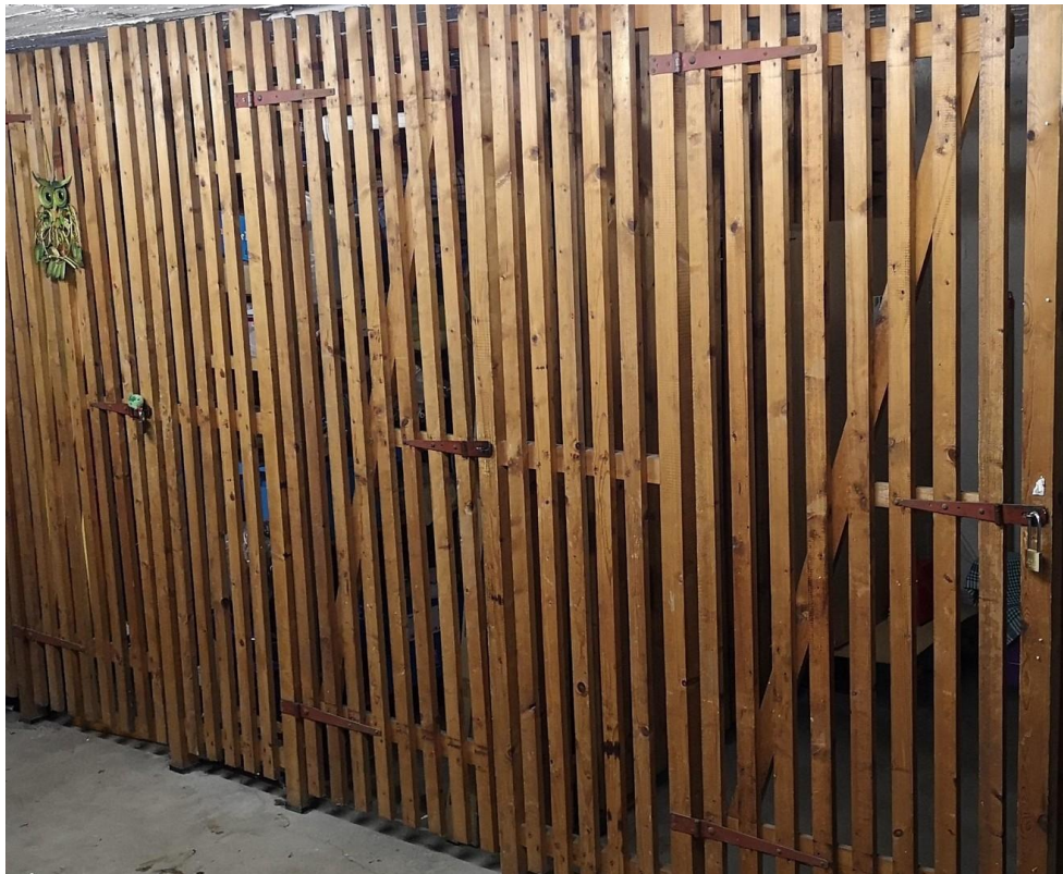
49 - basement storage