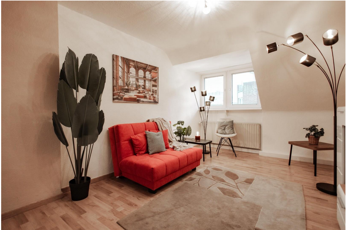
03 - spacious living room