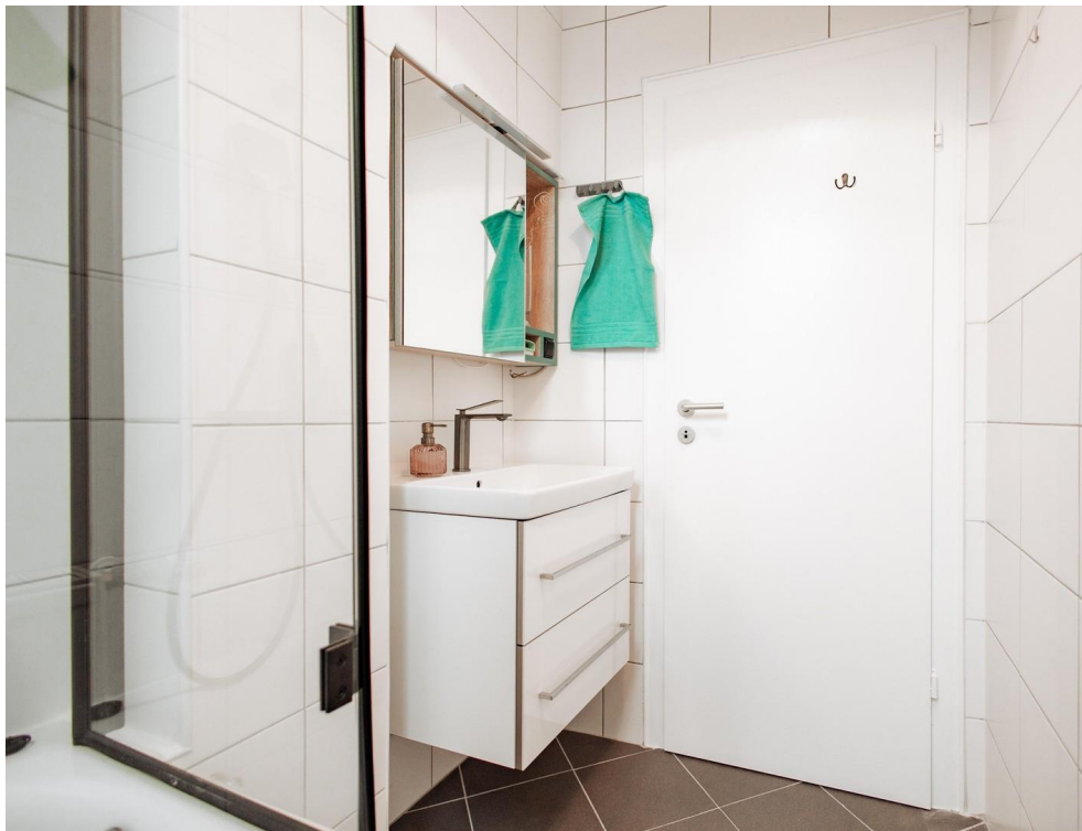
37 - branded washbasin and bas