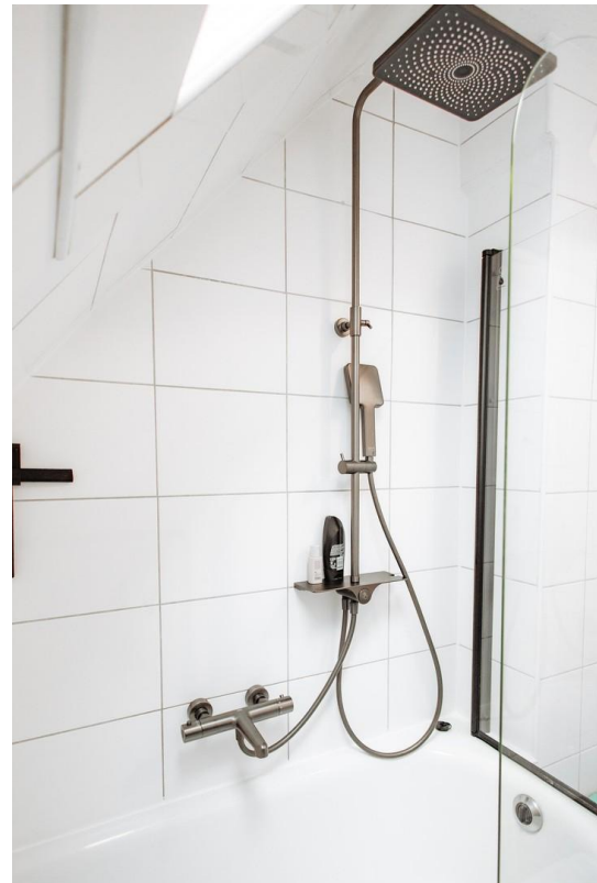
42 - new rain shower