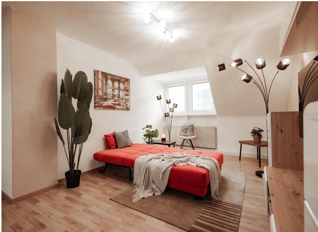
09 - TV and bed