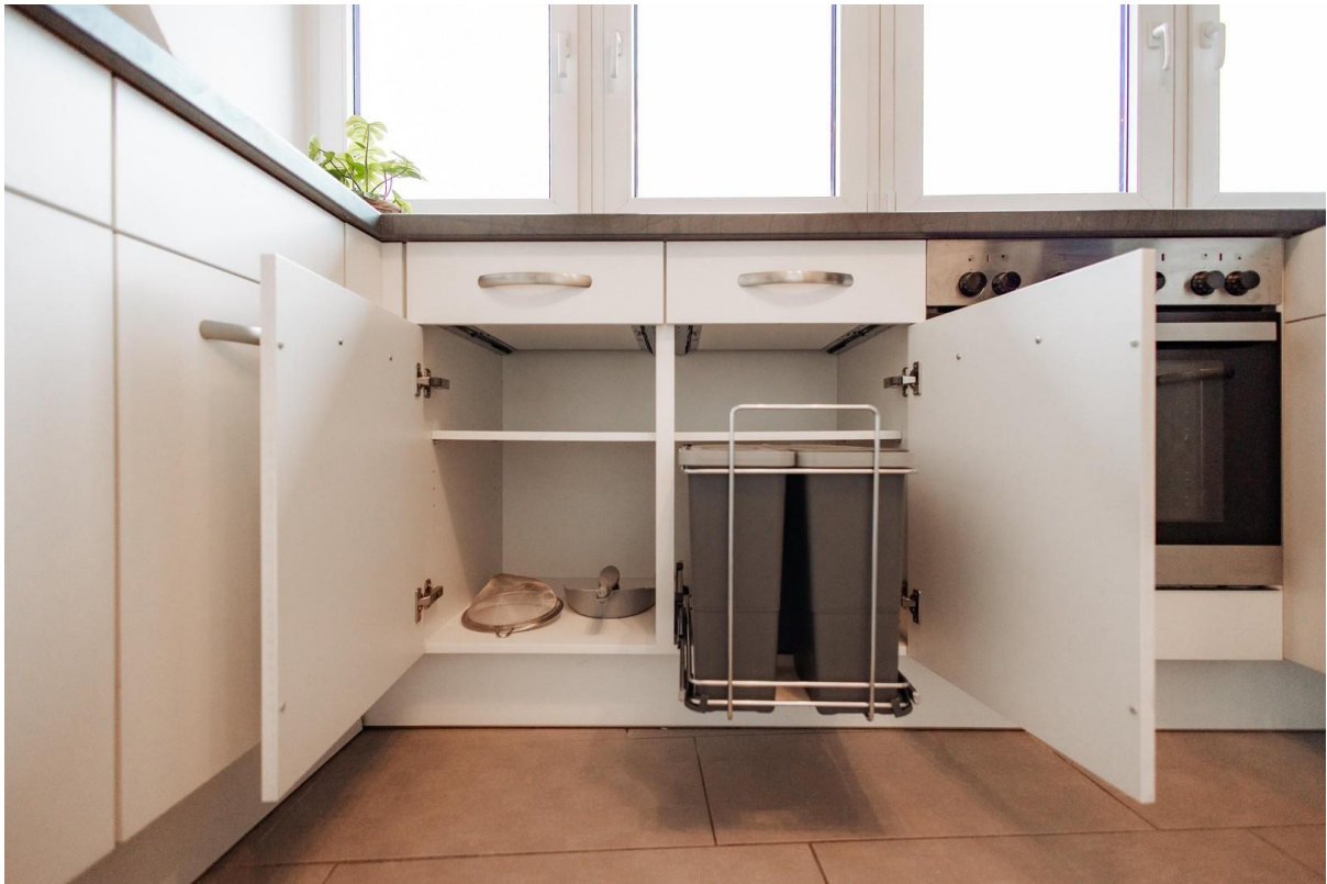
30 - New wast separator