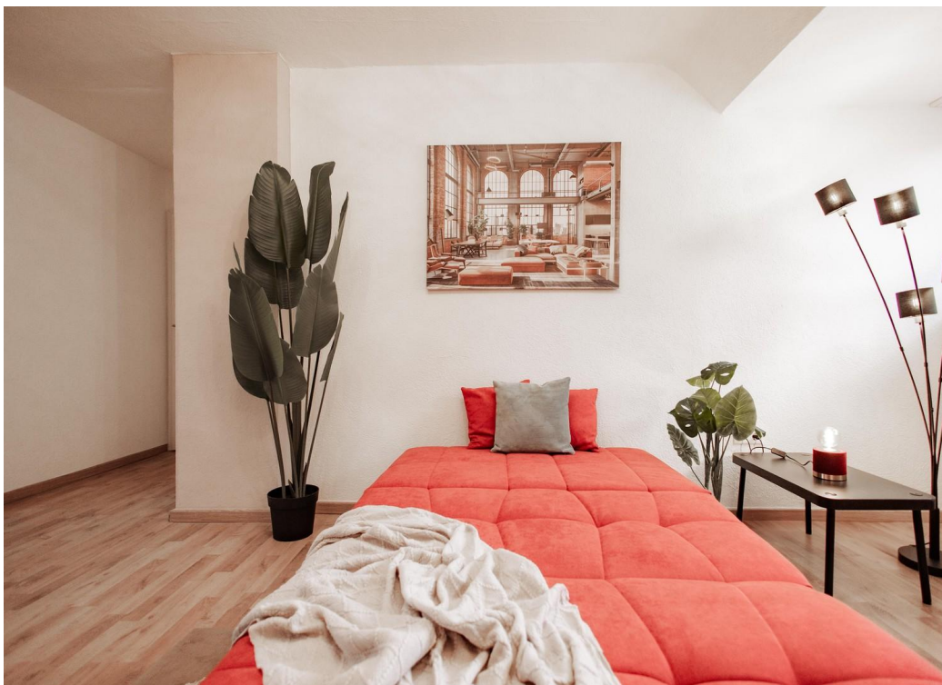
12 - sofa bed brand ell+ell