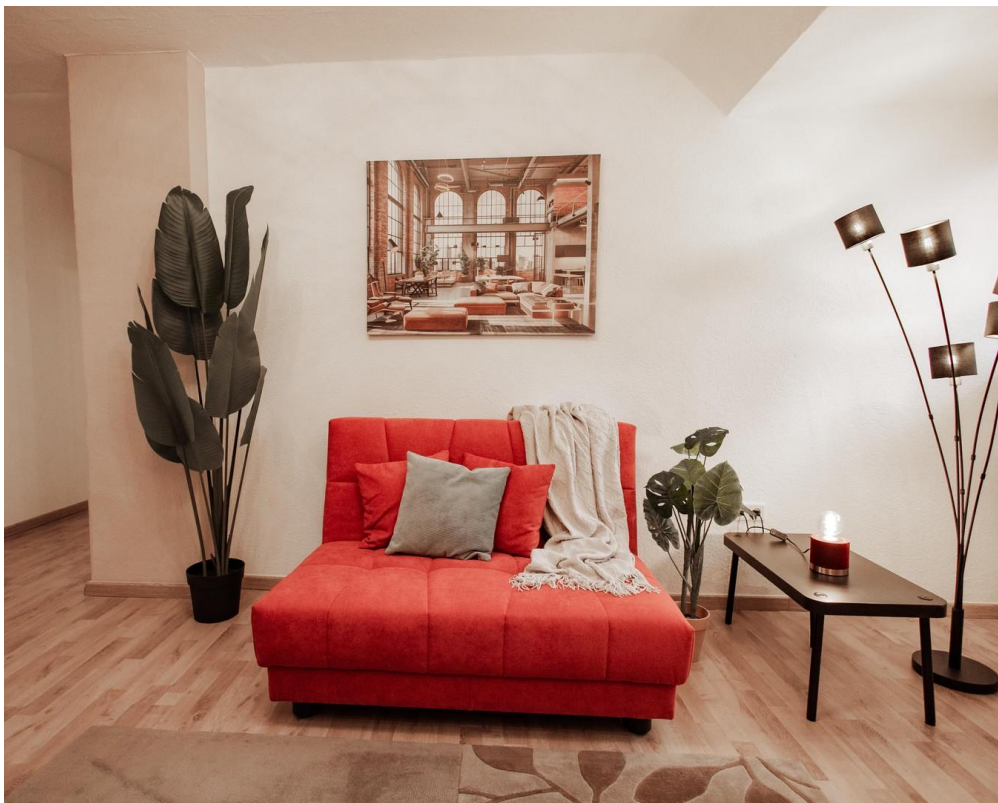
04 comfortable sofa