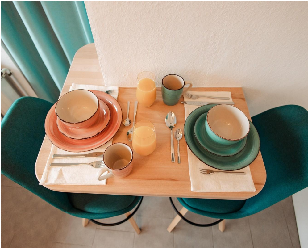
22 - Bon appetit