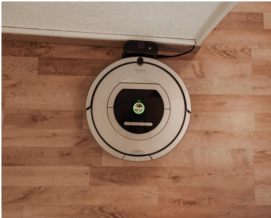
18 - robot vacuum cleaner