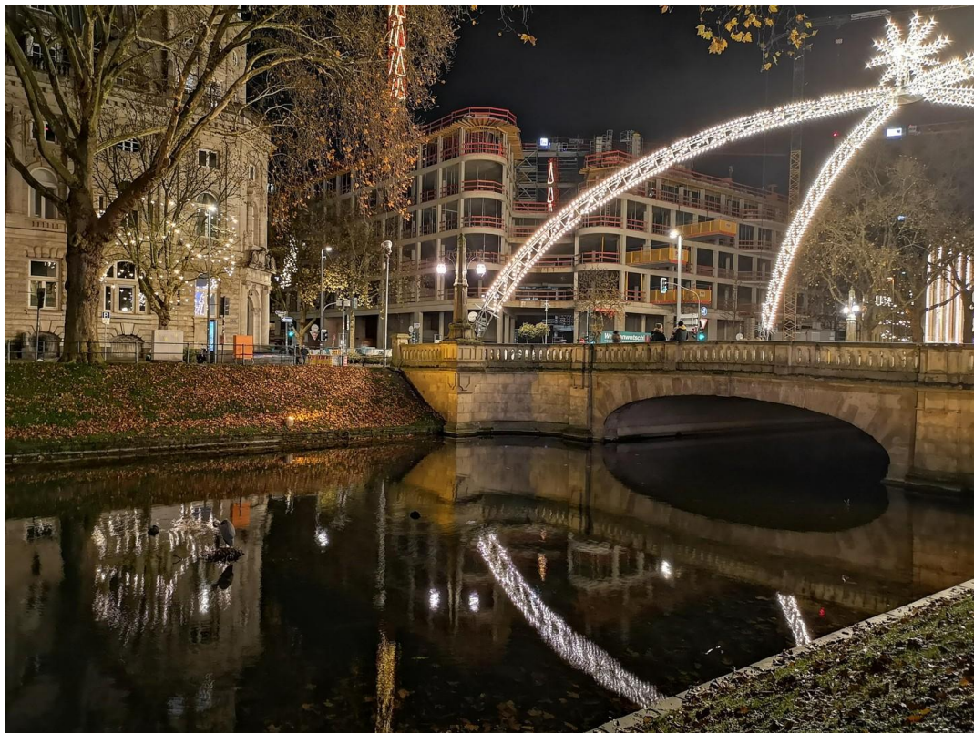
47 - Düsseldorf Kö an Weihnach