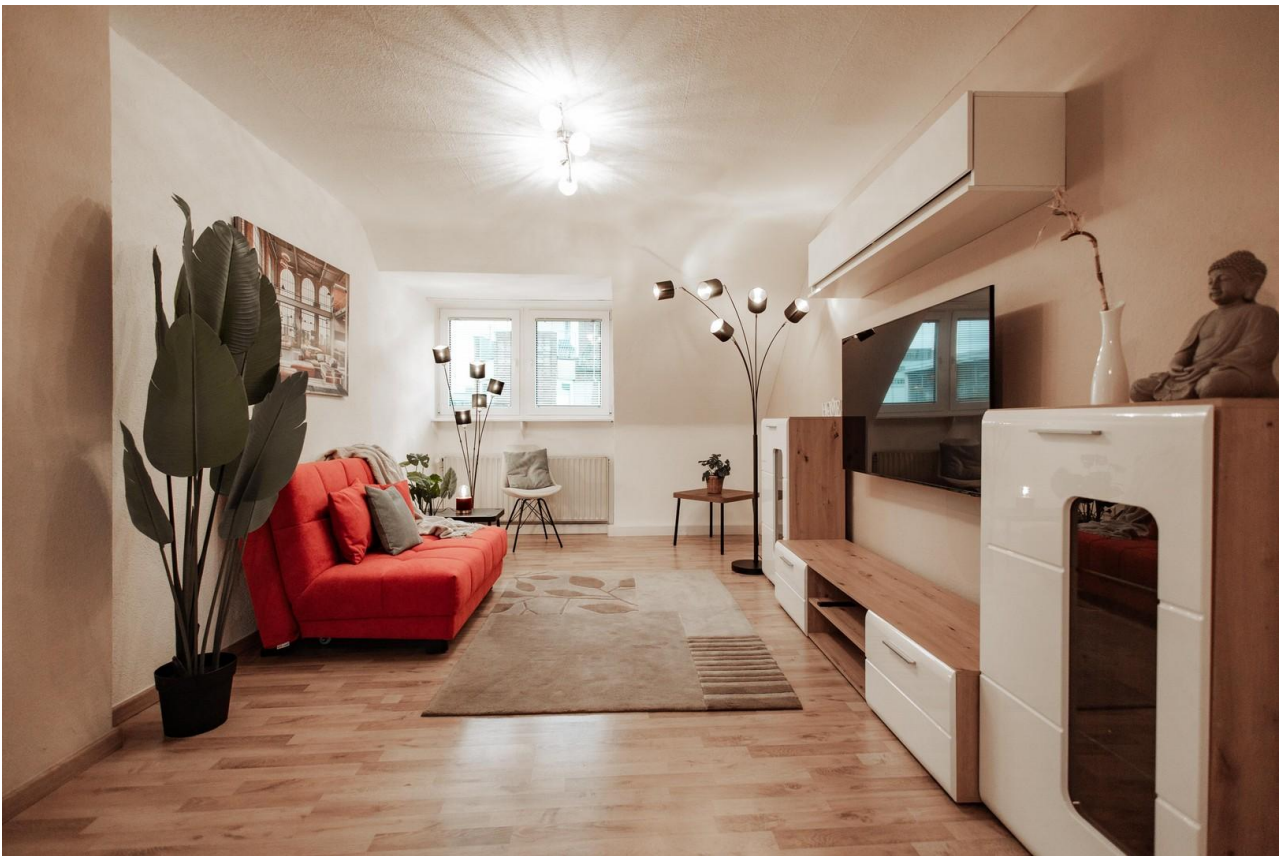
02 - large living room with 55