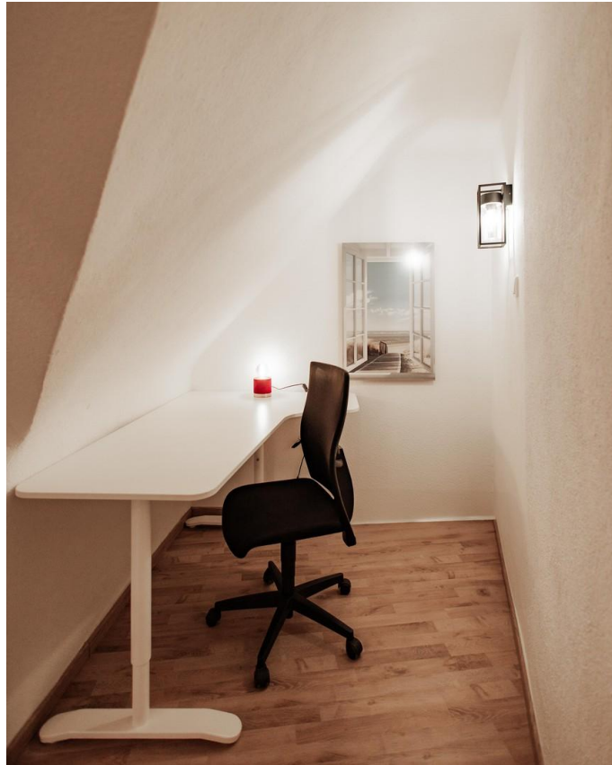
17 - new desk