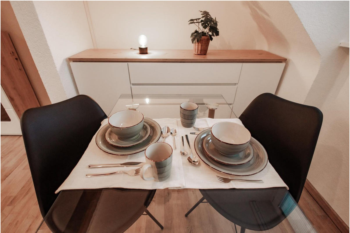
15 - Pleasant dining area