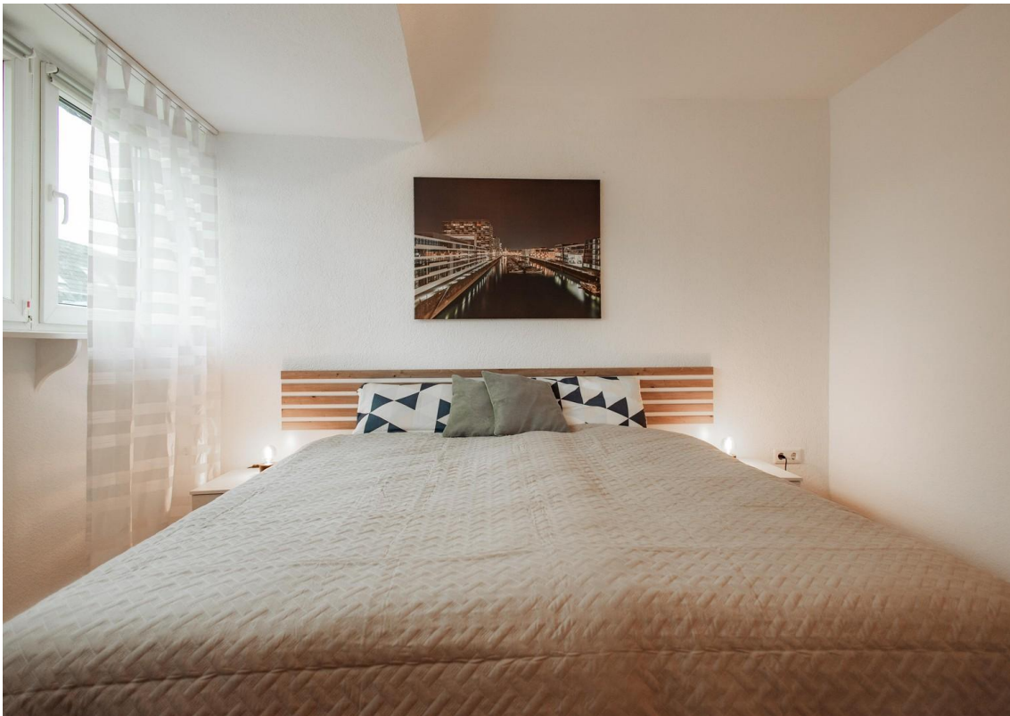
31 - new sleep oasis