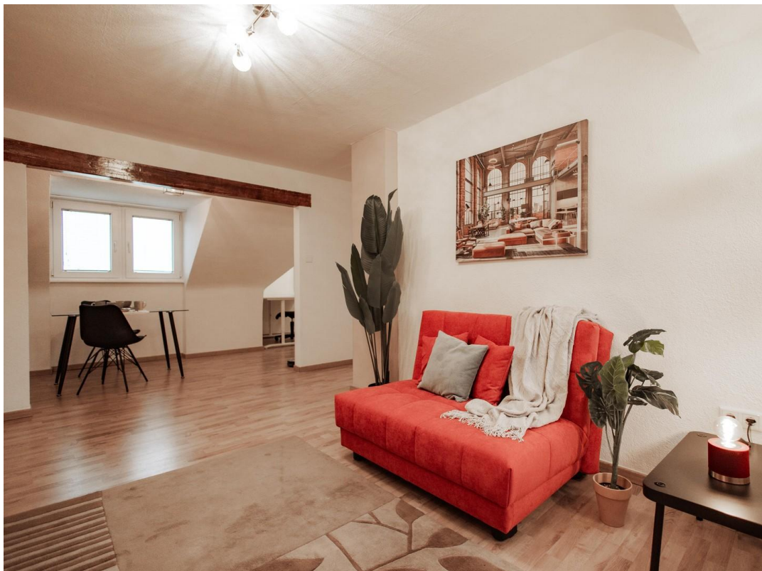
06 - Nice living room