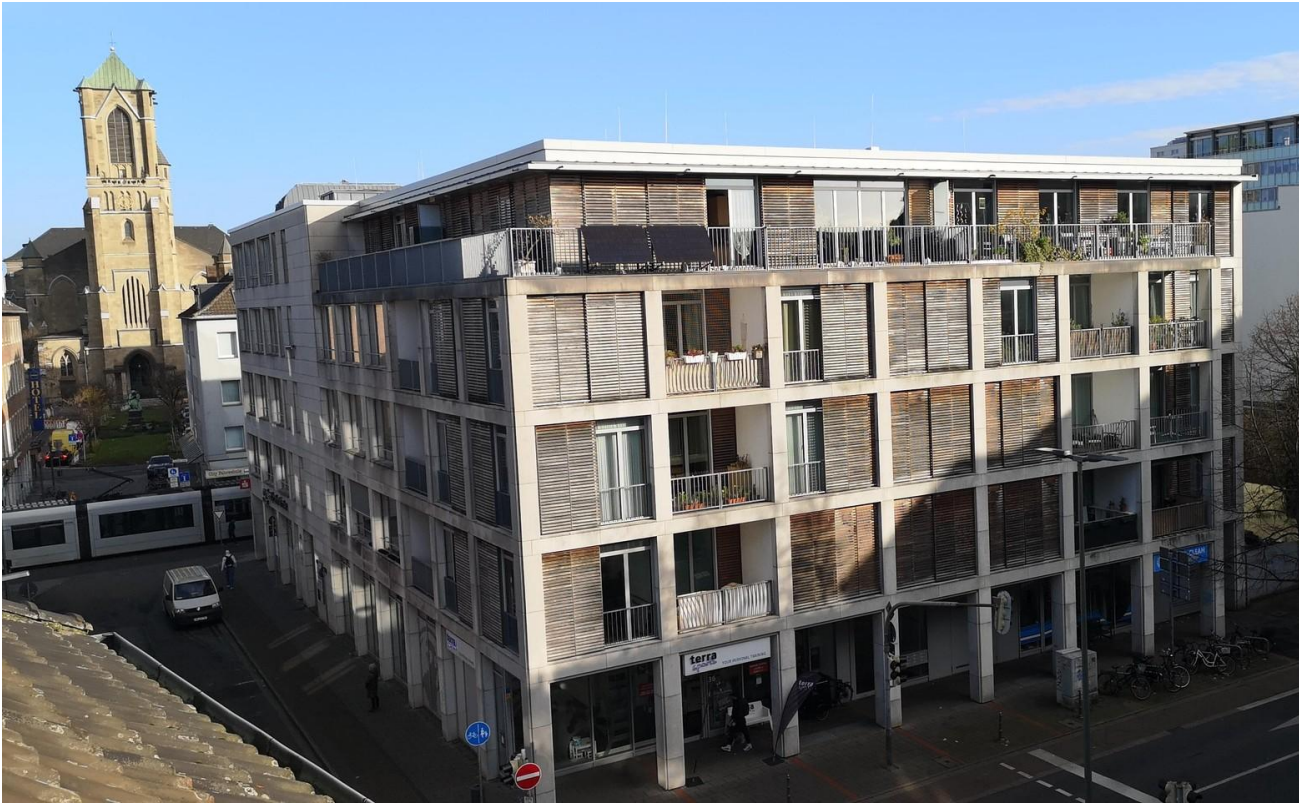
48 - view of the kitchen