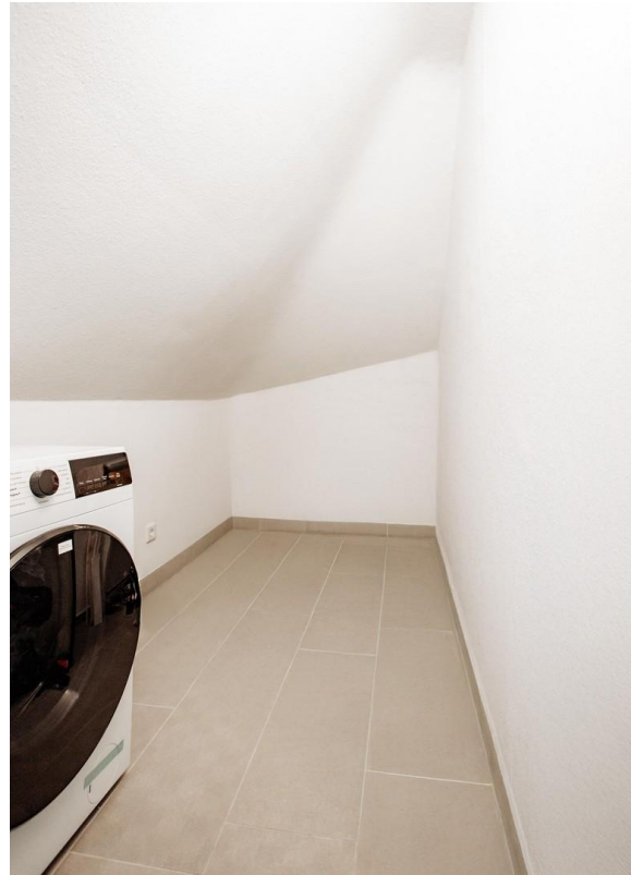
28 - Storage room now fully eq