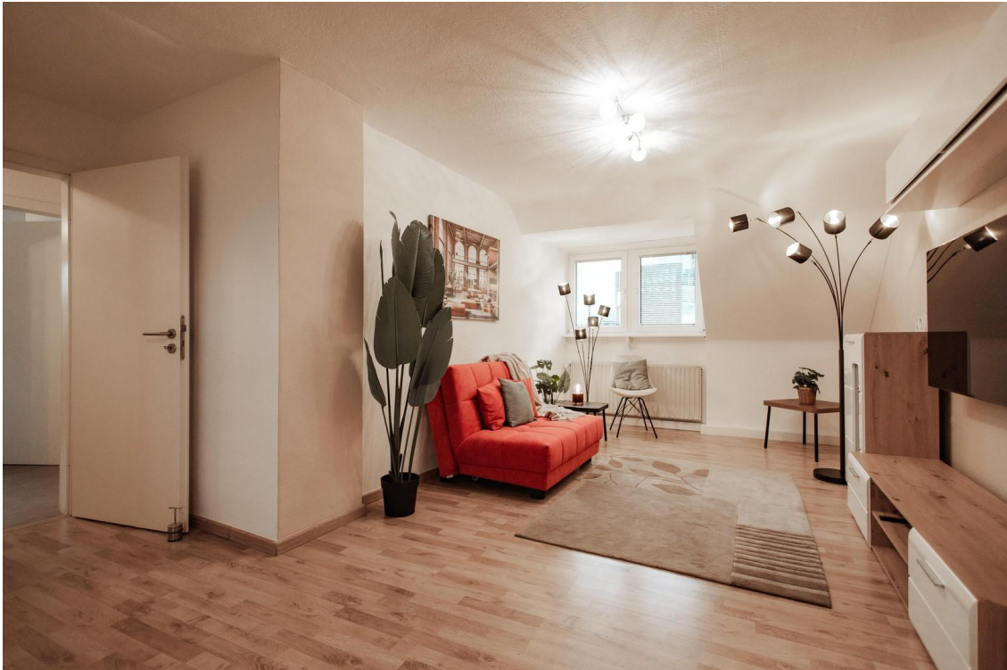
07 - unbenannt-17