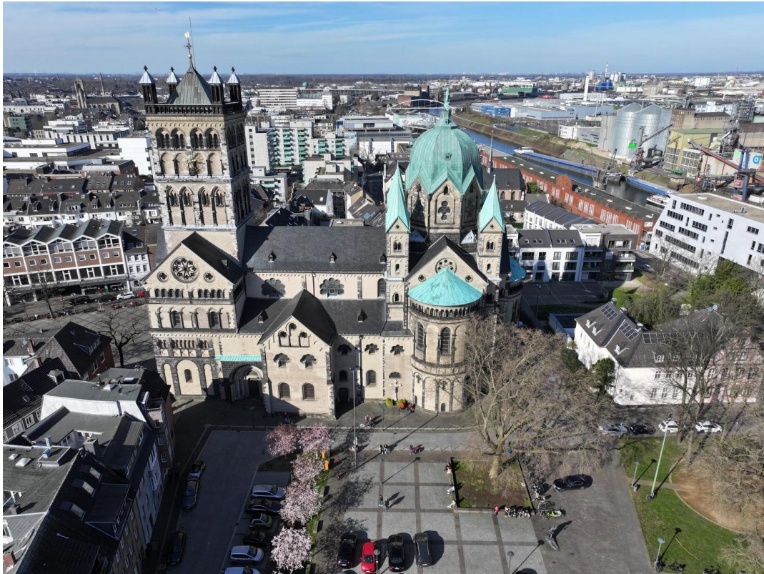
46 - People on Neuss Münsterpl