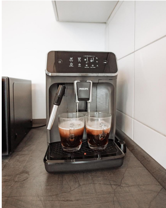
25 - new fully automatic coffe