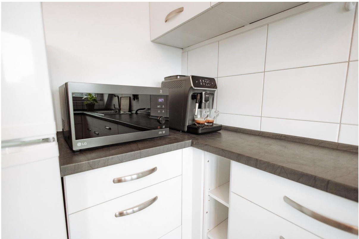
24 - brand new devices