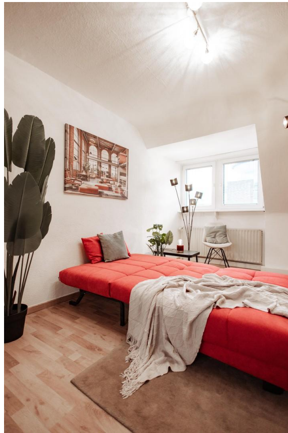
11 - large sofa bed