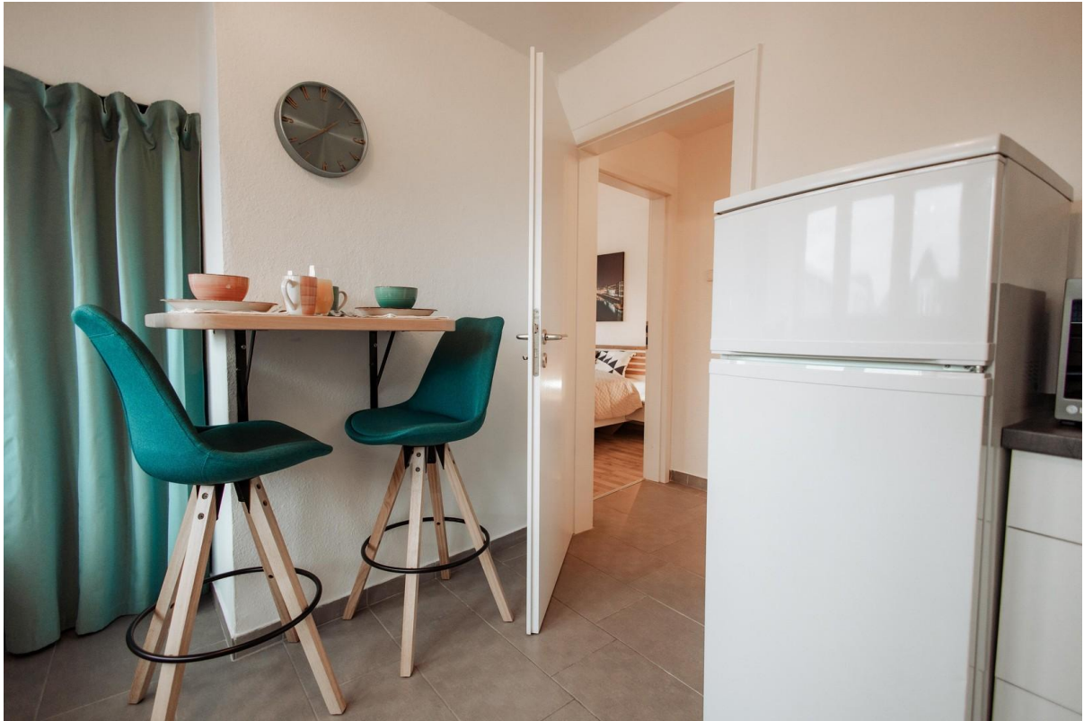
21 - very nice dining area