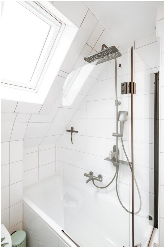
41 normal size bathtub with ra