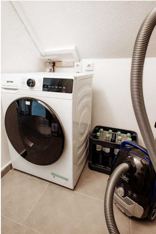
27 - practical quiet washer-dr