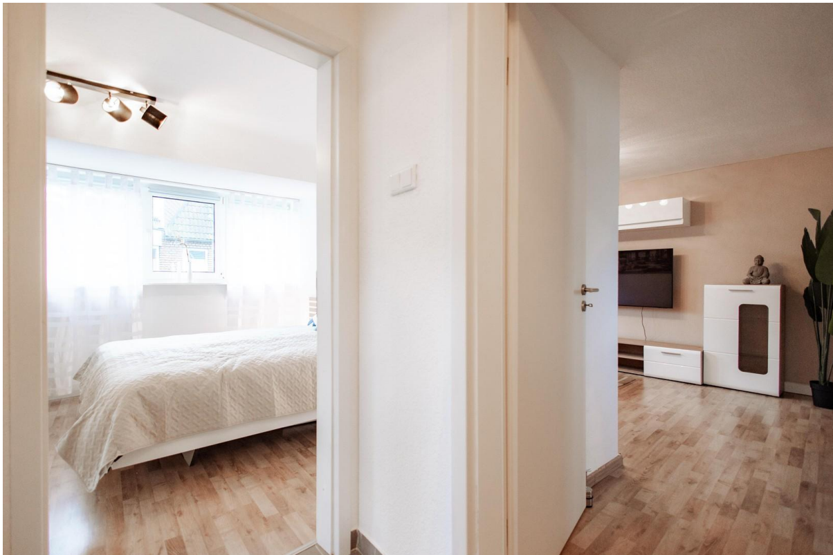
45 view hallway bedroom living