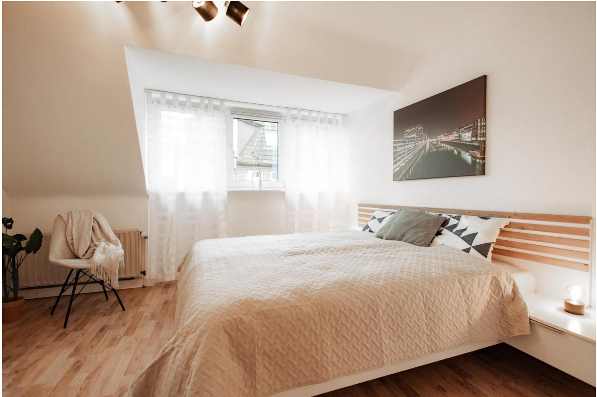
32 - sleeping with nice view (