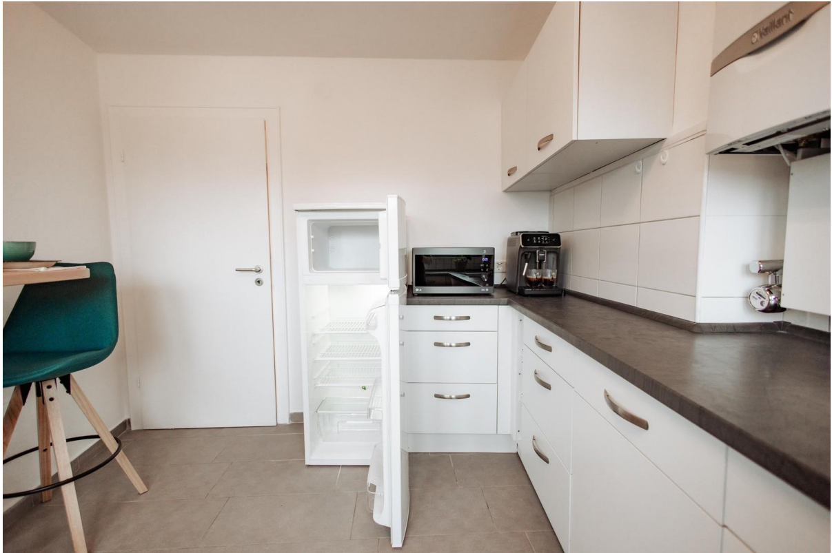
23 - new fridge-freezer combin