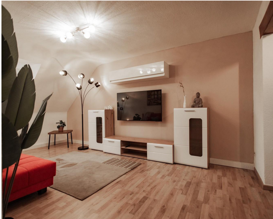
13 spacefull living room