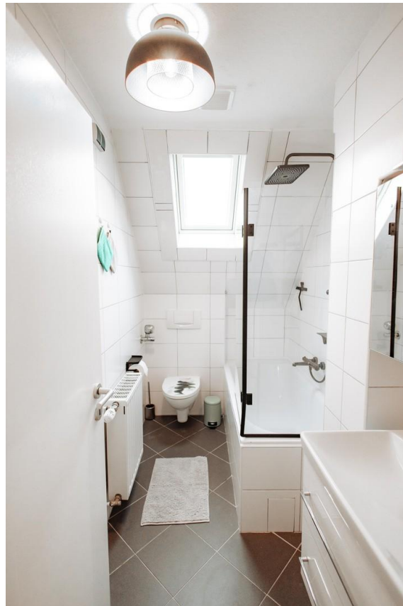
36 - New equipped bath room