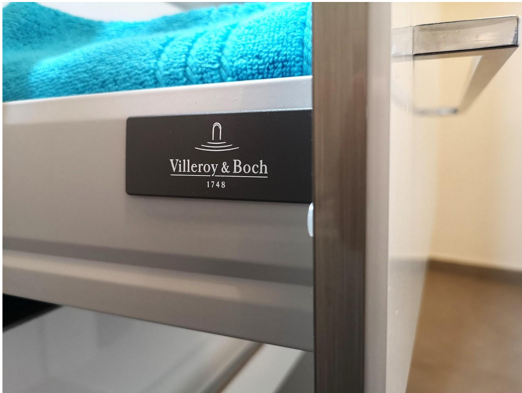
40 - Villeroy und Boch