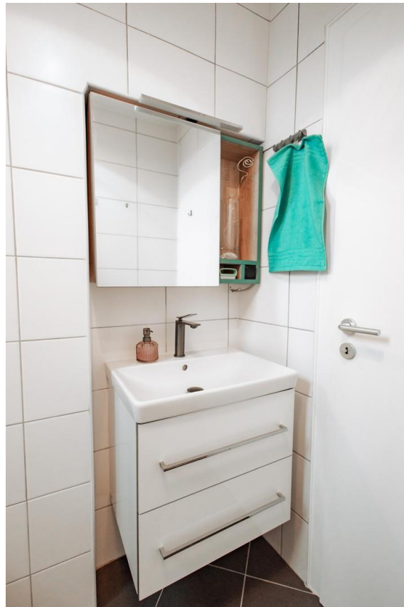
38 - Einbau Spiegelschrank mit