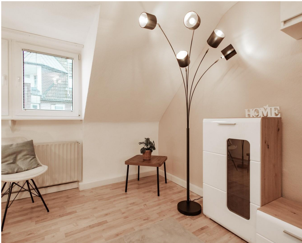
05 - pleasant lighting everywh