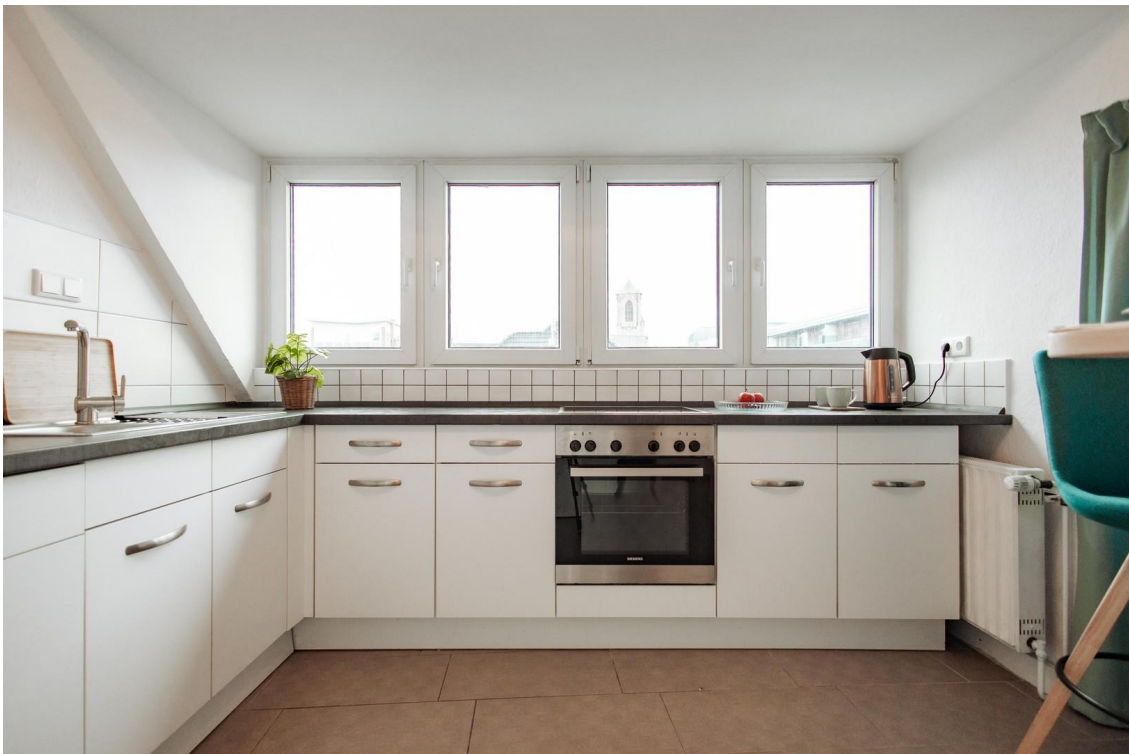
20 - very spacious kitchen