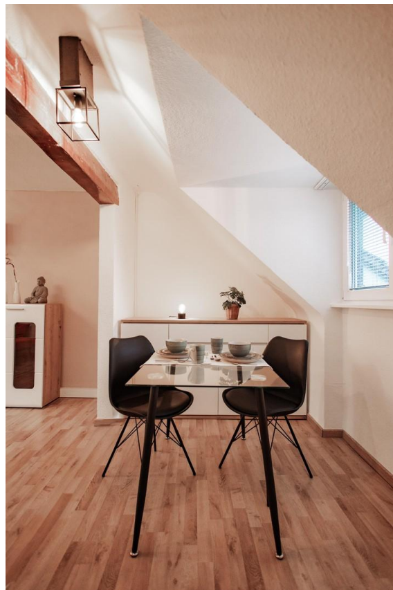
14 - dining area place for 4