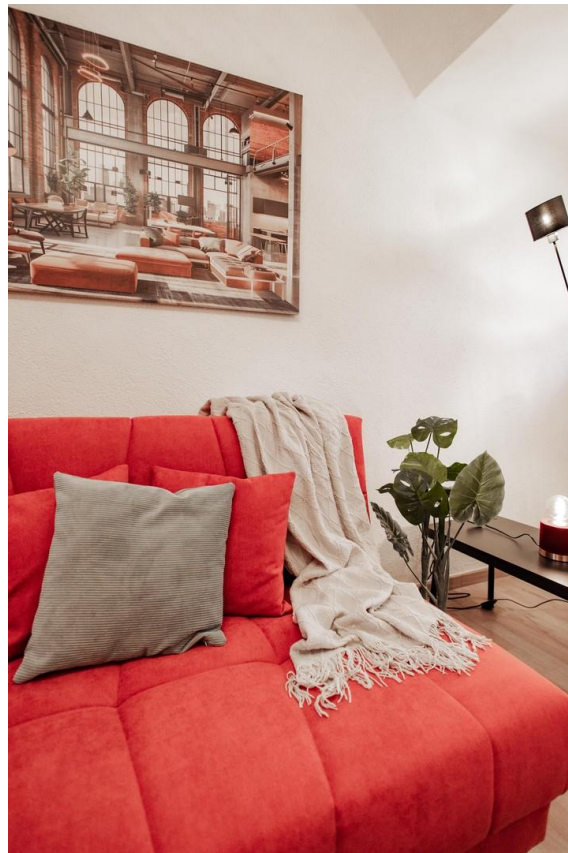
08 - nice pictures