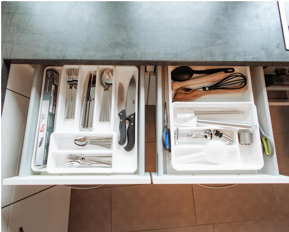
29 - Ready-to-move-in equipmen