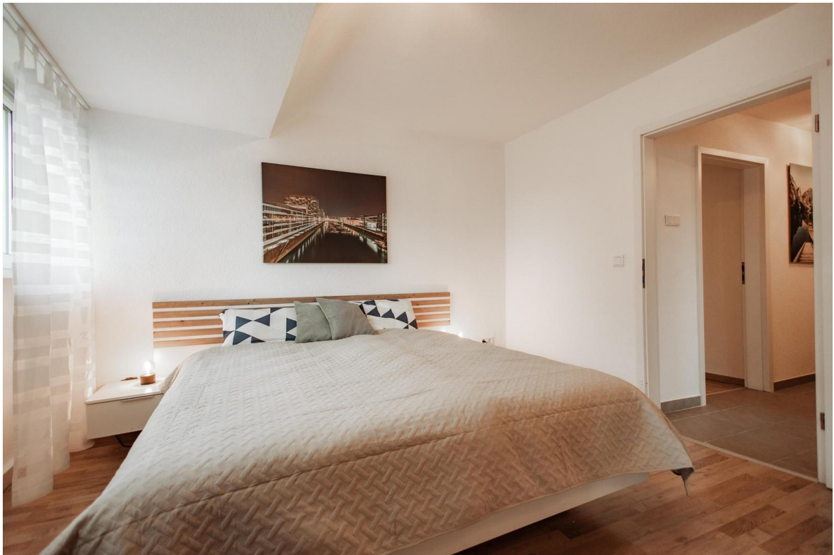
33 - Two mattresses brand Möve