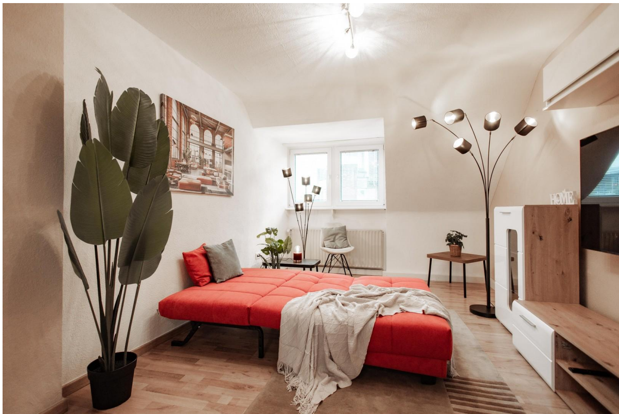
10 - sofa bed brand ell+ell