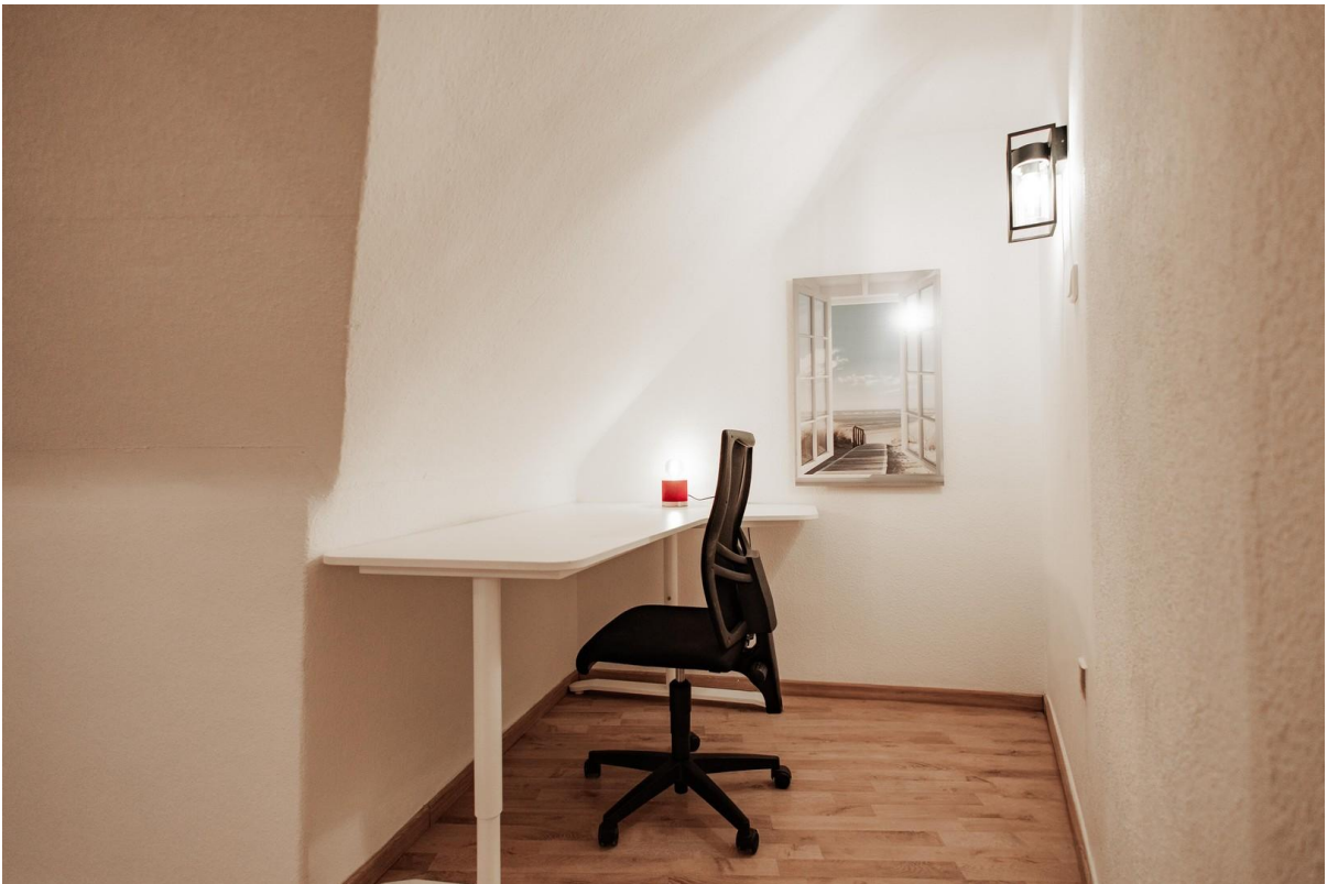
16 Practical work corner