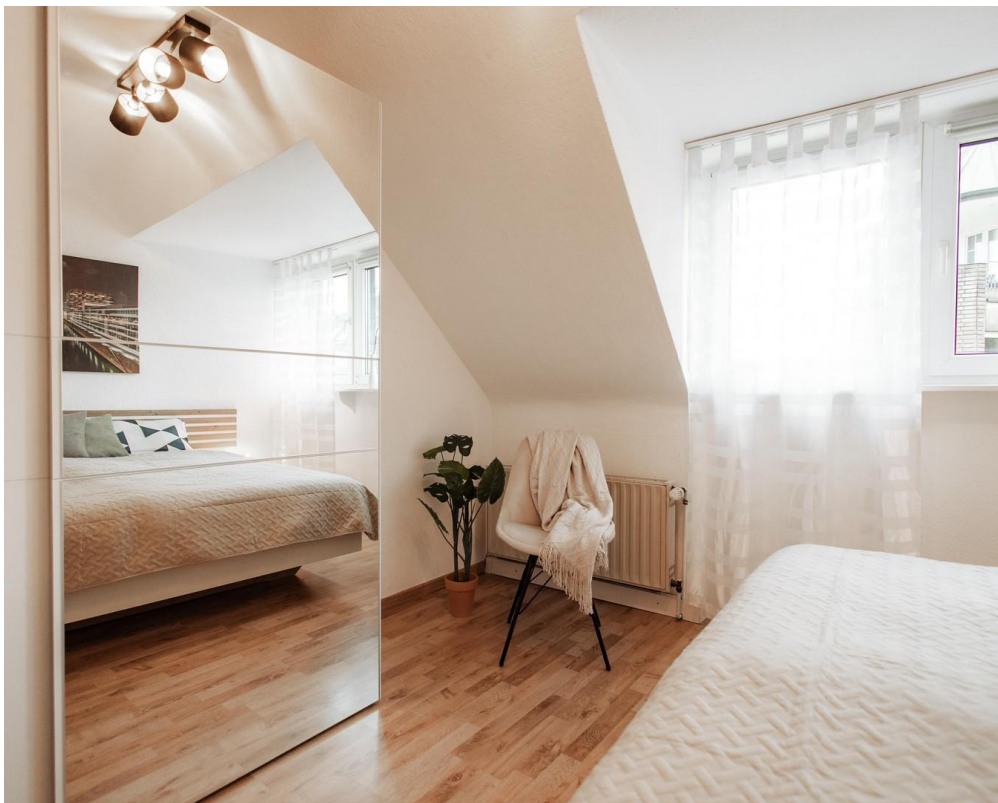
35 - big mirror