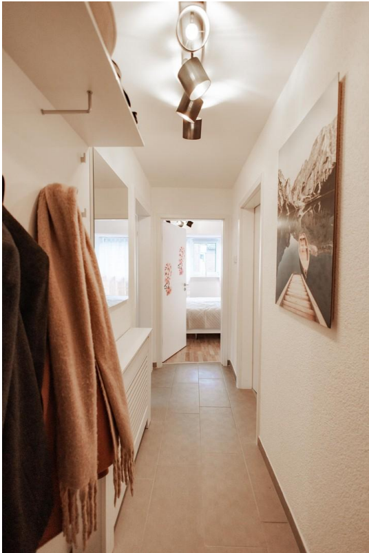
43 - long hallway