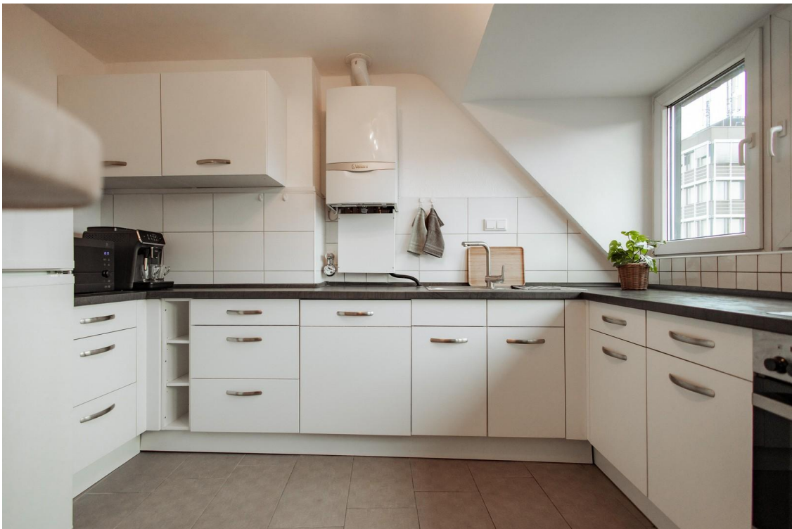
26 - very spacious kitchen