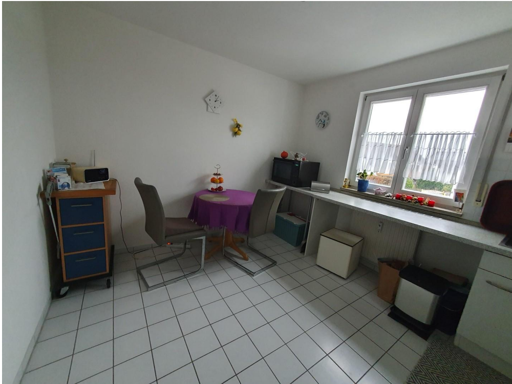
Wohnküche: 11,5 qm