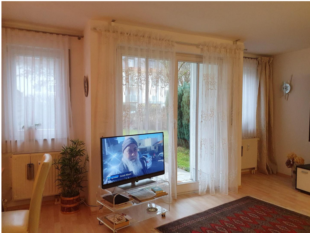
Wohnzimmer: 25,2 qm