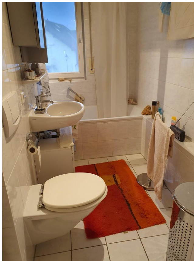
Bad: 4,9 qm