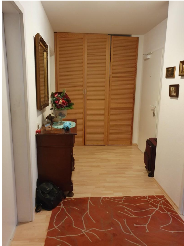
Diele: 9,9 qm