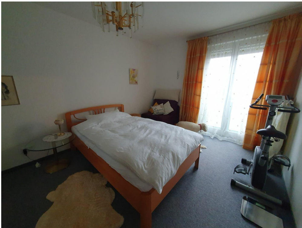
Schlafzimmer: 15,4 qm