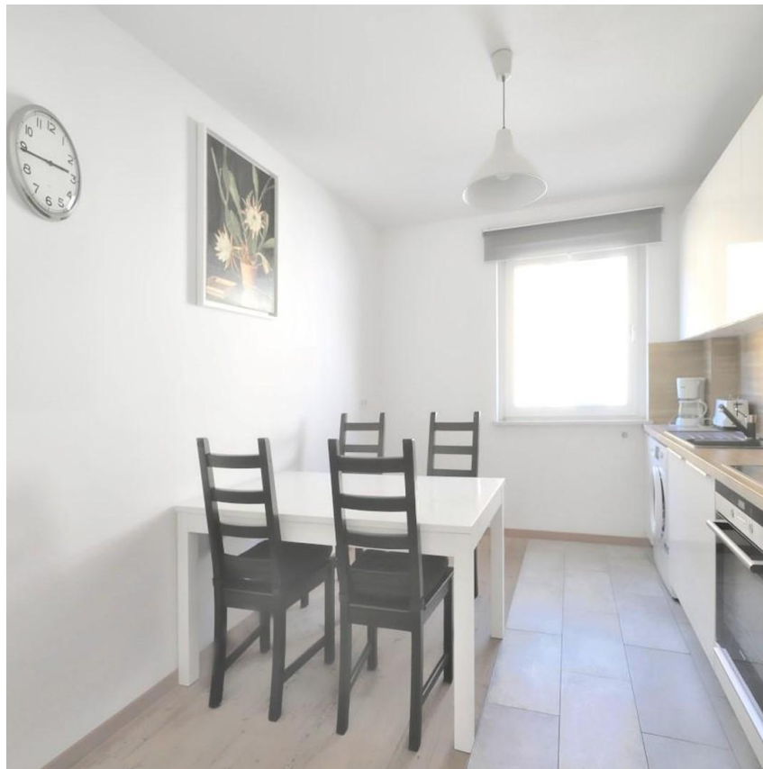
Küche mit Esstisch