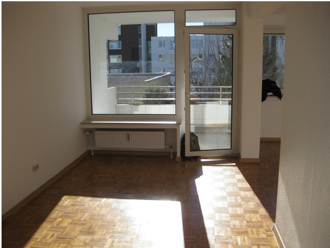
Wohnzimmer / Essbereich