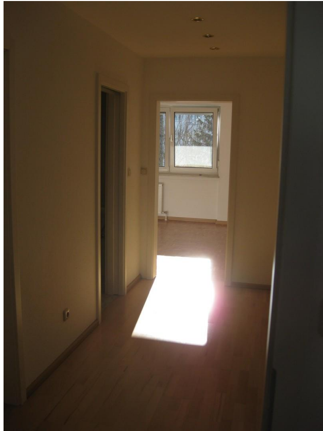
Flur Richtung Wohnzimmer