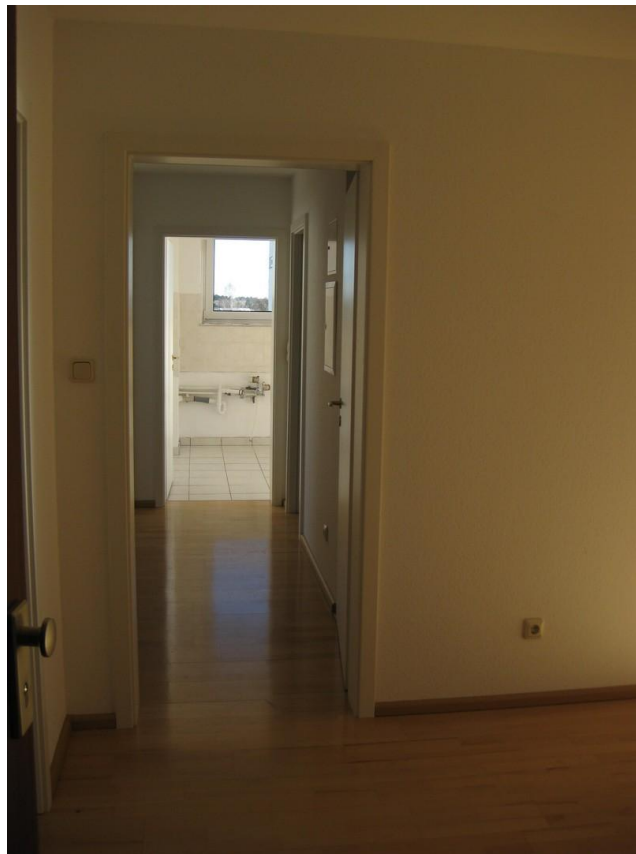
Flur Richtung Küche